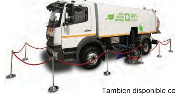
También disponible como VS6 E.