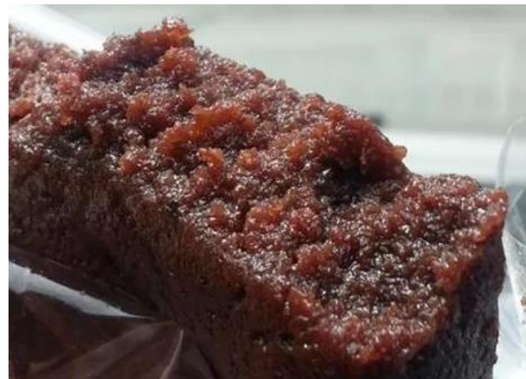
Cajeta de Zapoyol