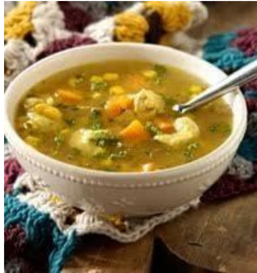
Carrú. Comida preparada a base de maicillo (trigo) o maíz de primera, dorada y molido finamente. Se agrega agua y gallina india en trozos, manteca de cerdo, sazónada al gusto con chiltoma, tomate, ajo, sal y ácido de naranja agria. Se revuelve a fuego lento hasta que quede con una consistencia no muy espesa.