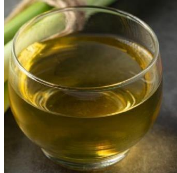
Té de zacate de limón