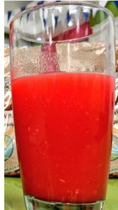
Chicha de maíz.