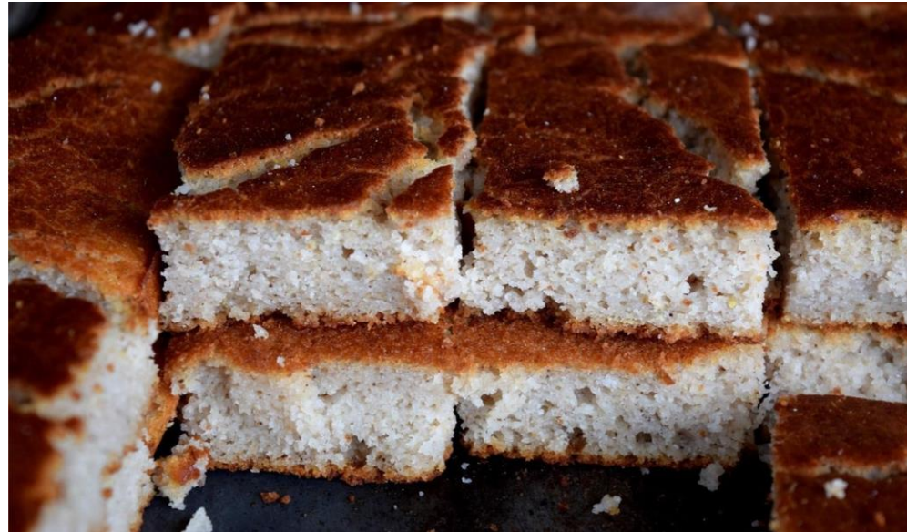
Cosa de horno. Fuente: INTUR