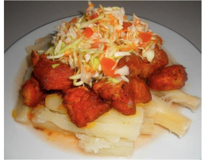
Chanco con yuca.