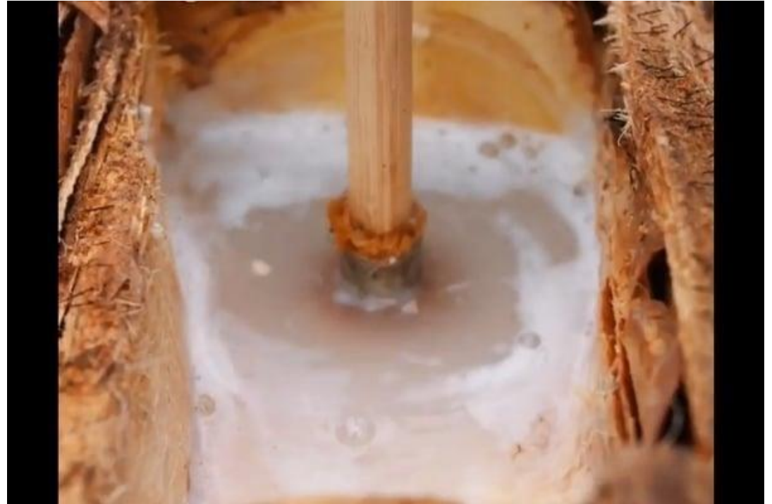
Chicha de Coyol. Bebida alcohólica fermentada hecha de la savia de las palmeras de coyol.