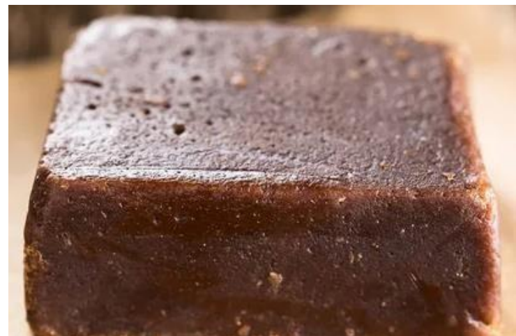
Atado de dulce negro