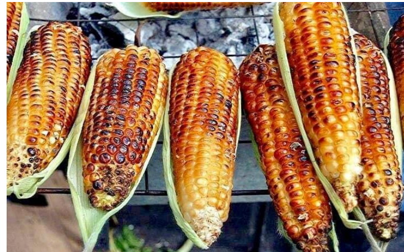
Elotes asados.