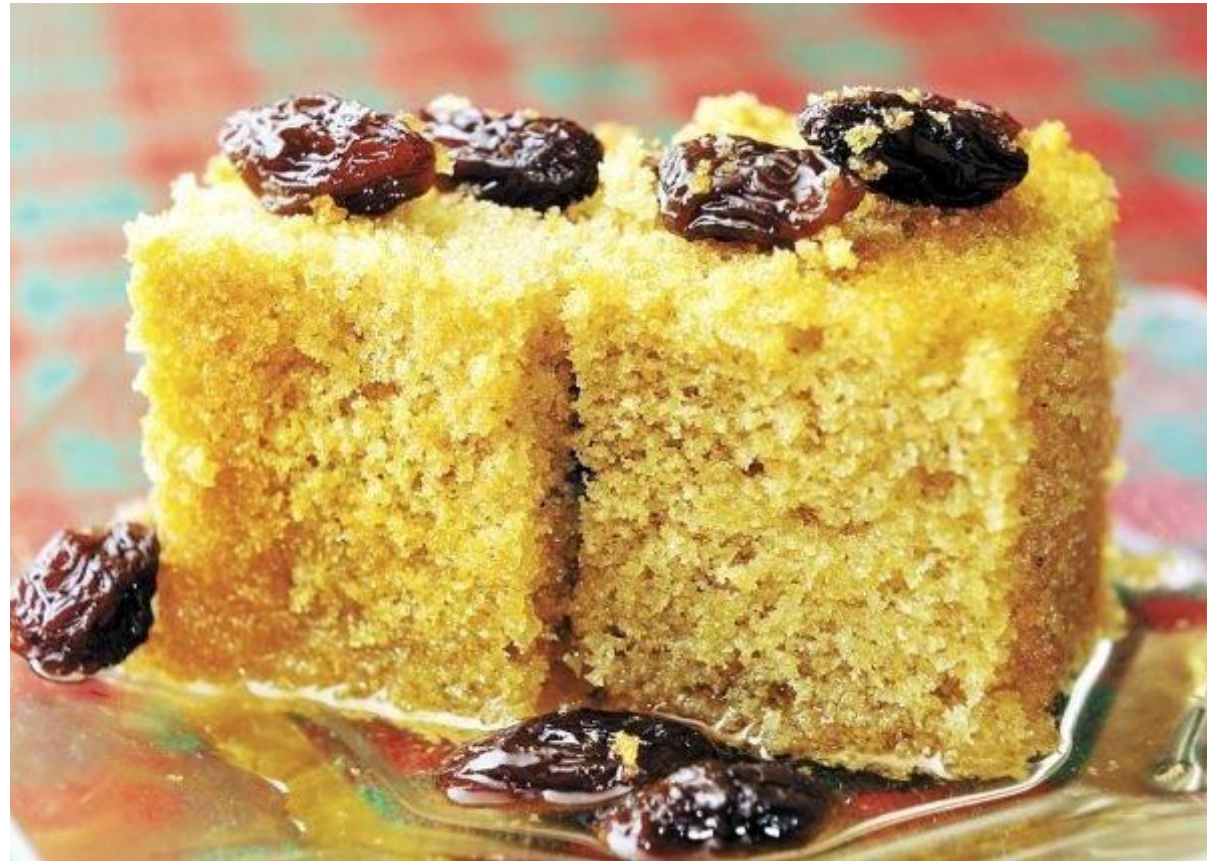
Sopa Borracha.