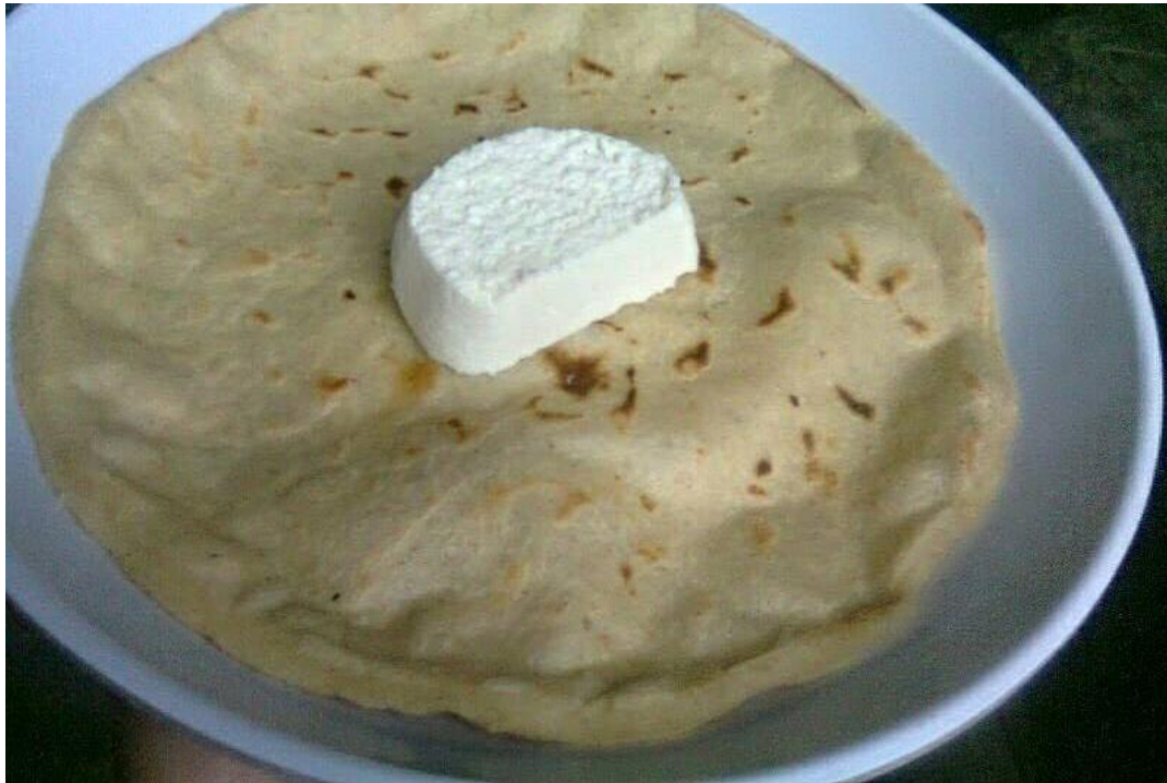
Tortilla de maíz con cuajada fresca.