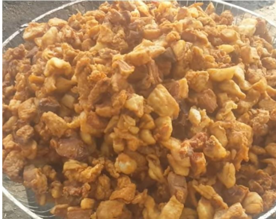
Pepenas (sobrantes de la fritura del chicharrón).