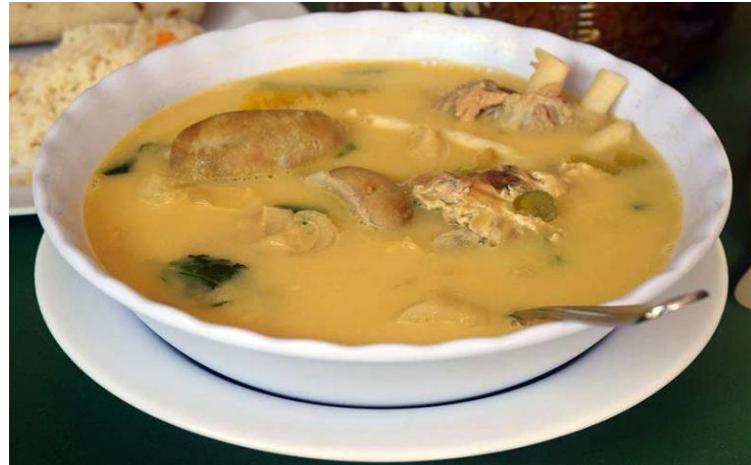
Sopa de Huevos de Toro.