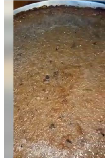
Torta de quequisque