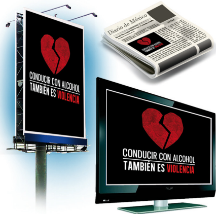
Difusión en medios.

Con la finalidad de legitimar este tipo de estrategias, es necesario que éstas se acompañen de campañas de comunicación, donde se sensibilice a la población.