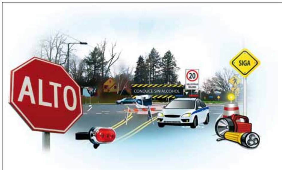
Equipamiento de la zona.