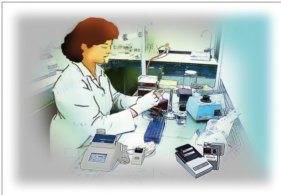
Verificación de equipos.

De acuerdo con el Proyecto de Norma Mexicana PROY-NMX-CH-153-IMNC-2005 la verificación de la operación de los equipos de alcoholimetría comprende en particular: