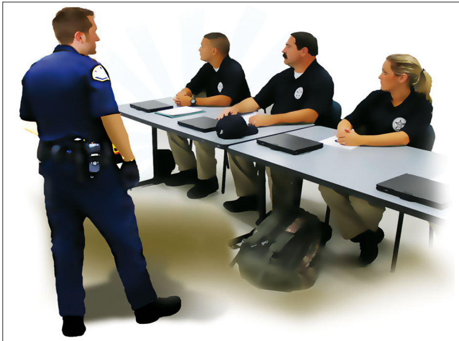
Cursos de capacitación.