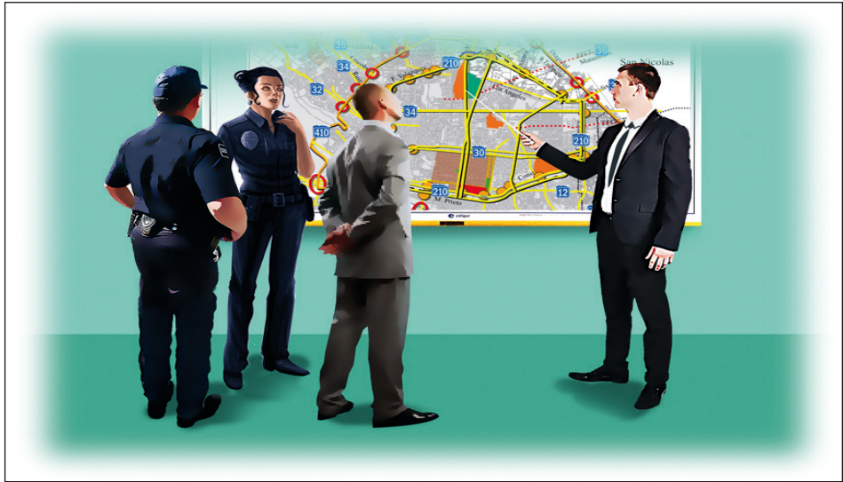
Selección de puntos de control.

La ubicación de los puntos de control de alcoholimetría debe determinarse considerando la información y datos generados por el Observatorio Estatal o Municipal de Lesiones, en caso de contar con éste. En caso de no contar con un observatorio, se utilizará la información disponible para la selección de ubicación (información de policías, salud, Cruz Roja, entre otras).