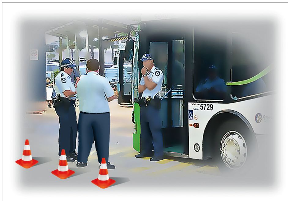
Prueba de alcohol al personal del transporte público.

Los grupos operativos que apliquen pruebas de alcohol en aliento a los conductores del transporte público lo realizarán en los días y horarios establecidos previo análisis estadístico o cuando la autoridad competente así lo considere conveniente y se actuará de acuerdo al procedimiento establecido según a la normatividad local vigente.