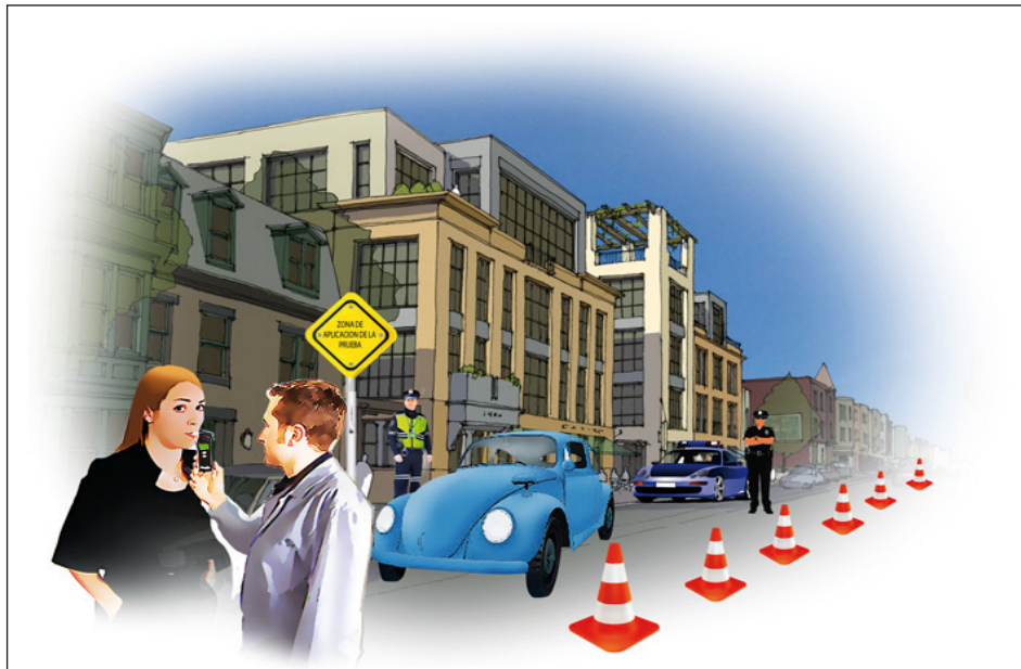
Zona de aplicación de la prueba.

Se deberán instalar dos zonas dentro del punto de control: