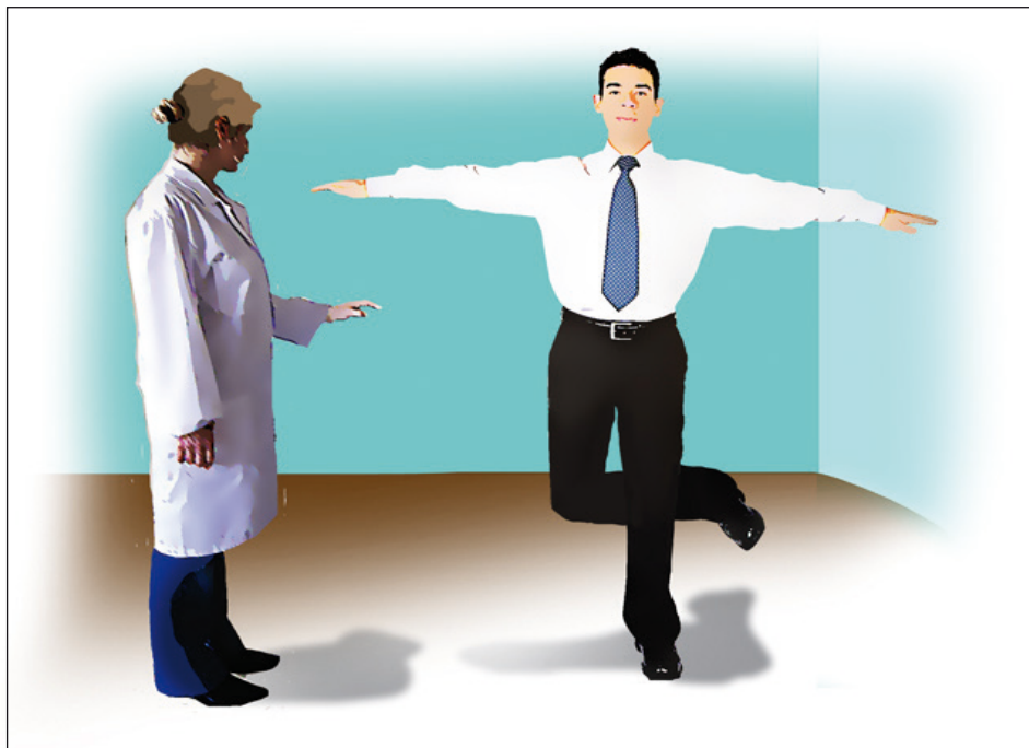
Valoración del estado de conciencia.

De ser necesario, por cuestiones de normatividad, se deberá evaluar por método clínico, tomando en consideración los parámetros descritos en el Programa Nacional de Alcoholimetría: valoración del estado de conciencia y curso del pensamiento; determinación de la orientación en tiempo, espacio y lugar; reflejos oculares: midriasis o miosis; hiperemia conjuntival (ojos rojos); alteración del habla: dislalia, disartria; cooperación (disposición); reflejos músculo-tendinoso: disminución o aumento; estado neurológico: Signo de Romberg (positivo o negativo), maniobra dedo nariz, alteración del equilibrio, alteración en la deambulación o marcha: atáxica o vacilante, o zigzagueante; otros signos: deshidratación, náusea, aliento alcohólico, anamnesis.