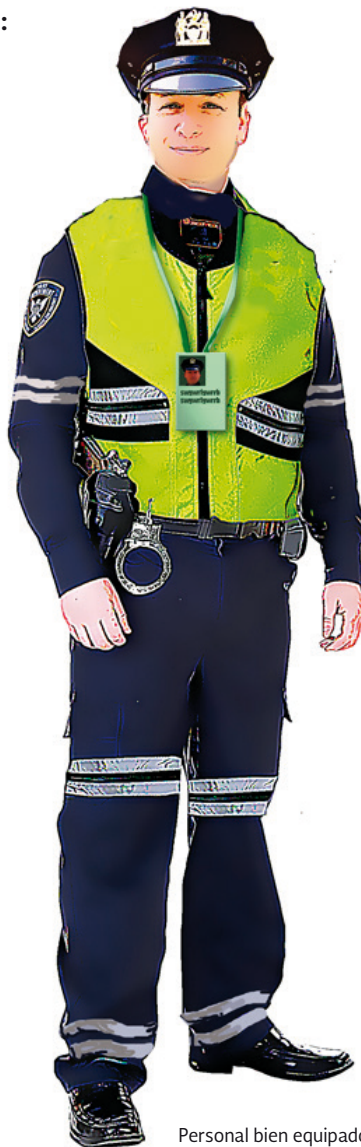
Personal bien equipado.