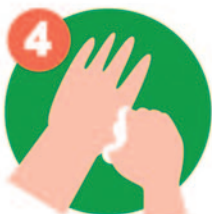
4 Frotar los pulgares