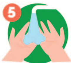
5 Enjuaga tus manos