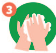
3 Concéntrate en el dorso de tus manos