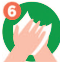
6 Seca con papel

El 90% de contagios se produce a través de las manos