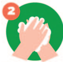
2 Frotar ambas palma