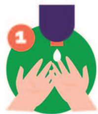
1 Aplique jabón en las manos mojadas.

Se transmite mediante las microgotas que se liberan tras toser, estornudar e incluso al hablar.