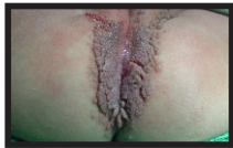
Figura 1– Condilomatose vulvo-anal em criança de 1 ano, sem história de violência sexual, provável contaminação por fômite

Atividade sexual é o fator primário de risco para o HPV, sendo que mulheres abaixo de 25 anos tem alta taxa de incidência 3 . Fatores ligados à sexualidade tem importância na epidemiologia, como idade de início, preferência e prática sexual, bem como o número de parceiros 4 . O HPV também pode se disseminar por autoinoculação para outras áreas. A transmissão oral é discutível. A Papilomatose Respiratória recorrente em infantes de mães que se contaminaram no parto pelo HPV 6 e 11, e através de fômites (figura 1), tem considerações hipotéticas não conclusivamente documentadas 5 .