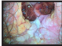
Figura 3- Condiloma em região de fúrcula

Na vulva, as regiões mais afetadas são a fúrcula, grandes e pequenos lábios, região perineal e perianal locais estes, por ordem decrescente, mais traumatizados no coito, facilitando a inoculação do vírus (figura 3). Pode também aparecer na mucosa vaginal e em menor proporção, no colo do útero, situação que ocorre nas imunossuprimidas. O ânus é a região extragenital mais acometida, principalmente em homens que fazem sexo com homens, sendo relacionado ao coito anal receptivo (figura 4). É mais comum em imunossuprimidos 7 .