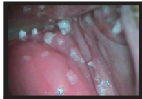
Figura 5 – Condilomas acuminados em paredes vaginais

Vulvoscopia- observação macroscópica da vulva e região perianal, seguida de observação colposcópica com aplicação repetida de ácido acético a 5%. As alterações sugestivas de infecção pelo HPV são muito variáveis, desde lesões papilares acetobranças, à lesões micropapilares, microespiculadas e condilomas acuminados 10 . Através deste método, os condilomas se apresentam na forma de papilomatose, com lesões sobrelevadas micropapilares com acetorreação intensa. Em geral não contém pigmentação, e quando presente é sugestivo de neoplasia intraepitelial usual (NIV). Na condilomatose cérvico-vaginal, após embrocção com ácido acético a 3% sob visão colposcópica, identifica-se mais frequentemente em vagina (figura 5), áreas de epitélio branco micropapilar, com aspecto de lixa. Ao teste de Schiller, existe impregnação parcial do iodo 11 (figura 6).