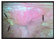
Figura 4 – Condilomas perianais, em 3 e 9hs.

O tamanho pode variar de menos de 1 milímetro à áreas extensas acometendo toda a região externa da vulva.