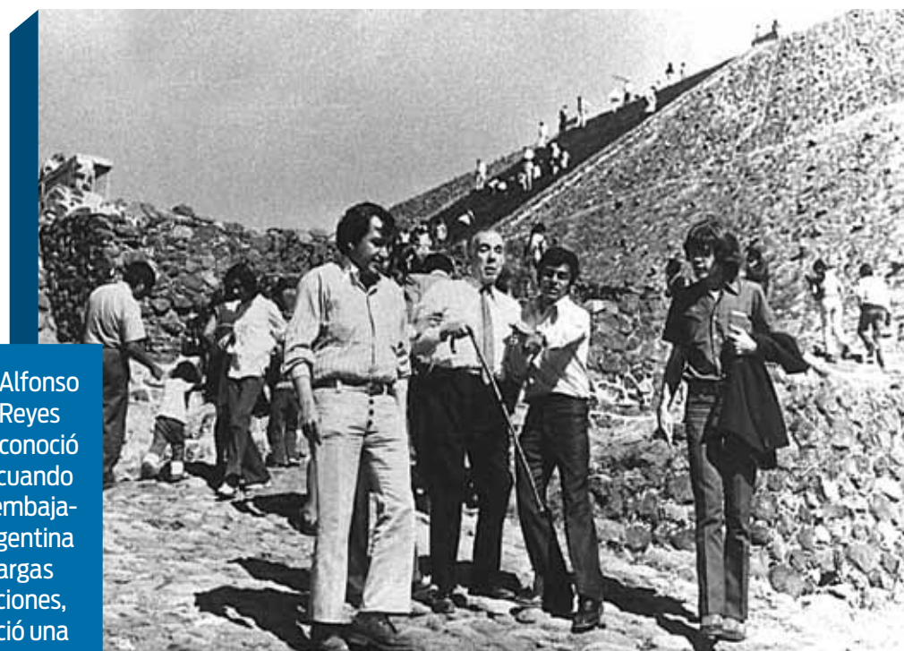
Arriba, Borges en su primera visita a México, en Teotihuacán; luego conocería Chichén Itzá. Sobre estas líneas, con su viuda, María Kodama.