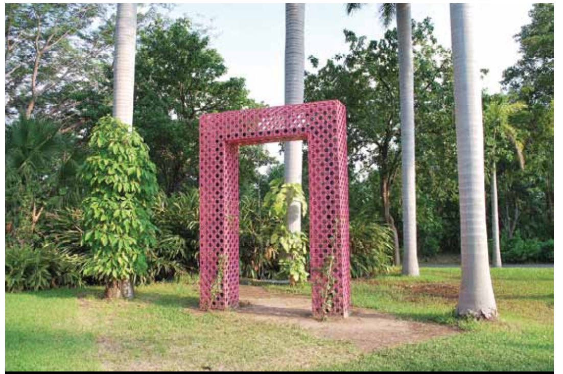
Dentro de las actividades de artes plásticas del Festival Internacional Cervantino habrá presencia del Jardín Botánico de Culiacán, aunque aún se desconoce si a través de alguna pieza o sólo con documentación.

El cartel del Cervantino se complementa con una serie de exposiciones de artistas mexicanos y extranjeros