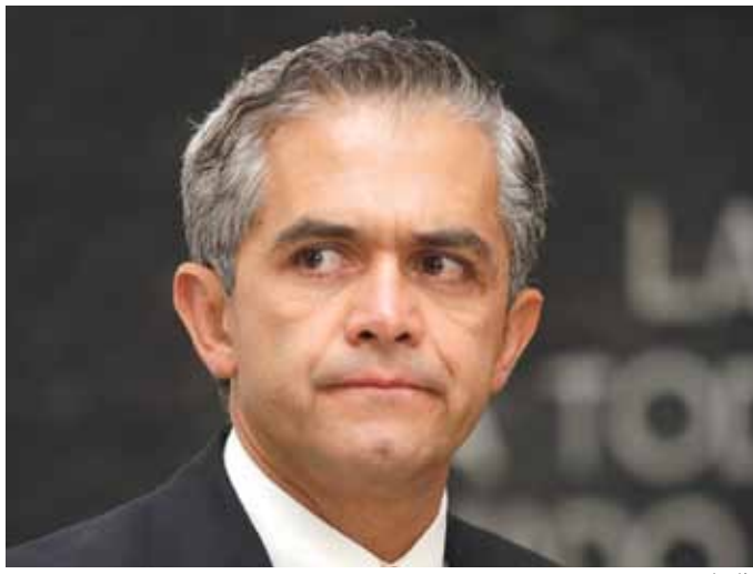
Miguel Ángel Mancera, titular de la PGJDF, durante el acto.