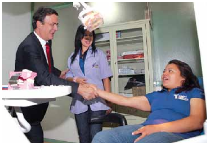
Marcelo Ebrard, jefe de Gobierno capitalino.