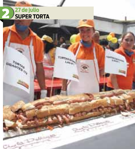
2 27 de julio SUPER TORTA La torta se cubrió de gloria al elaborarse la más larga del mundo al inicio de la Octava Feria de la Torta, en la explanada de la delegación Venustiano Carranza. La torta tuvo una longitud de 50 metros y fue elaborada en tres minutos y 57 segundos, pesó 650 kilogramos y estuvo compuesta por 70 ingredientes.