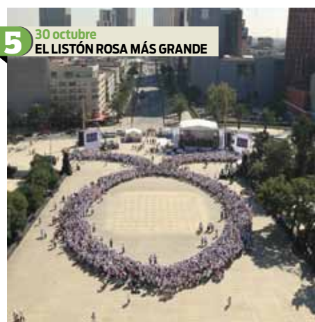
5 30 octubre EL LISTÓN ROSA MÁS GRANDE El mayor listón rosa del mundo fue creado por cuatro mil 125 mujeres en la Plaza de la República, con lo que se rompió el récord que ostentaba Arabia Saudita. El listón es el símbolo en contra del cáncer de mama. El evento se desarrolló bajo el lema “Hacer del cáncer de mama una enfermedad del pasado”.