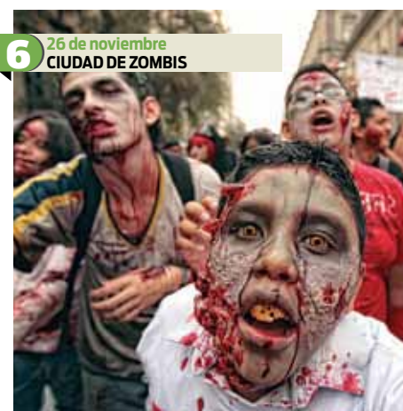
6 26 de noviembre CIUDAD DE ZOMBIS La Ciudad de México fue tomada por nueve mil 806 zombies, rompiendo el récord mundial Guinness de la mayor cantidad de gente caminando disfrazada de muertos vivientes en el planeta. Además, del récord se recaudaron varias toneladas de alimentos. La caminata fue del Monumento a la Revolución al Zócalo.