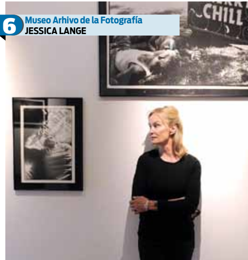
6 Museo Arhivo de la Fotografía JESSICA LANGE

Al chelista Mischa Maisky no le importó dejar China, en medio de una gira mundial, y padecer un jet lag de 14 horas para ofrecer el concierto de clausura del XXIII Festival de Música de Morelia, en sustitución del músico Jordi Savall, quien canceló su presentación por la enfermedad y muerte de su esposa.