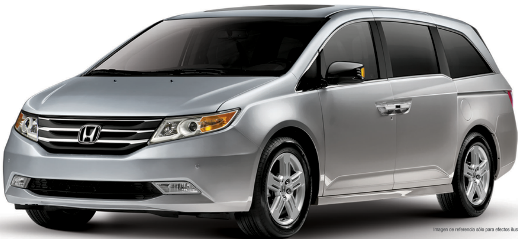
Imagen de referencia sólo para efectos ilustrativos.