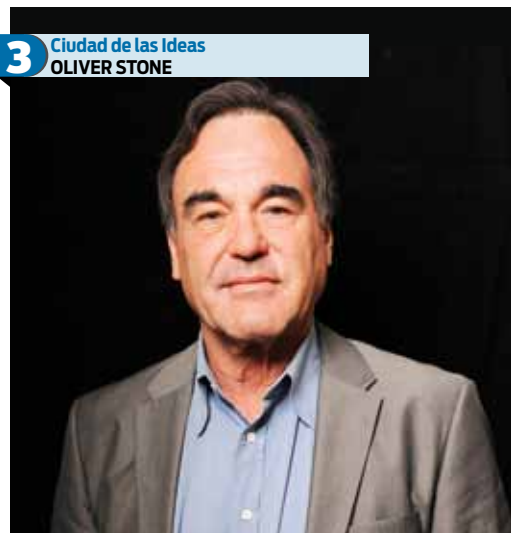
3 Ciudad de las Ideas OLIVER STONE

Entre elogios, los lectores recibieron a la Premio Nobel de Literatura 2009, Herta Müller durante un firma de autógrafos que realizó en el marco de las actividades de la Feria Internacional del Libro de Guadalajara. La escritora, quien visitó México en 1999, congregó a poco más de 300 personas.