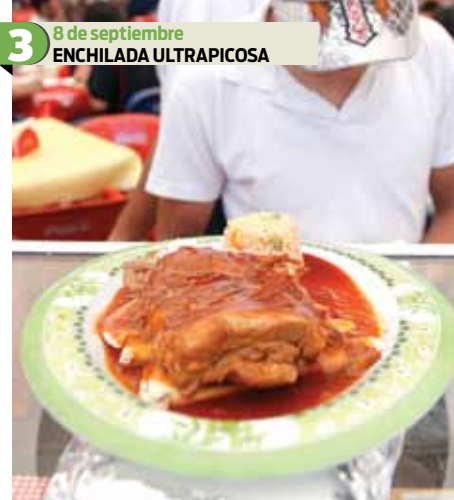
3 8 de septiembre ENCHILADA ULTRAPICOSA La que fue considerada la enchilada más picosa del planeta fue creada por el restorán 100 Por Ciento Maíz y fue degustada por un centenar de comensales que formaron el jurado de este certamen que abrió la Feria de la Enchilada en Iztapalapa. El platillo fue elaborado con chiles habaneros, jalapeños y serranos.