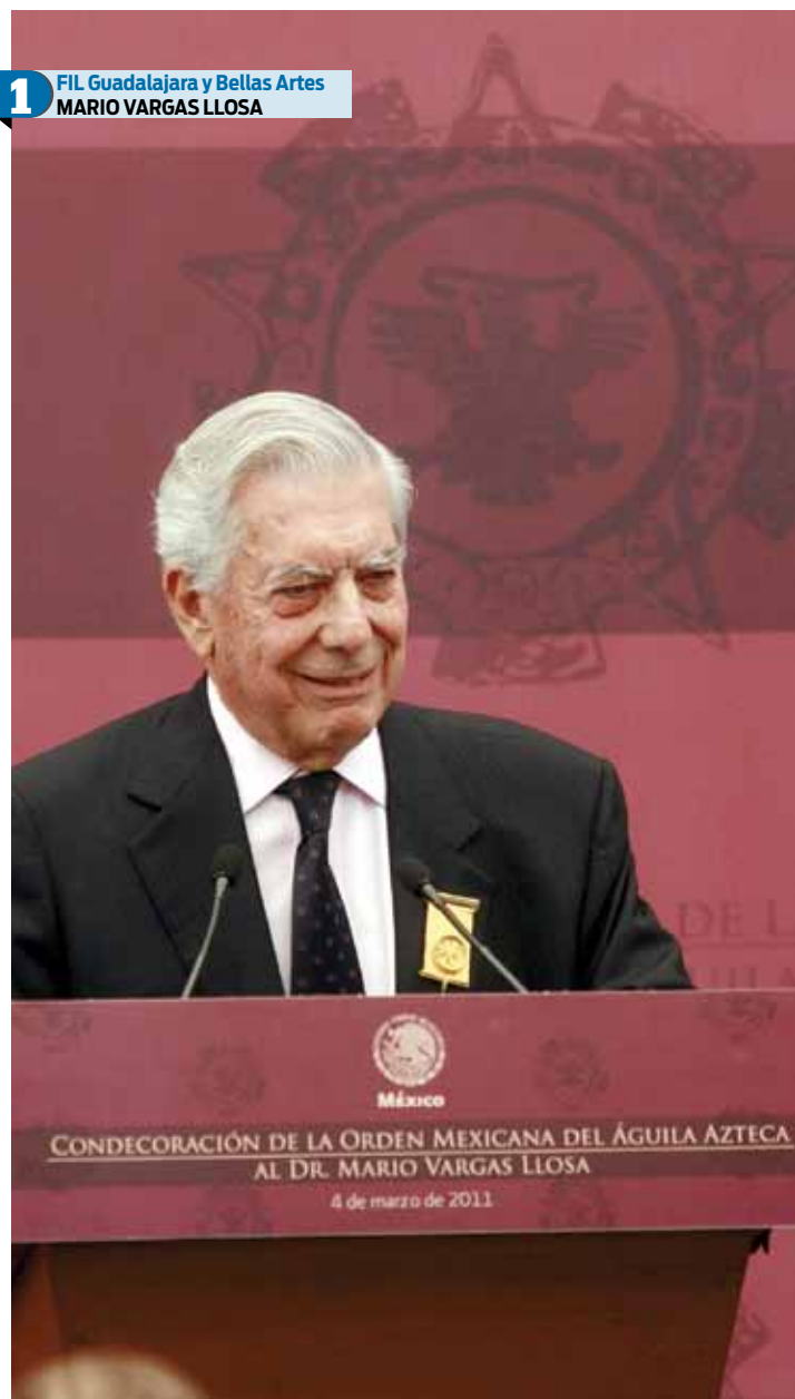
1 FIL Guadalajara y Bellas Artes MARIO VARGAS LLOSA

E l Premio Nobel de Literatura 2010, Mario Vargas Llosa, visitó en varias ocasiones el país. Primero en marzo, cuando ofreció un par de conferencias magistrales, recibió el Premio Internacional Alfonso Reyes y actuó en la obra de teatro Las mil noches y una noche en el Palacio de Bellas Artes. Luego el escritor peruano nacionalizado español regresó en noviembre a la Ciudad de México para recibir el reconocimiento Una vida por la libertad y asistir después a la Feria Internacional del Libro de Guadalajara.