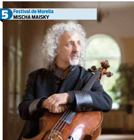
5 Festival de Morelia MISCHA MAISKY