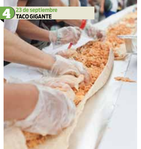
4 23 de septiembre TACO GIGANTE El taco más grande del mundo fue elaborado en la Plaza Garibaldi para abrir la Feria del Taco. El platillo tuvo una longitud de 50.17 metros. El taco pudo ser degustado por alrededor de 150 personas y tuvo como fin fortalecer el consumo de este producto por encima de la comida rápida de cadenas transnacionales.