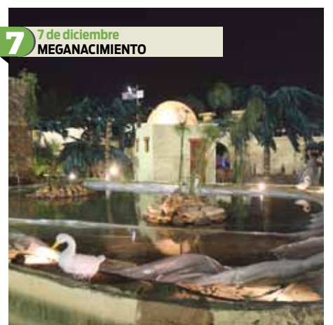
7 7 de diciembre MEGANACIMIENTO Se inauguró en el estacionamiento del Estadio Azteca el Nacimiento más grande del mundo que recrea el Belén de hace dos mil años y que transmite “la esencia” de la Navidad. El escenario mide más de 20 mil metros cuadrados, con mil figuras de tamaño real con movimiento y réplicas humanas.