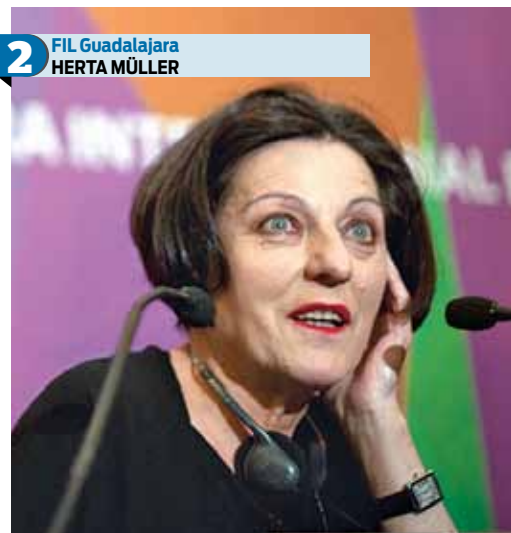
2 FIL Guadalajara HERTA MÜLLER

Entre elogios, los lectores recibieron a la Premio Nobel de Literatura 2009, Herta Müller durante un firma de autógrafos que realizó en el marco de las actividades de la Feria Internacional del Libro de Guadalajara. La escritora, quien visitó México en 1999, congregó a poco más de 300 personas.