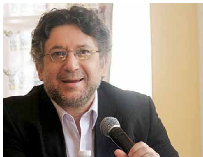
En la imagen, el dramaturgo mexicano Jaime Chabaud.

Esto, asegura, “nos da un índice de la proliferación de nue-