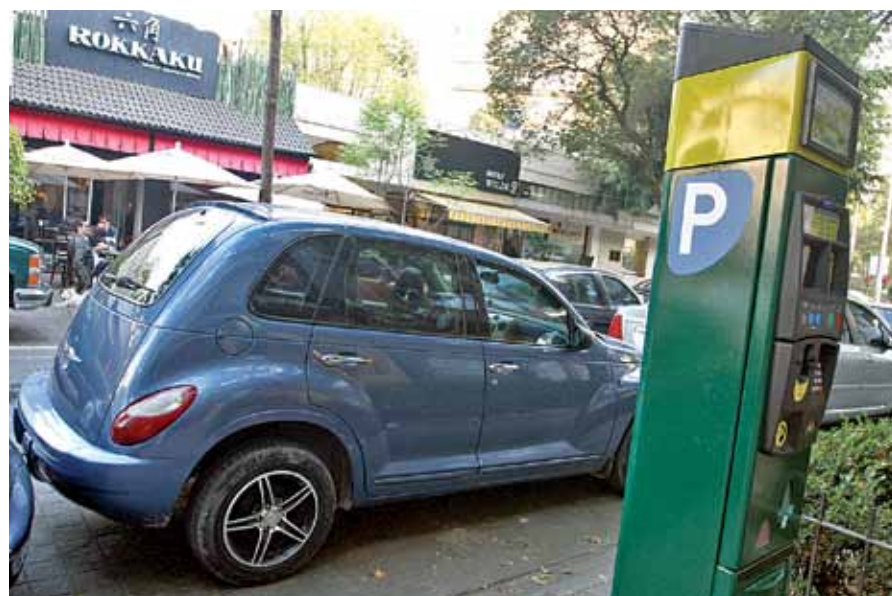
Únicamente dos empresas obtuvieron los contratos para operar los parquímetros en la ciudad. En las colonias Roma y Condesa acusan opacidad en este programa.

2 EMPRESAS operan los parquímetros en la Ciudad de México