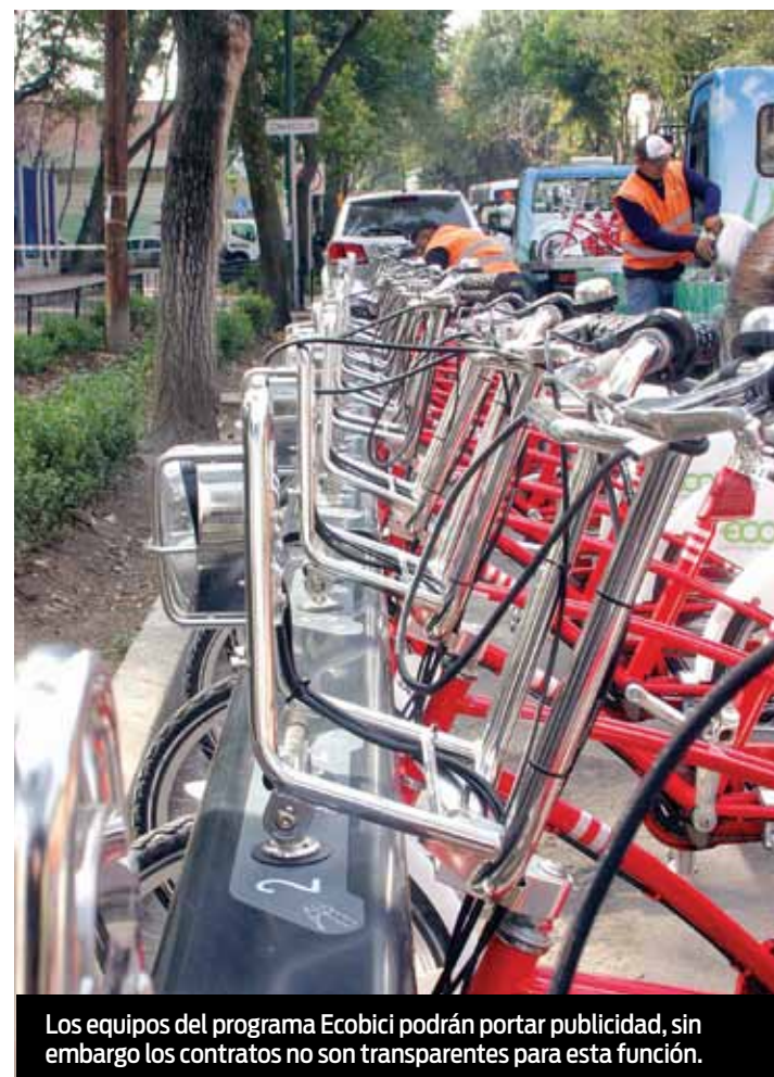
Los equipos del programa Ecobici podrán portar publicidad, sin embargo los contratos no son transparentes para esta función.