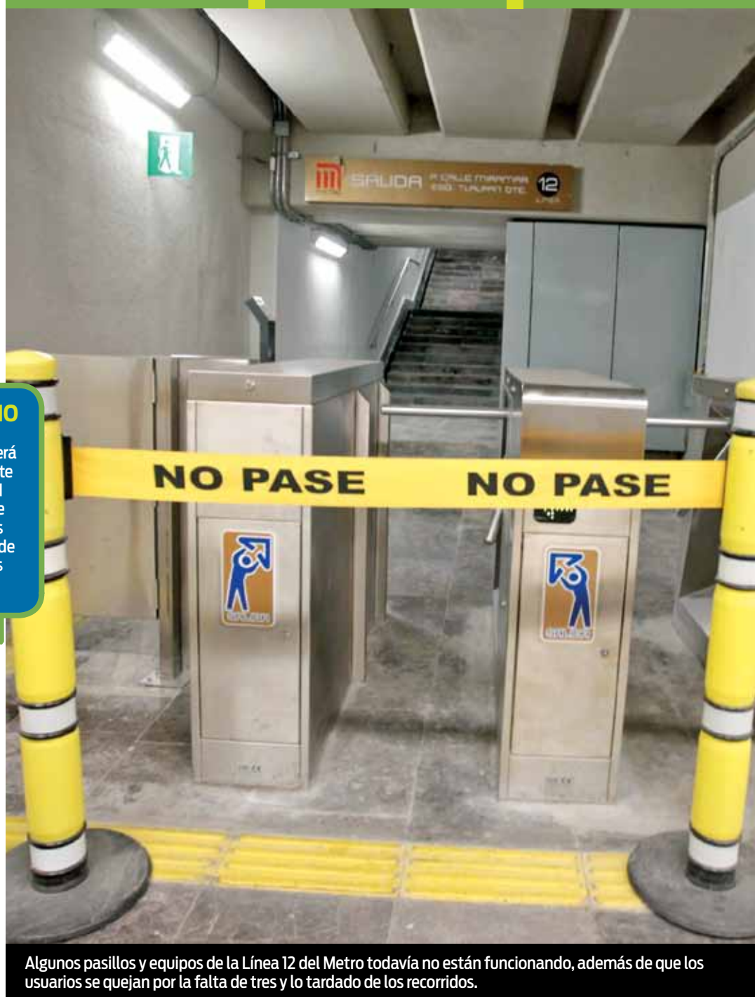
Algunos pasillos y equipos de la Línea 12 del Metro todavía no están funcionando, además de que los usuarios se quejan por la falta de tres y lo tardado de los recorridos.

4 POR CIENTO menos de presupuesto recibieron las delegaciones