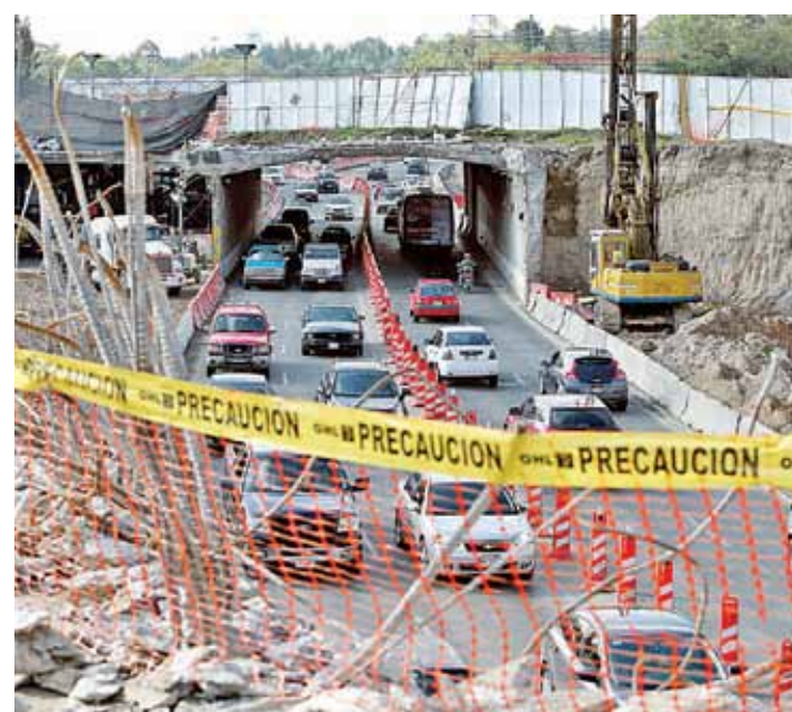
Las autopistas urbanas fueron abiertas en diversos tramos, por lo que los automovilistas tienen que convivir con la maquinaria.

Aunque la administración de Ebrard entregó el complejo de autopistas urbanas de la Ciudad de México, a lo largo de su trazo