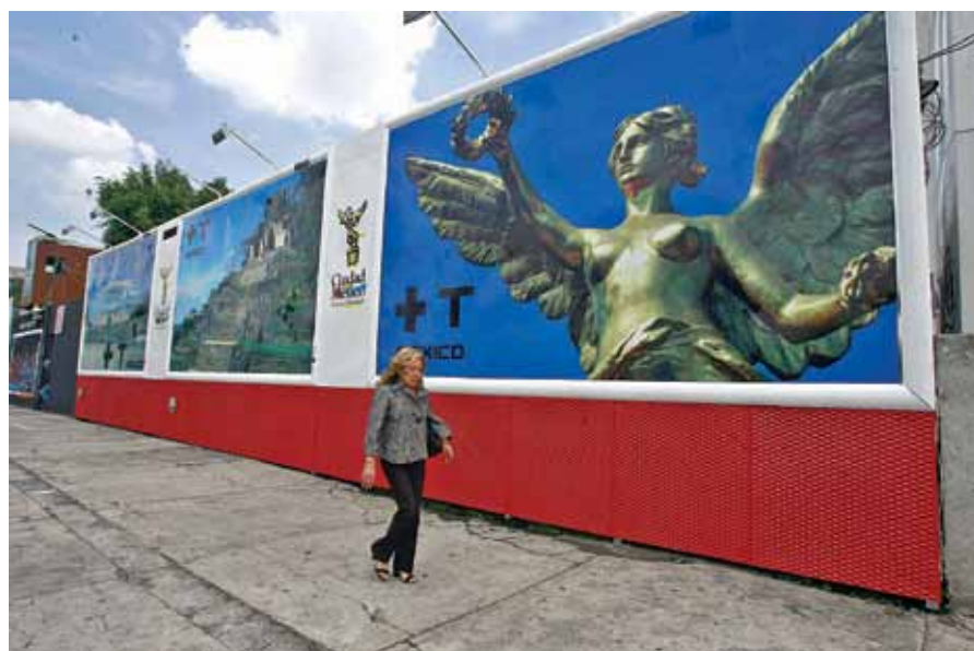
La publicidad exterior es uno de los grandes pendientes de la administración del GDF que concluyó ayer. No se concluyeron los nodos y no hay un censo de empresarios.

El resto se divide en recursos etiquetados como el Presupuesto Participativo y las denomina-