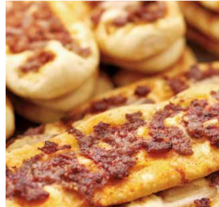
La 'pelaeta', típico de la comarca del Camp de Túria.

La comarca de la Ribera, acoge el bocadillo más conocido en toda la Comunitat Valenciana, denominado almussafes, (almussafes en valenciano), y llamado así por la localidad de Almussafes. Para su realiza-