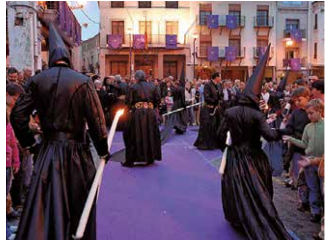
Semana Santa Saguntina.

Es mucho más que una exposición fotográfica, ya que incluye la esencia de la fiesta contada por los protagonistas. Además, no solo se verán fotografías, sino que a través de un código QR, en 14 de ellas se podrá visualizar un vídeo que contará no solo lo que sucede en la imagen, si no también las costumbres ligadas a la fiesta y cómo es y cómo se vive la Se-