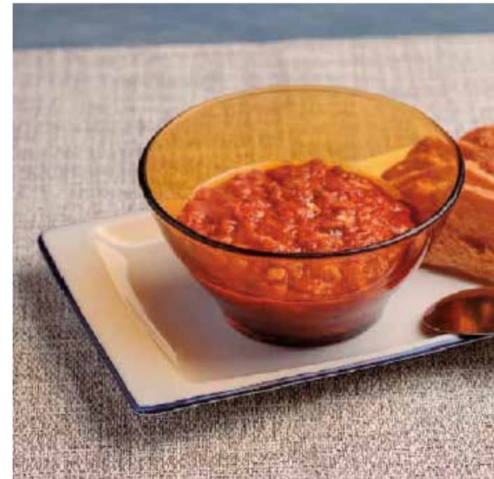
Titaina de tonyina, típica de los poblados marítimos de Val

ción se unta el pan con sobrasada, se añade cebolla pochada y queso para a continuación tostarlo hasta que la grasa de la sobrasada impregne el pan y el queso posteriormente se funda. Además existen diversas versiones de almussafes a las que se le añaden jamón o tocino. Así mismo, este bocadillo puede prepararse como tosta, un emparedado abierto o sándwich abierto.