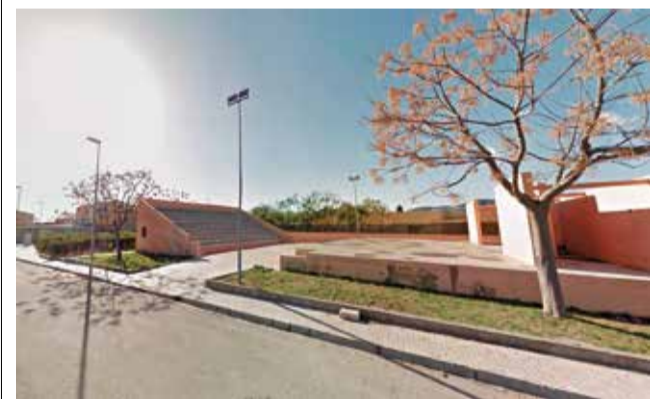
El aparcamiento estará ubicado junto al auditorio.