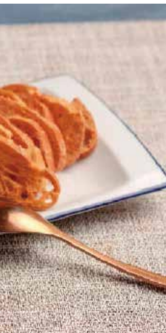
encia. / EPDA