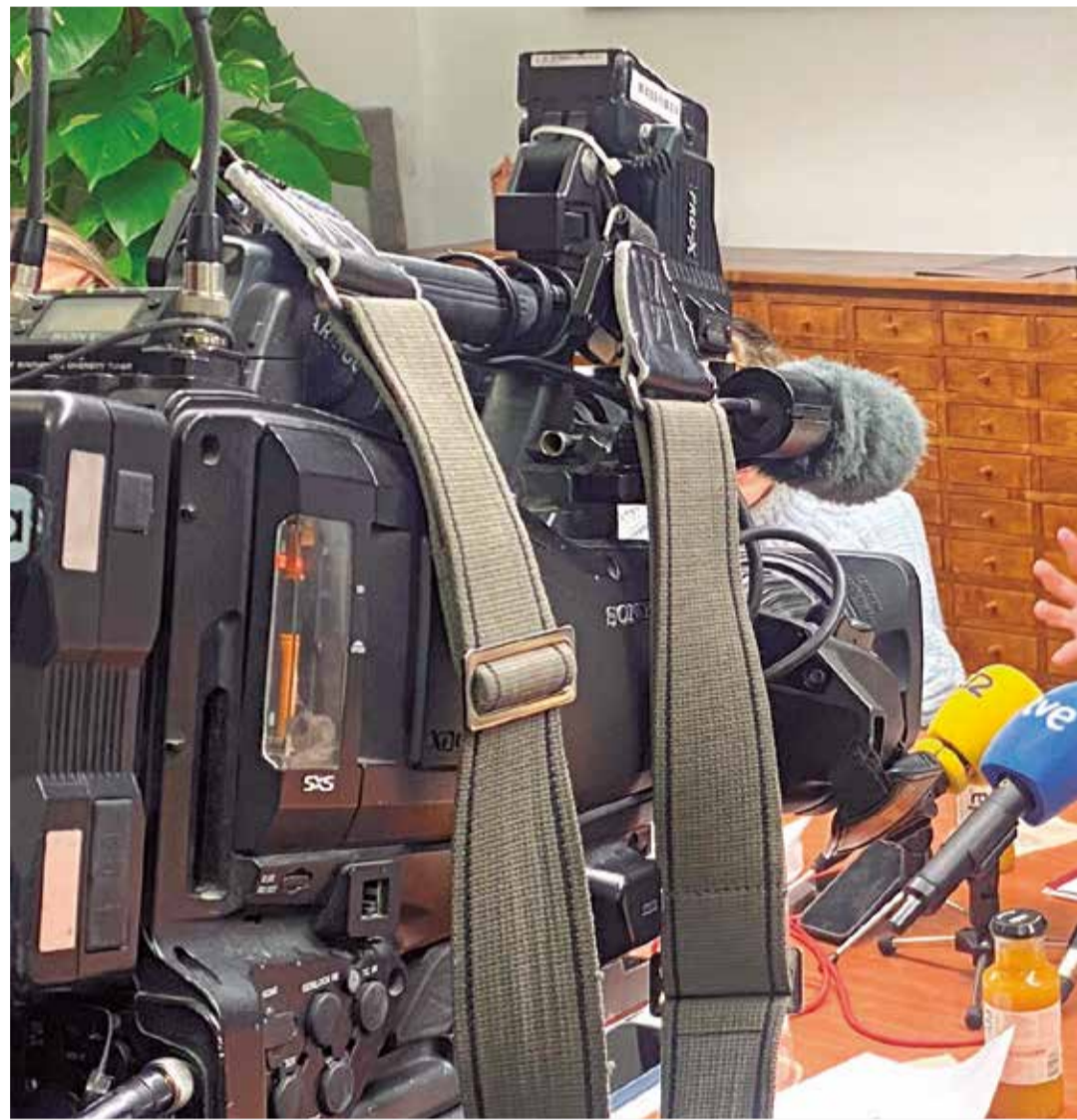
Darío Moreno, alcalde de Sagunt, en el desayuno informativo con los medios de comunicación.

El primer edil subraya la necesidad de inversiones en infraestructuras clave, como el pantalán marítimo y terrestre, además de mejoras en servicios públicos, salud y educación para afrontar el crecimiento poblacional previsto