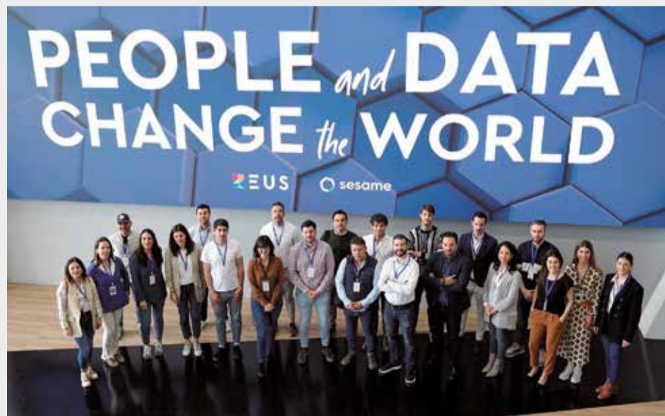
Representantes del programa.

'Operación Consolida' ofrece un completo programa de formación, dividido en 10 bloques, cubriendo áreas esenciales como innovación, ventas y finanzas. Las sesiones serán dirigidas por empresarios referentes, quienes compartirán sus conocimientos desde sus propias sedes corporativas.