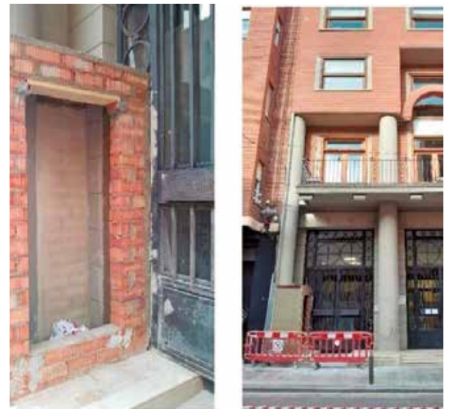
Caseta instalada en la antigua sede.

El grupo propone que la caseta destinada a mejorar la eficiencia energética del edificio municipal sea ubicada en otro lugar más adecuado, con el objetivo de no alterar la composición de la fachada monumental y preservar la riqueza arquitectónica del edificio. La crítica se basa en el deseo de mantener la coherencia estética del edificio, considerado un patrimonio histórico y cultural de la localidad.