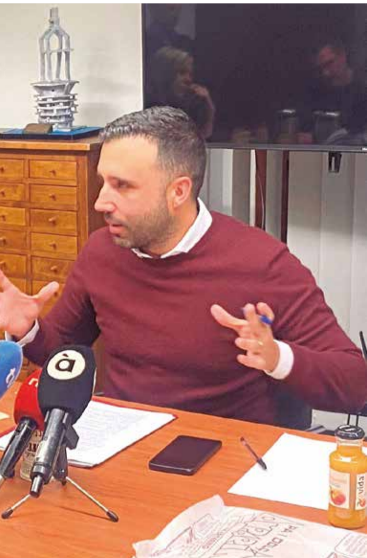
ión. / PERE VALENCIANO

con infraestructuras más allá de la gran intervención pendiente en el centro Eduardo Merello, que estaba aprobada pero que “la Generalitat la está intentando frenar”.