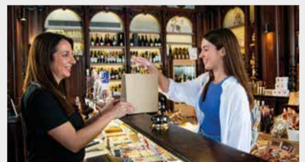
El trato amable y cuidado por los detalles.