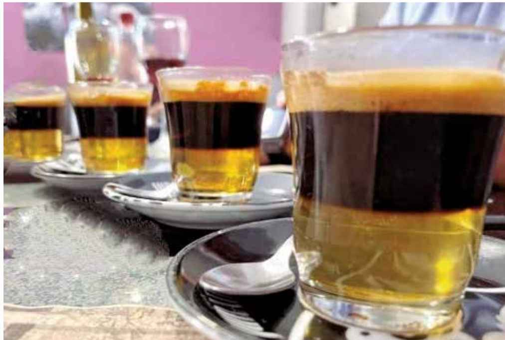
El 'cremaet', que acompaña a un buen 'esmorzar'.

valenciana, que se suele complementar, como en el buen almuerzo valenciano, de caos y olivas.