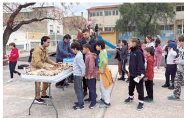
Alumnat del CEIP l'Ermita el Dia de l'Arbre. / EPDA

La regidoria de Medi Ambient de l'Ajuntament de Benifairó de les Valls, en col·laboració amb el CEIP l'Ermita, organitzà la setmana passada una nova edició del Dia de l'Arbre, especialment adreçada als escolars de municipi. L'activitat va consistir en una plantació de marfulls al Pla de l'Era. El marfull és un arbust autòcton amb flors molt utilitzades en jardineria i que pot arribar fins als tres metres d'alçada. “Cal assenyalar que aquestes plantes són les que varem utilitzar en la passada edició de la campanya de Nadal d'ajuda al xicotet comerç local. De fet, aquestes plantes es varen repartir amb fins decoratius per tots els nego-