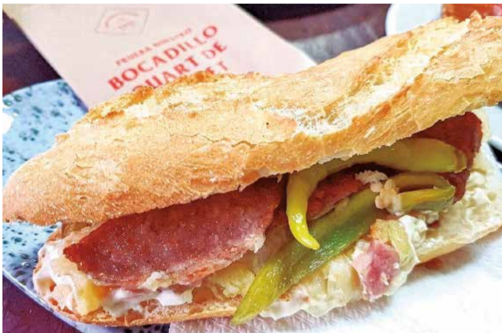
Bocadillo 'Quart de Poblet', típico del pueblo que le da nombre.

tidos de aceitunas y piparras, y para terminar un buen cremaet de ron.