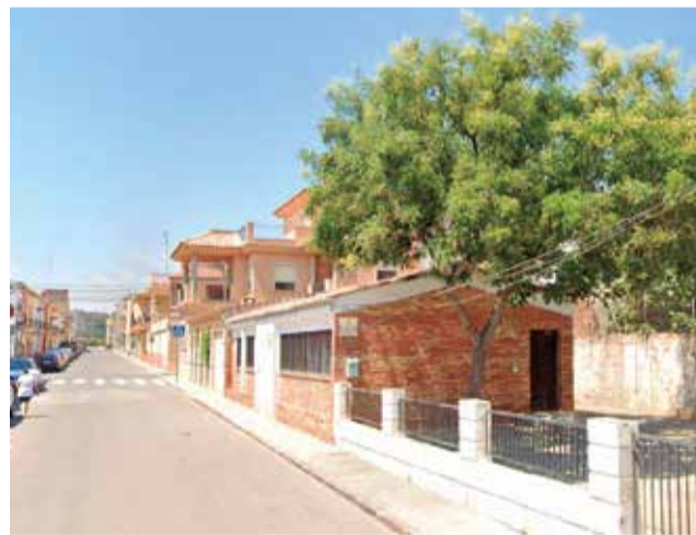
Llar del Jubilat de Benavites.

Una de las acciones que llevará a cabo el ejecutivo municipal de manera inminente será la adecuación de la 'Llar del Jubilat'. Así lo anunció el