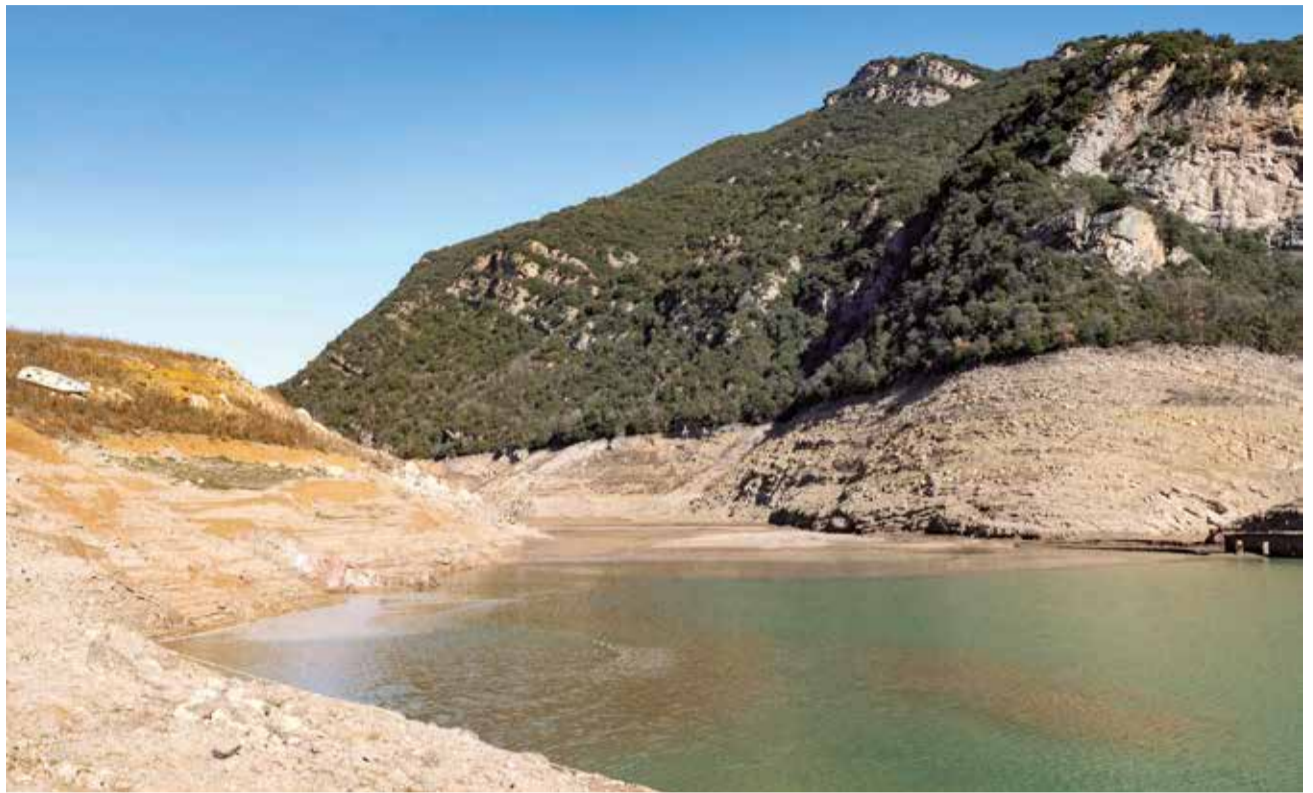
Vista del pantano de la Baells (Barcelona).

La desalinizadora de Morvedre trabaja únicamente para una industria saguntina dedicada al oxígeno activo en la actualidad