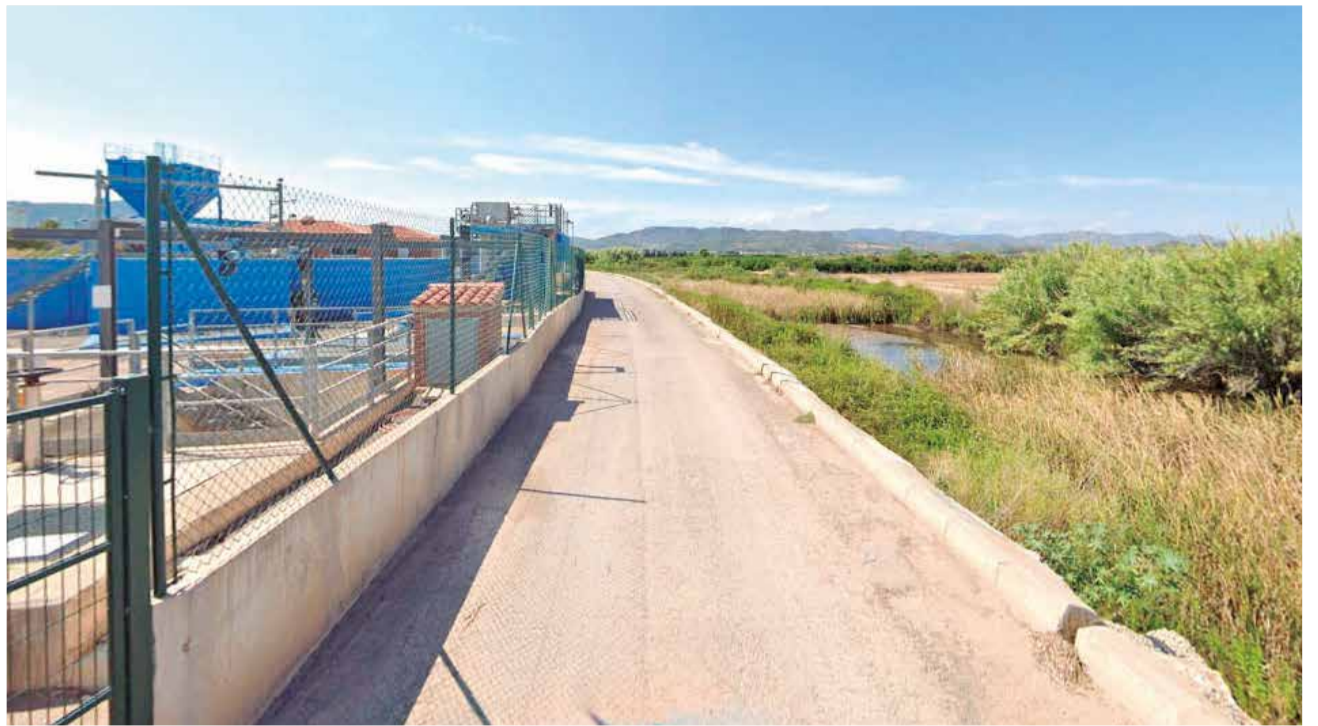
Zona donde se proyectarán las naves empresariales en el polígono de Benavites.

millón de metros cuadrados de suelo pretende construir dos grandes naves logísticas, una de 100.000 metros cuadrados y otra de 200.000, según avanzó el alcalde de la localidad de Les Valls, Carlos Gil, en una comida organizada con los periodistas de la comarca el mismo día del pleno. El primer edil aseguró que todavía se desconoce la empresa que se instalará en el municipio, su actividad comercial y el número de trabajadores que tendrá. Eso sí, aseguró que no se ha visto atraída por la instala-