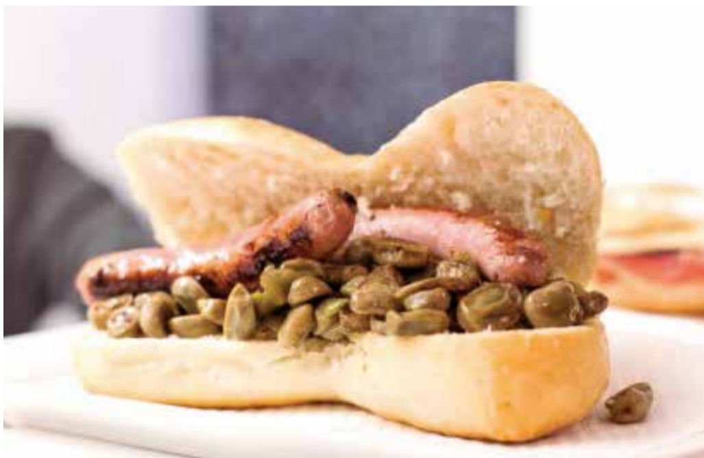
La 'pataqueta', un bocadillo típico del Camp de Morvedre que se come los jueves.