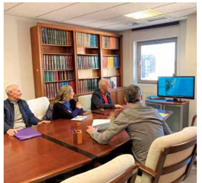
Un instante de la reunión.

Ante posibles episodios meteorológicos que pongan en peligro la integridad de las playas antes de su regeneración, los responsables de la Demarcación de Costas han asegurado que se pondrá en marcha un plan de urgencia para proteger las playas norte de Sagunt y Canet d'en Berenguer.