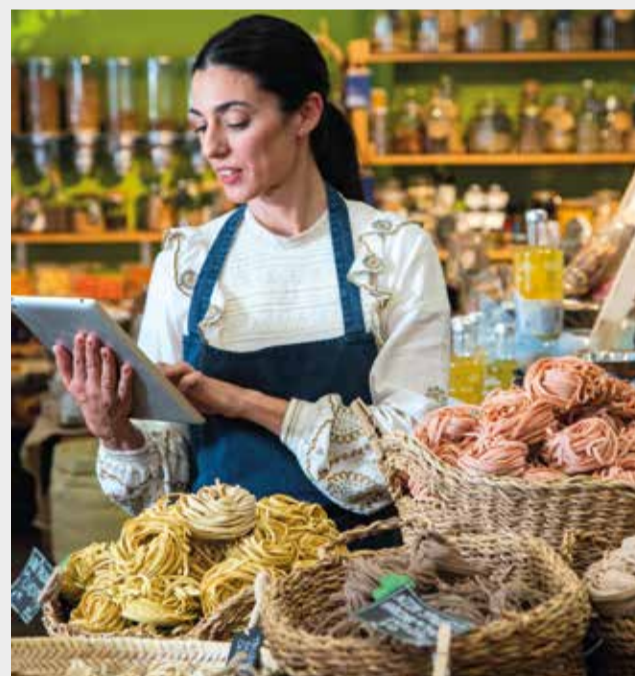
Los comercios ofrecen los mejores productos.

El turismo gastronómico se ha convertido en una razón importante para elegir la Comunitat Valenciana. A la gran oferta cultural, patrimonial, a sus playas y sus paisajes de interior, se suma también poder disfrutar de la dieta mediterránea, una de las gastronomías más saludables del