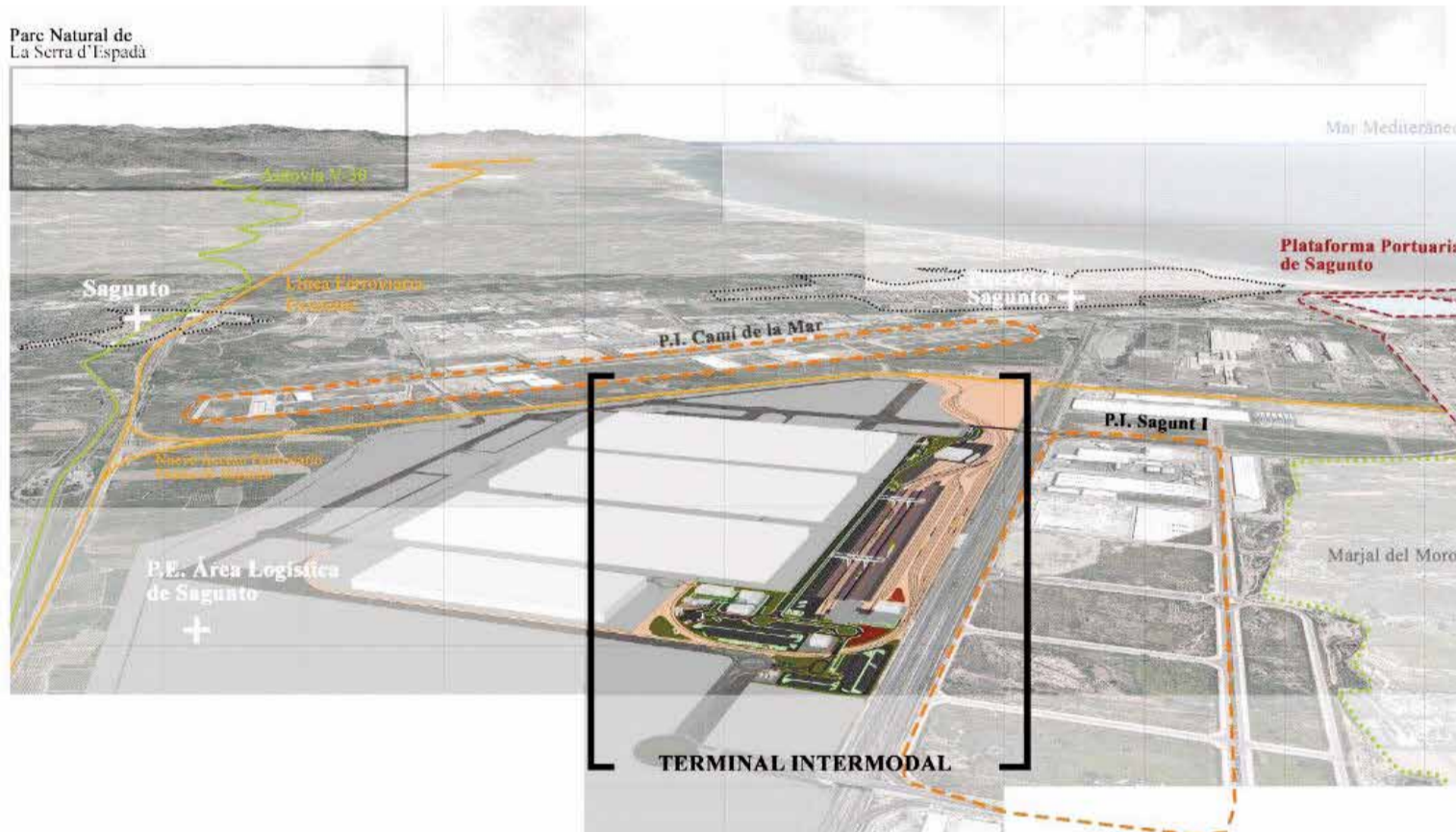
Representación del proyecto de la plataforma intermodal de Sagunt.

Por último, la segunda parte del proyecto de construcción se centra en la urbanización interior e incluye los accesos asociados a la terminal, como por ejemplo, redes de servicios e instalaciones generales asociadas y zonas verdes.