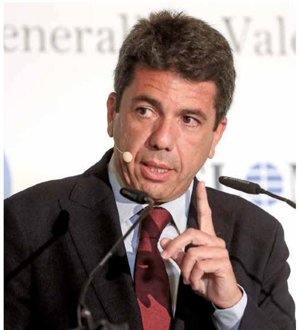
Carlos Mazón, president de la Generalitat Valenciana.

"El agua desalada no nos gusta para regar" y es "muy cara energéticamente, no es sostenible, pero para una punta de energía, para una punta de emergencia, para uso de boca sí que puede ser viable", agregaba.