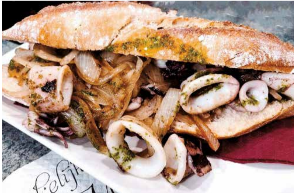
Un bocadillo de calamares, cebolla y picadillo.

Un almuerzo popular valenciano ha de ir, casi obligatoriamente, acompañado de pan. Y aunque no lo haga en forma de bocadillo, en el Camp de Túria y, especialmente, en Riba-roja de Túria, la 'pelaeta' ocupa el podio en cuanto a almuerzo típico se refiere. Se trata de una coca de pan, ya que la masa lleva agua, harina de trigo, levadura y sal, que es conocida también en otros municipios como 'coca en oli', 'coca saladà' o 'coca de cansalà', entre otros. Una masa crujiente y esponjosa que se acompaña de ingredientes como la longaniza, el chorizo, la morcilla, el tocino y/o la sobrasada en su superficie. Sin duda, un manjar característico de la comarca