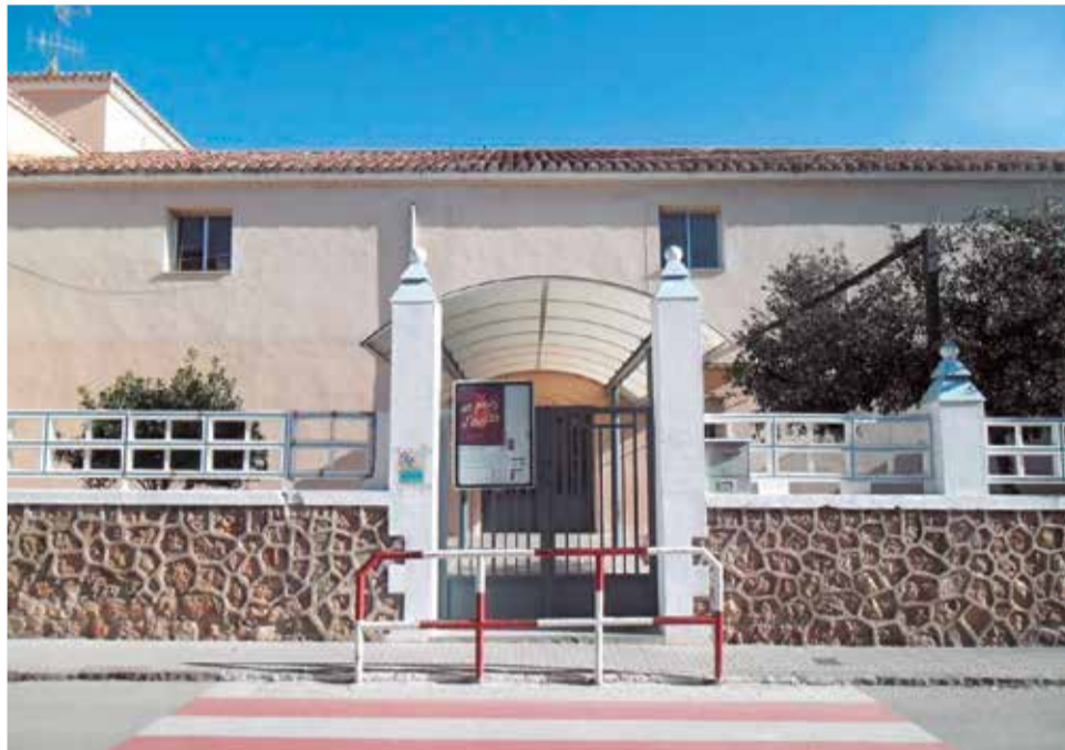
CEIP Santa Anna de Quartell.

La comunidad educativa de la localidad de Les Valls ha estado solicitando una escuela nueva y en condiciones durante dos décadas, pero, en palabras de Vilar, “los últimos gobiernos tanto de la Generalitat como de Quartell –formados por PSPV y Compromís– no han tomado medidas efectivas”. En una crítica