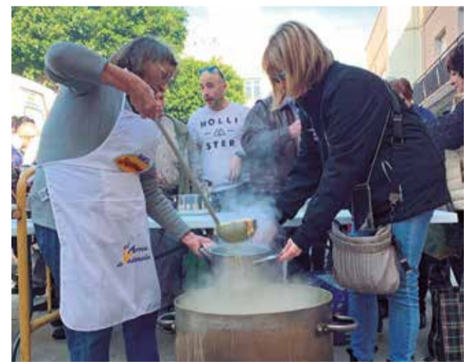
Calderes de Sant Blai a Estivella.

Els actes religiosos van ser un punt àlgid amb la participació d'una desena de capellans provinents de diferents poblacions, que van unir-se per honorar al patró local. Durant la cerimònia, la comissió de festes va beneir les tradicionals “coquetes”, que posteriorment van ser repartides entre els assistents,