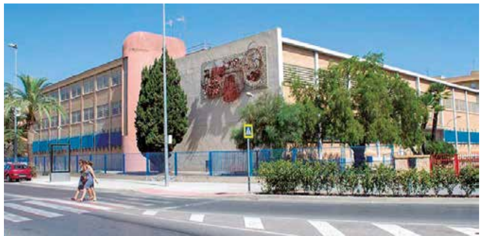
Centro Eduardo Merello, en el Port de Sagunt.