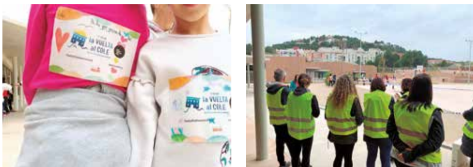
Participants en l'acto solidari de Gilet.