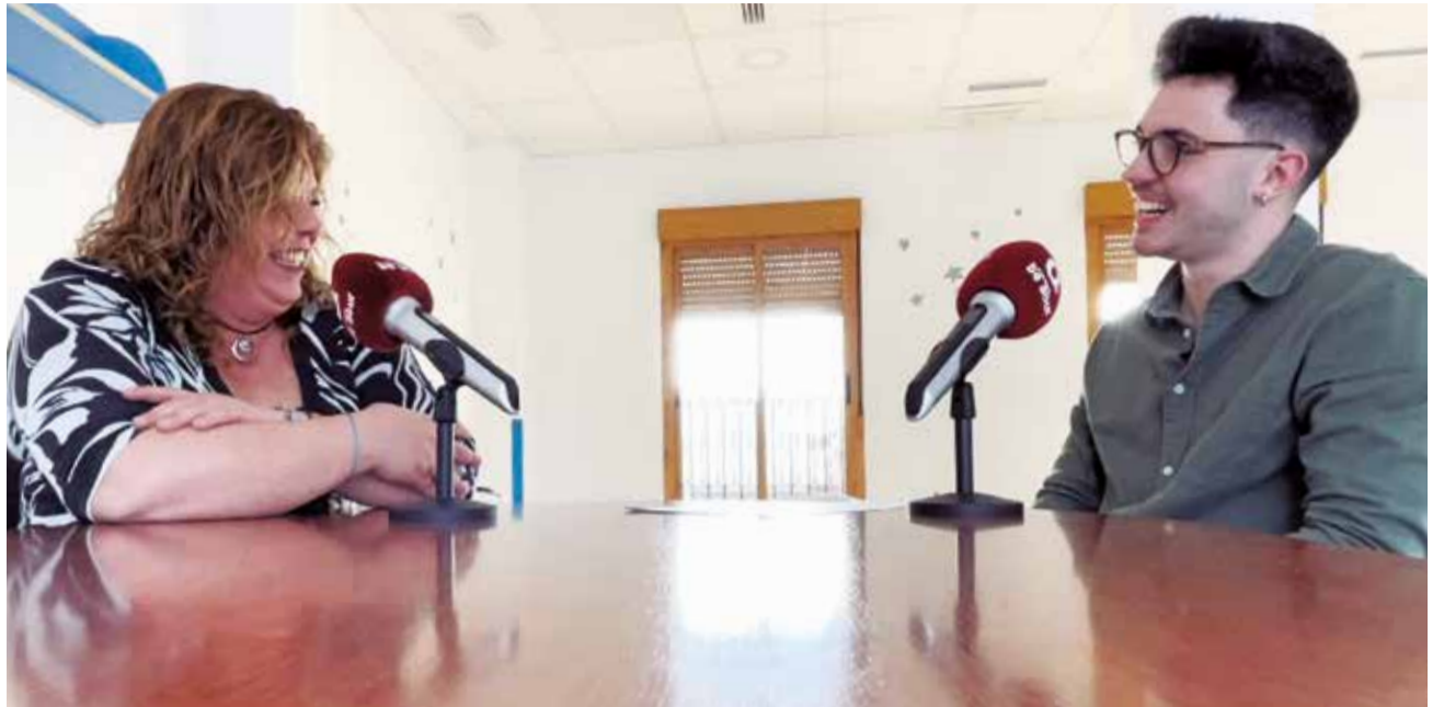
Uno de los momentos de la entrevista.

entrada de Albalat. Este plan estuvo un gestionado por el anterior equipo de gobierno.