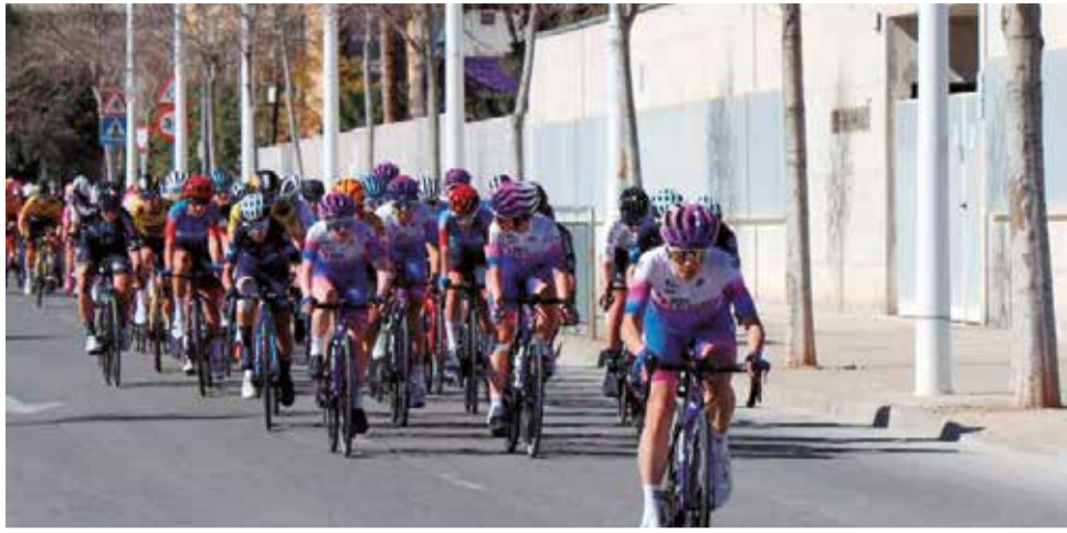
Vuelta Ciclista Fémicas a su paso por Sagunt en una edición de otro año.