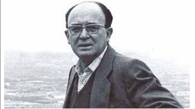
Vicent Andrés Estellés. / EPDA