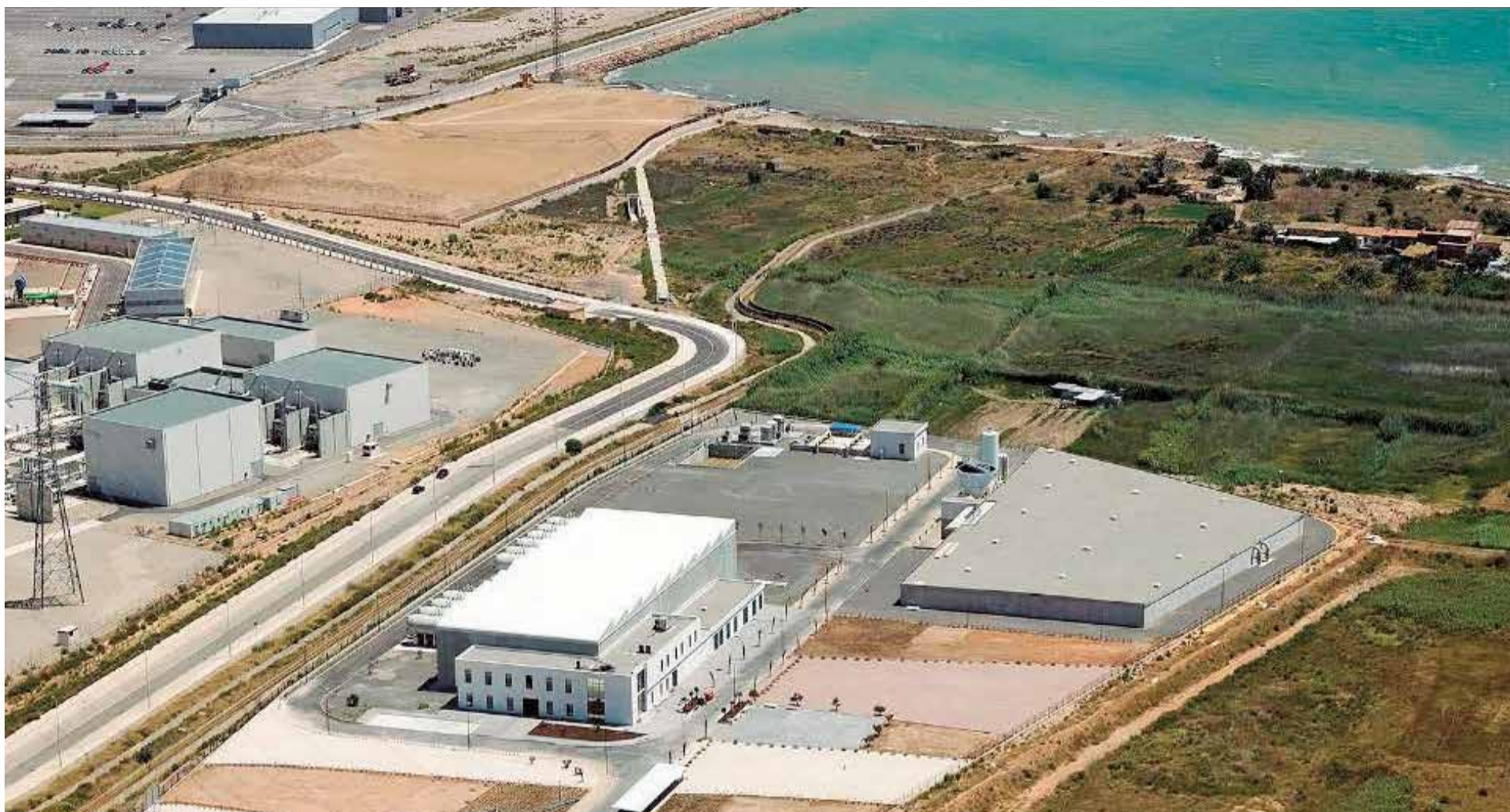
Desalinizadora de Sagunt que producirá agua para Cataluña en una imagen facilitada por Setapht. / SETAPHT