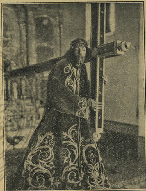
NUESTRO PADRE JESÚS PATRON DE ORIHUELA