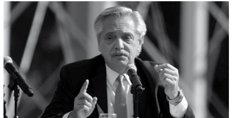
Contra reloj. Alberto Fernández apuntó contra los jueces.

Fernández detalló que esta medida alcanzará a unos "9.000 chiquitos y chiquitas de nuestra patria" que hasta ahora quedaban al margen de la AUH. En este marco, dijo que "Vamos a volver a hacer un país en donde los únicos privilegiados sean los niños y las niñas, porque eso va a ser un país justo", sostuvo.