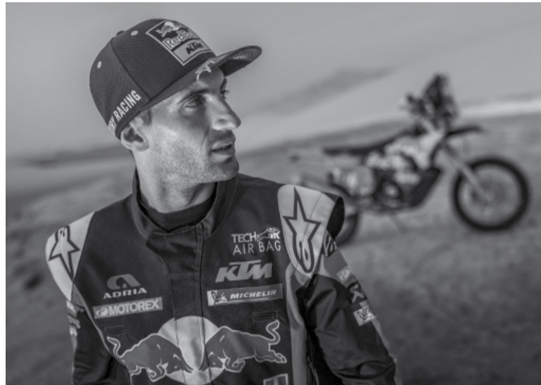
Bautismal. Es la segunda participación del conductor del Dragon en la competencia más dura del mundo.

En la general de la división, los seis primeros pilotos están agrupados con una diferencia menor a los diez minutos: 1) Howes (23:16:37),