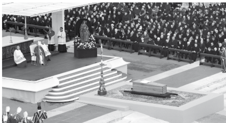
Funeral. El papa Francisco frente al triple ataúd con los restos de su predecesor Benedicto XVI.

En su mensaje Francisco aludió a la dimisión de Benedicto y recordó "la conciencia del Pastor que no puede llevar solo lo que, en realidad, nunca podría soportar solo y, por eso, es capaz de abandonarse a la oración y al cuidado del pueblo que le fue confiado".