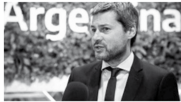
El ministro de Turismo y Deporte.