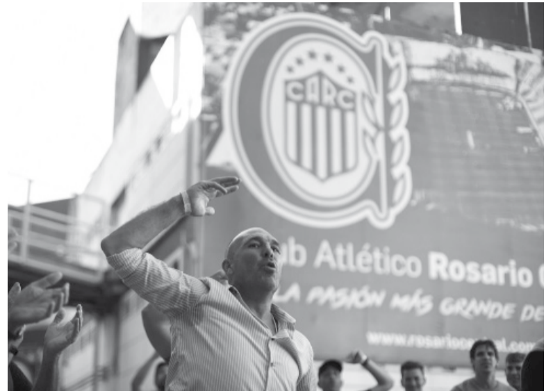
Caliente. El “Pejerrey” dijo que los dirigentes le prestaban dinero al club y lo cobraban con un “interés del 29% en dólares”.

lloso explicó: “nos dejaron deudas por 1.600 millones (de pesos) entre cheques, bancos y deudas corrientes, cuando los ingresos del club por televisión son 700 millones anuales, es decir que nos dejaron endeudados dos años y pico. Yo no estoy acostumbrado a tener deudas, pero vamos a tener que aprender a manejarlos, va a ser un año difícil”.