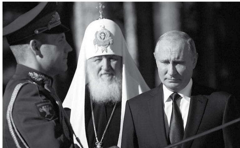
Reticente. Así se mostró Estados Unidos ante la acción de Putin.

En Rusia, el patriarca Kirill, cercano a Putin, había hecho más temprano un llamado a un alto el fuego en vísperas de la Navidad ortodoxa, que se celebra este sábado.