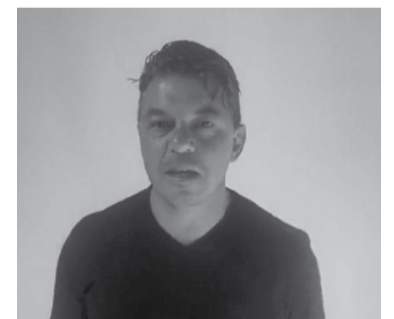
La noticia fue anunciada por el propio DT.