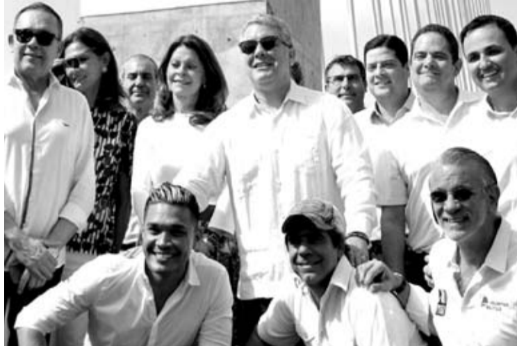
Se vio un acercamiento con el presidente Iván Duque, ya que asistió a la inauguración del puente Pumarejo, donde estaban Vargas Lleras y los Char.