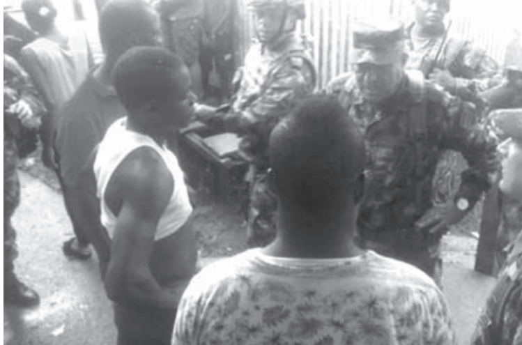
Los ilegales han pasado por varias comunidades afro, amenazando a sus pobladores con sembrar minas antipersonales en los cultivos.

Según la información de la organización Intereclesial, desde el pasado domingo 5 de enero a las 2:00 p.m, los ilegales han pasado por varias comunidades afro, amenazando a sus pobladores con sembrar minas antipersonales en los cultivos para retomar el control de la zona.