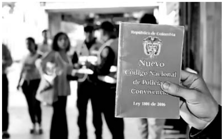
En 2016 se introdujeron cambios y se promulgó la ley 1801 de 2016 que entró en vigencia en enero de 2017, la ley quedó con 243 artículos.

En el histórico de demandas que tiene la Corte Constitucional al Código de Policía, hay registros desde el 2004, pero el 80, 6 por ciento de esos recursos fueron impuestos desde la modificación de la normatividad en 2016. Es decir que en cuatro años el reglamento de la Policía ha recibido más demandas que en toda su existencia.