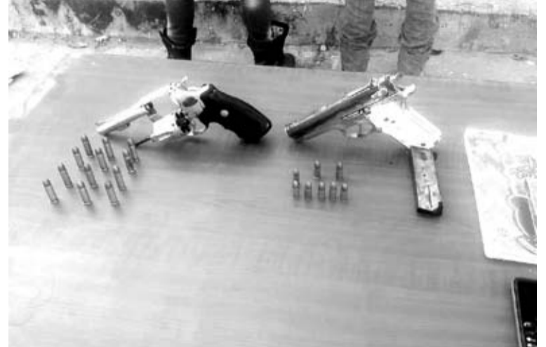
Entre los elementos incautados están una pistola y un revólver con municiones, una moto, un celular y una agenda con información.

Cabe anotar que entre los elementos incautados a los dos sujetos están una pistola