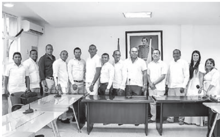
En el recinto del Concejo de Hatonuevo tomaron posesión los nuevos once miembros de la corporación edilicia de la localidad.