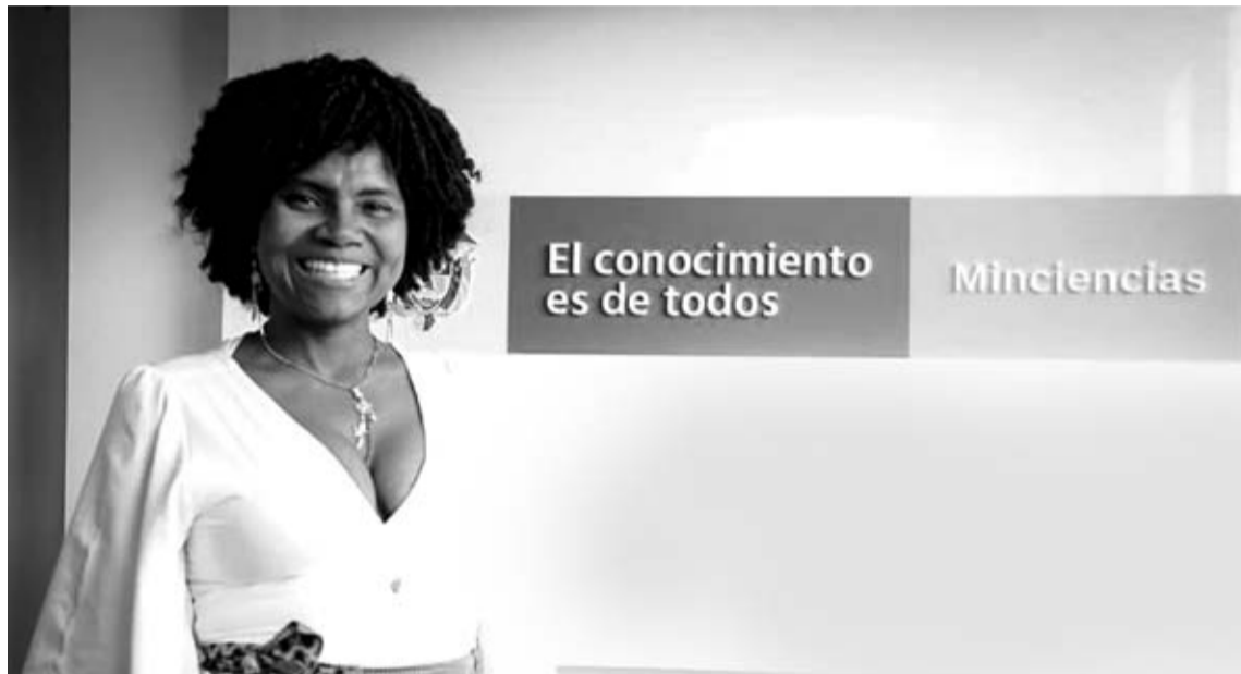
Mabel cuenta con una lista de logros académicos y profesionales que se integran con su calidez humana.

Desde siempre entendió que el camino era la educación y de ahí se desprenderían todas las posibilidades de aportar, ha nutrido tanto su hoja de vida que se podrían acumular muchas páginas hablando de ello, lo cual, argumenta con honores la asertiva decisión presidencial de nombrarla como primera ministra del recientemente creado Minis-