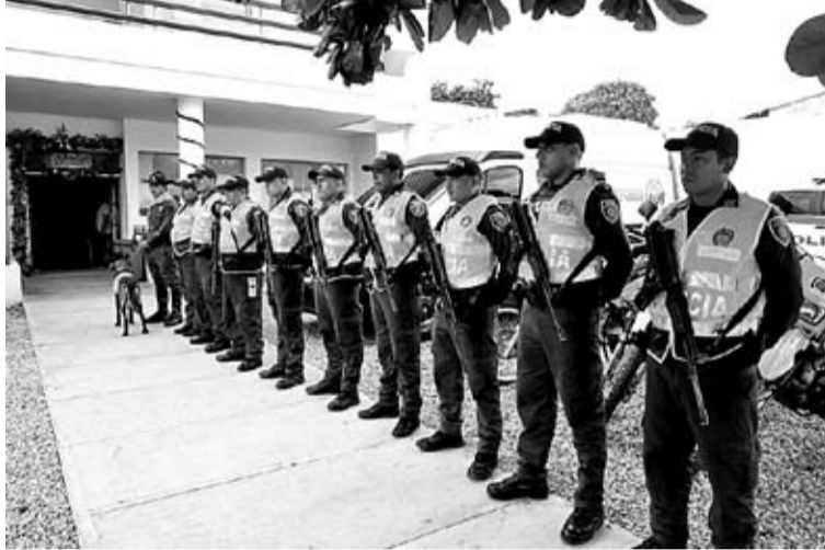
La Policía indicó que el homicidio presentó una reducción de 4, las lesiones personales menos 75 y en el hurto a comercio menos 14 casos.

Resaltó que en el cuadro Riohacha se posiciona en el puesto 7 en el departamento