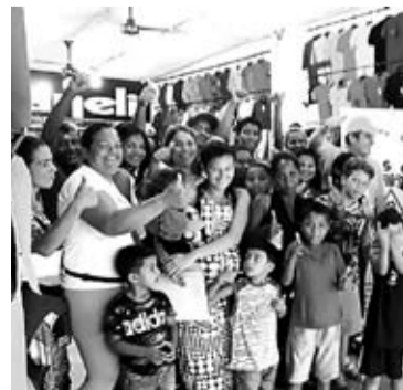
Entregan alimentos, agua potable, kits educativos, entre otros.

“Hemos logrado integrar desde Funsedis a la sociedad a través de una política de seguridad que se expande a todo el