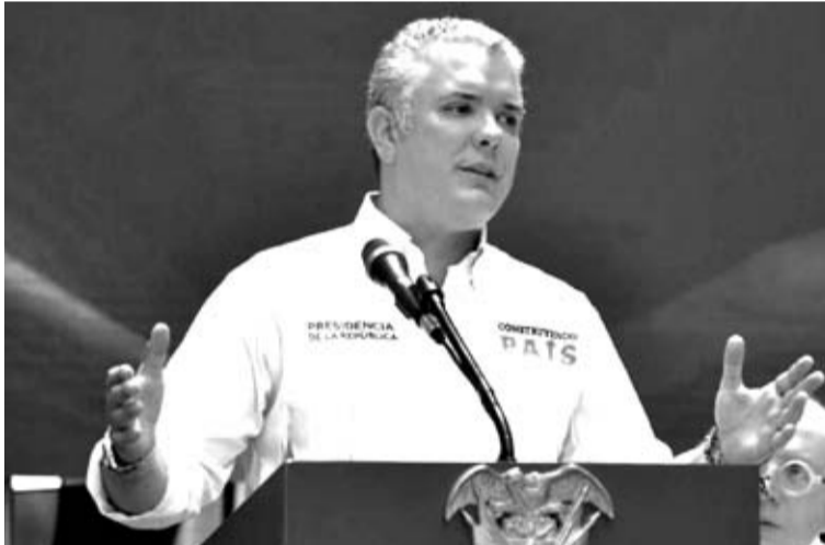
El jefe de Estado Iván Duque, indicó que alcanzar esa meta no es fácil, pero que están con el deseo de presentar la candidatura.

Dijo que espera que con el ministro (del Deporte) Ernesto Lucena "sigamos promoviendo