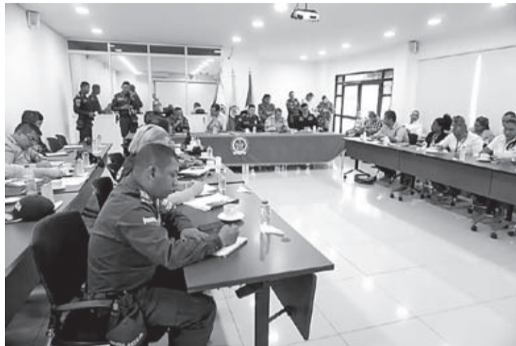
Durante la reunión se acordó realizar los consejos de seguridad con una periodicidad mensual y coordinaron diferentes estrategias.

El mandatario anunció que es prioritario adoptar acciones efectivas para contrarrestar el alto índice de hurtos a personas y de automóviles que se presentan en esta zona del país, principalmente en los