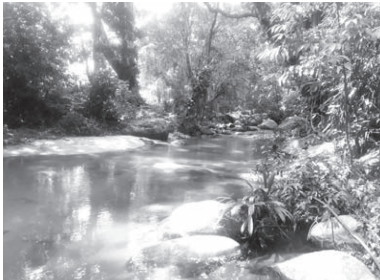
Los habitantes denuncian el derrame de aguas servidas al río Jerez, ya que el ducto está roto y las aguas caen directo al afluente.

que deben soportar los habitantes de Dibulla, es el derrame de las aguas servidas al río Jerez, ya que estas deben ser bombeadas hasta el emisario final por encontrarse a un nivel más elevado al de la población, pero el ducto está roto y las aguas caen al afluente.