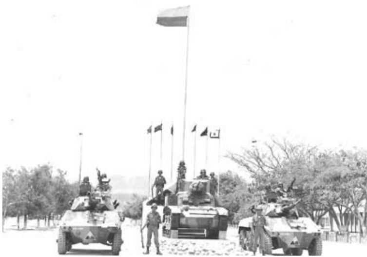
La unidad militar fue creada mediante decreto número 3446 del 30 de diciembre de 1919, denominándose Regimiento de Caballería No. 2 Rondón.

En el año 1935 es activado en la población de Uribia, en la Alta Guajira e instalado en la ranchería de Juyasirain, con el nombre de Grupo de Caballería No. 2 Rondón, donde permaneció hasta 1937. Sin embargo, el intenso verano que azotaba en ese entonces a La Guajira, hizo que lo trasladaran a su actual ubicación en el