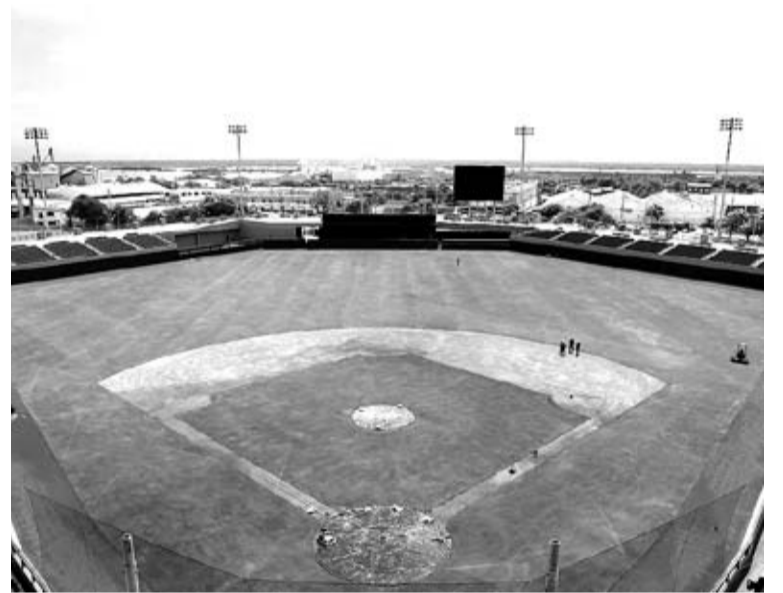
La ciudad de Barranquilla cuenta con varios escenarios deportivos remodelados, los cuales son aptos para competir internacionalmente.

los escenarios que tienen gran capacidad de competir internacionalmente. Barranquilla ha demostrado que ha hecho unos juegos excepcionales, y ahora lo que nosotros quere-