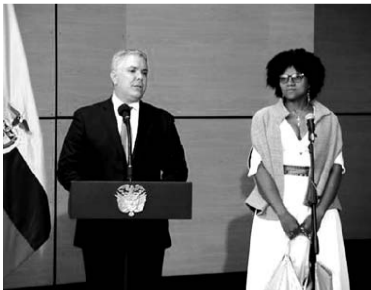
Mabel Torres fue nombrada por el presidente Duque como primera ministra del recientemente creado Ministerio de Ciencia y Tecnología.