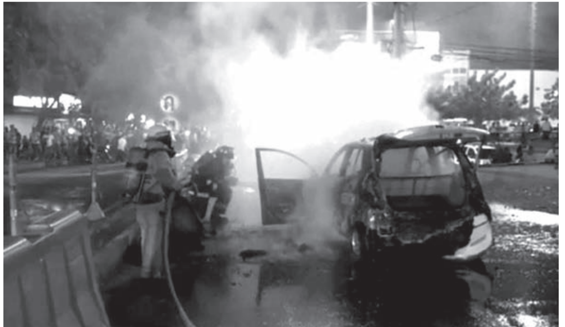
Justo cuando el taxi ‘zapatico’ se encontraba de servicio, se presentó la emergencia en el Rodadero.

Finalmente, una vez más el comando bomberil hizo un