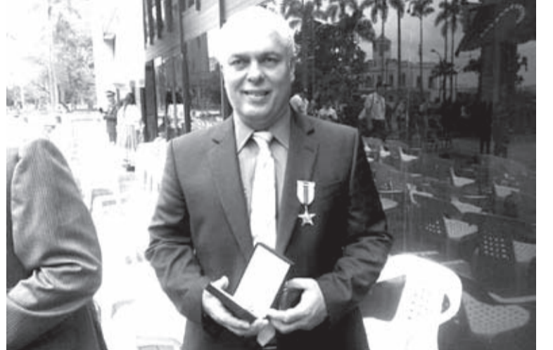
Alcibiades Libreros Varela, fiscal especializado contra el crimen organizado fue asesinado el pasado 29 de diciembre en Cali.

Añadió que, dentro de los cuatro capturados directamente por el crimen, está un hombre de 20 años, quien presuntamente interceptó el carro en el que se movilizaba el fiscal Libreros, lo intimidó con arma de fuego con el propósito de hurtarle una cadena, y pos-