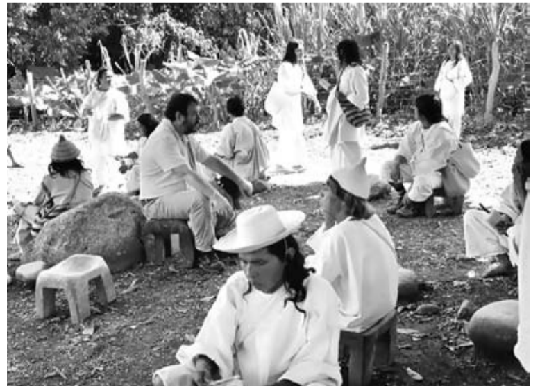
La UNP dispone fortalecer el esquema de comunicaciones, desarrollar procesos de fortalecimiento territorial y capacitaciones.