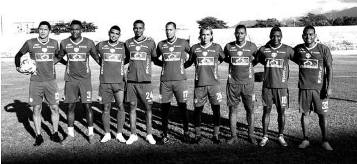
El plantel del Unión todavía está en la búsqueda de dos nombres para cerrar el libro de contrataciones.