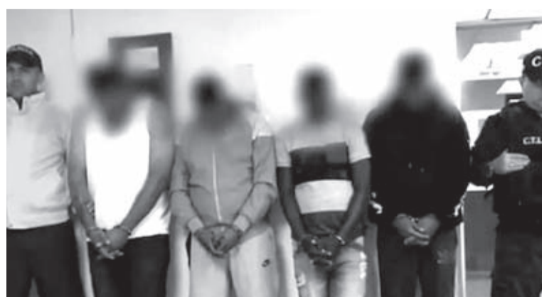
Los presuntos responsables del homicidio del funcionario harían parte de una banda delincuencial dedicada al robo de joyas.