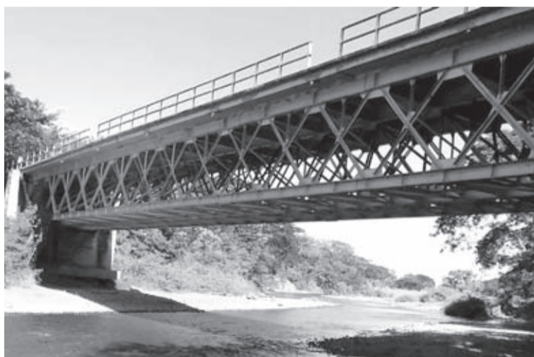
Este proyecto 'Autopista Pedro Castro Ruta del Folclor' sedujo a muchos políticos en 1978, por su costo de 21.940 millones de pesos.

la fuente, existían constancias de que 10 dueños de este sector recibieron rubros por estos lotes.