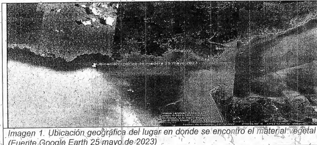
Imagen 1. Ubicación geográfica del lugar en donde se encontró el material vegetal