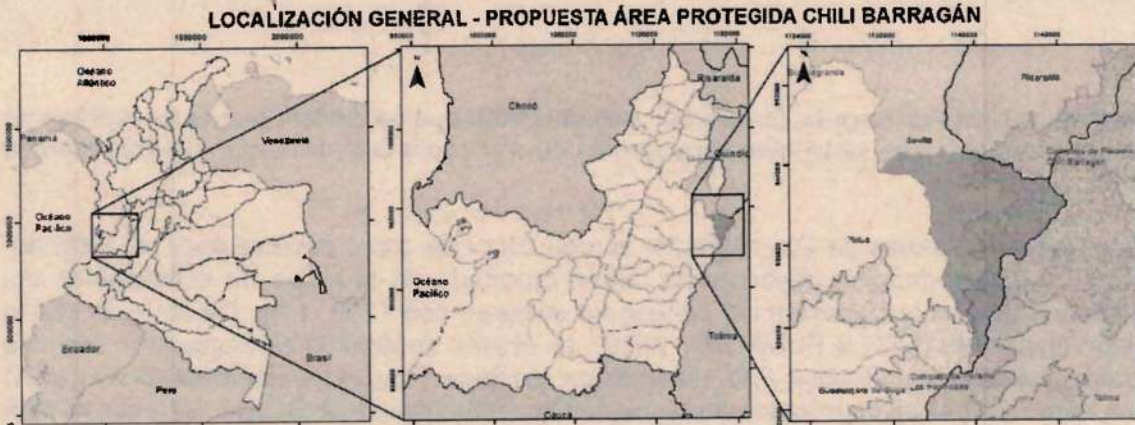
Figura 1. Mapa del polígono del área a declarar (amarillo) ubicado en el municipio de Sevilla en el departamento del Valle del Cauca.

“POR EL CUAL SE RESERVA, DELIMITA, ALIQUOTA Y DECLARA EL DISTRITO REGIONAL DE MANEJO INTEGRADO BOSQUE SECO ALEGRÍAS Y PÁRAMO EL TIBÍ Y MIRAFLORES- MUNICIPIO DE SEVILLA, DEPARTAMENTO DEL VALLE DEL CAUCA”