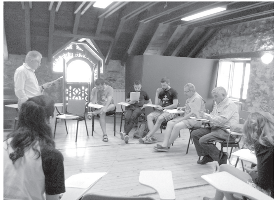
Taller sobre as carauteristicas de l'aragonés d'a Bal de Tena, feito en o Pueyo de Tena o 27 de mayo.

O 15 de mayo se fazió en a siede d'o Consello d'a Fabla Aragonesa a clase de rematanza d'o curso. La dio Francho Nagore e trató sobre a bariación diatopica en l'aragonés. Con isto rematan as clases d'iste curso, que han tenito buena azeutazón y en as que han colaborato como profesors amás d'os prenzipals, Chusé Inazio Nabarro e Chulia Ara (enfiladora d'o curso), belatros más que han feito sesiones espezials. [Fertús Nasarre]