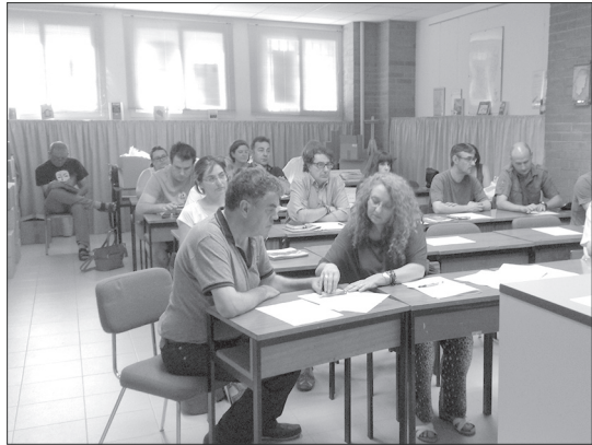
Un inte de l'Asamblea d'o Consello d'a Fabla Aragonesa feita o día 17 de chunio.

O BOA de 13 de chunio publica a Resoluzión por a cuala s'autoriza a ros zentros a impartir Luenga Aragonesa e Luenga Catalana o curso benién. Por o que pertoca a l'aragonés, a rilazión de zentros