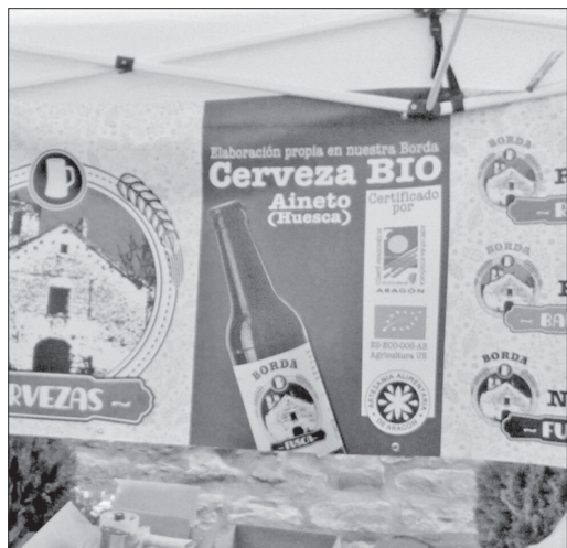
Propaganda d'a biera "Borda", feita en Aineto.

Mes de chunio cuenta as calorinas en a localidá altoaragonesa de Boltaña, con a zelebrazió os días 23, 24 e 25 d'a Feria d'a biera artesana d'os Pirineus. Sin dandaleo, un ebento tan refrescán como embrecato con a realidá lingüística d'a zona, ya que en o suyo cartel publicitario podemos trobar promozió ista feria dica en cuatro luengas diferens, como son o castellano, o franzés, o catalán, e l'aragonés. Una clucada a ra cultura lingüística d'os Pirineus que siempre ye d'agradexer. [Carlos Hernández Hernando]