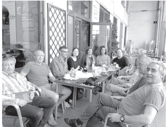
Un inte d'o café-charrada feito en a Fería d'o Libro de Uesca o día 28 de mayo.