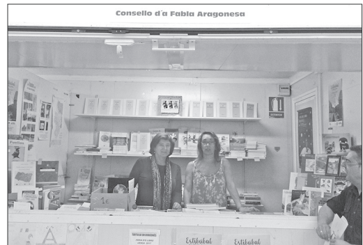
Imachen d'a botiga d'a Editorial Publicazions d'o Consello d'a Fabla Aragonesa en a Feria d'o Libro de Uesca.

Menzi3n espezial bi ha que fer a ra S. D. Uesca, que fendo onor á o suyo lema "Fiels siempre sin reblar", en o mes de chunio remataba una temporada istorica, quedando-se en o sesto puesto d'a segunda dibisi3n, batendo toz os suyos récorde, e clasificando-se por primera begata ta ra promoci3n de puyar ta ra primera dibisi3n, dimpués d'una bitoria epica en Valencia, fren a ra U. D. Levante, primer clasificato, e que por unos días nos fazió a toz os aragoneses e toz os oszenses, soniar con amanar-nos ta ra masima categoria d'o fútbol español. A ra fin, en o playoff no podió estar, fren á o Getafe C. F., pero o fútbol oszense e o fútbol aragonés se fazió notar entre os millors en una añada inolbidable. [Carlos Hernández Hernando]