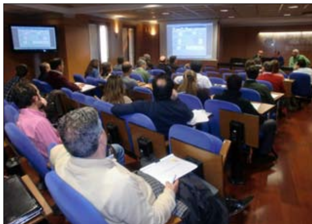
La Comisión de Informática

La comisión informática programará cursos de informática básica o de cualquier otra aplicación si existiera demanda suficiente.