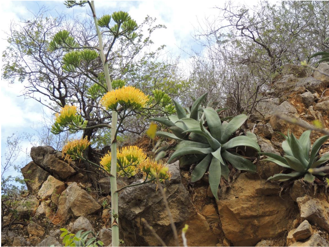
Figura 1: Rosetas gigantes de Agave cocui creciendo en las zonas áridas del estado Falcón, Venezuela.

Agave cocui , o cocuy, prima hermana de los mezcales mexicanos, es una especie que ha generado bienestar a los asentamientos humanos que la han utilizado desde épocas remotas, muy especialmente a los que poblaron las tierras secas de la región Centro Occidental de Venezuela. El uso y aprovechamiento de esta planta se remonta a la época prehispánica ya que las pencas de cocuy horneadas eran utilizadas como alimento por las etnias Caquetias, Jiraharas, Ajaguas y Gayones, que poblaron dicha región. Para procesarlas abrían en el suelo un hoyo de regular tamaño, de aproximadamente un metro de ancho por uno de