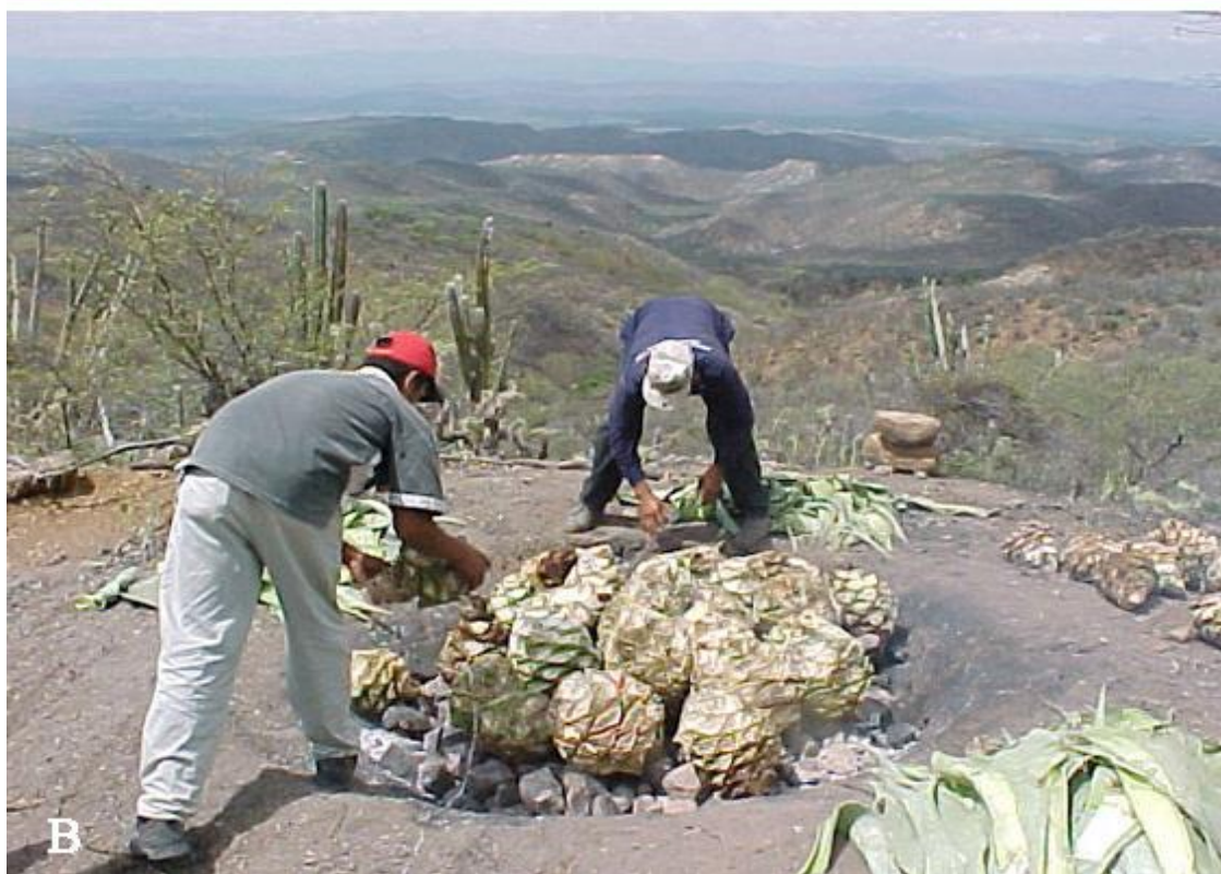
Figura 3 A: Botellas recubiertas de la fibra (dispopo) de Agave cocui conteniendo el licor artesanal conocido como cocuy de penca. Estado Falcón, Venezuela. B: Elaboración artesanal del licor de cocuy, Estado Falcón, Venezuela. (Fotografía: A y B. Miriam Díaz).