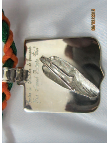
La Orden Restrepia

en donde desempeñó hasta su muerte el cargo de alférez real. Era quien representaba al rey, mandaba el ejército como un general. Estos títulos los concedían los Virreyes y eran confirmados por el monarca y fueron como tantos de la India, se conseguían en virtud de las donaciones pecuniarias pero caían en personas de hidalguía debidamente probadas.