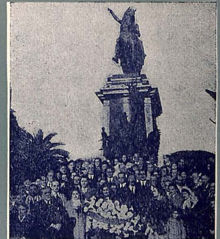
Homenaje a San Martín.