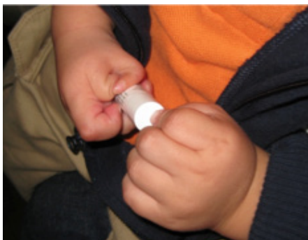
Figura 2. Duplicatura del Pulgar, notese el grado de falta de oposición, aunque hay función de la mano para con la misma deformidad.

funcionará como ferula y guía del crecimiento de la nueva uña y se sutura la piel con hilos absorbibles 6-0.