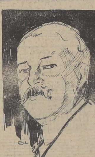
Meteoro, torre del antiguo Monasterio de San Barlaam. — Vista general del Pireo. — El Colegio Americano de Estudios Clásicos, de Atenas. — El Premier Kafandarys.

Durante más de treinta siglos, Atenas ha aparecido y desaparecido en la historia, subiendo hasta la cúspide de la gloria y cayendo en las profundidades del olvido. La historia de la ciudad puede dividirse en dos períodos: antes y después de Cristo. El primero ha sido descrito repetidas veces; el segundo a menudo es oscuro y a veces olvidado. El primero fue una era de desarrollo, progreso y gloria; el segundo se levanta solamente ahora con una nueva vitalidad.