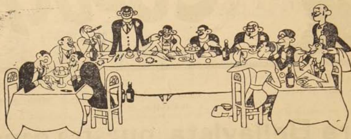
Uno de los contertulios se saca los zapatos hablando: (Los otros contertulios sufren las consecuencias)