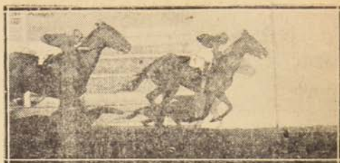
Llegada del Clásico «Frescura» en que el importado Frescolett se impuso estrechamente sobre sus rivales, con tiempo record. Fué trasladado al Hipódromo Chile de la capital.