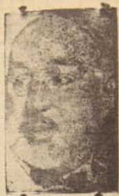
Angel Ossorio y Gallardo