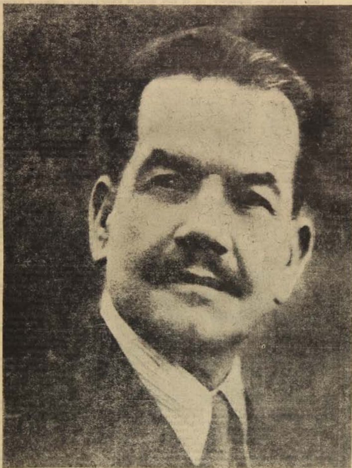
S. E. el Presidente de la República, Don Pedro Aguirre Cerda

La A. P. C. de Chile, quiere honrar hoy las (A la pág. 8)