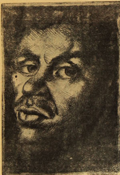
Grabado y prosa de C. Hermosilla Alvarez

Contemplándolos, es cuando más profunda se me hace la evidencia del gran destino del hombre y la potencia de su alma.