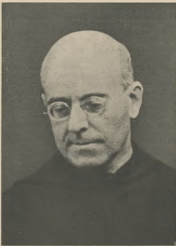
La Revolución segó su vida. Y ya consiguió ver con sus propios ojos lo que su anhelo artístico aspiró e intuyó: el cielo.