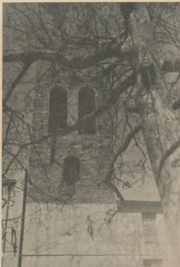
El árbol de la Plaza y el viejo campanario que asistirán con su gravedad y su significado a nuestra Fiesta de San Vicente.