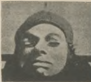
El vértigo de la velocidad. Sus ventajas son múltiples, pero toma fácilmente un aire apocalíptico, formidable. En el primer recuadro, un aspecto normal. En el segundo, la misma señorita fotografiada cuando el velocímetro del avión marcaba 450 km. hora.