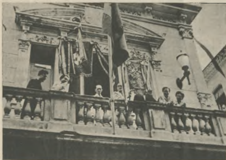
El Orfeón, en Palamós, cuando el Ilmo. Sr. Alcalde de aquella villa prendió en su «senyera» la «llaçada» conmemorativa.