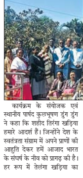
संयुक्त रूप से शहीद तेलंगा खडिया की 117वीं जयंती मनाई गई।

पूँजीवाद साम्राज्य के खिलाफ जबरदस्त संघर्ष किया और देश के स्वतंत्रता के संघर्ष में अग्रणी भूमिका अदा की थी। आज भी 4 केन दिव्कु जैसे पूँजीवाद साम्राज्य के खिलाफ एक संघर्ष व शहादत को याद किया जा रहा है।