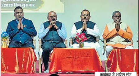
कार्यक्रम में शामिल लोग