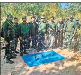
विस्फोटक सामग्री छिपाकर रखे गए हैं। सुनवाई के बाद सीआरपीएफ 214 बटालियन, महासभा के अखिलेश रावियर और सीआरपीएफ और जिला पुलिस की संयुक्त टीम बनाकर नक्सलियों को निरस्त किया जाए।