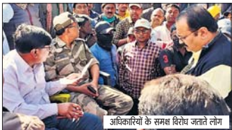
अधिकारियों के समक्ष विरोध जताते लोग

■ युकोयवू ने किया विरोध जताते हुए विभागीय