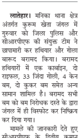
विस्फोटक सामग्री छिपाकर रखे गए हैं। सुनवाई के बाद सीआरपीएफ 214 बटालियन, महासभा के अखिलेश रावियर और सीआरपीएफ और जिला पुलिस की संयुक्त टीम बनाकर नक्सलियों को निरस्त किया जाए।