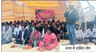
धरना में शामिल लोग

■ आजसू ने किया धरना केस वापस लेने की मांग ■ पुलिस के खिलाफ दैती निकाल कर दिया धरना