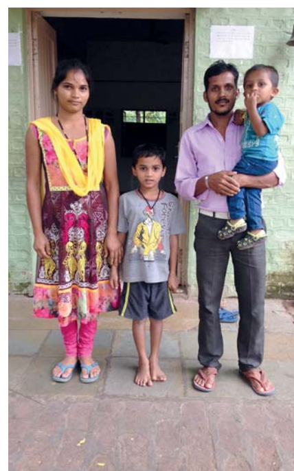
El trabajo con familias y jóvenes en Gujerat comienza a dar sus frutos.

salarios más altos, pero que están muy comprometidas con su comunidad. La mayoría también son adivasis, y por esa razón prefieren quedarse en nues-