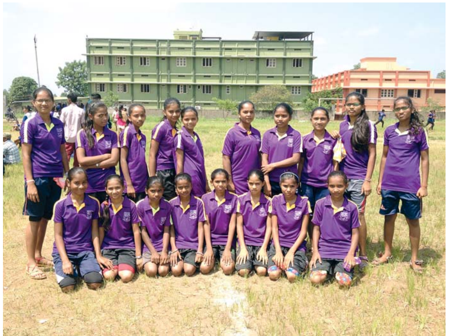
Niñas y jóvenes están obteniendo excelentes resultados en sus estudios y cada vez participan en más espacios.

Alpesh: Al igual que en otros lugares dónde se encuentra la Compañía de