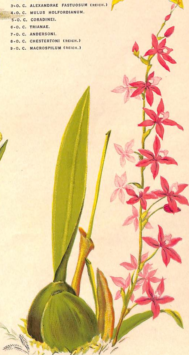
b) AGUADIJA. ODONTOGLOSSUM ROSEUM LINDENI COCHLIODA ROSEA BENTH ET HOOK