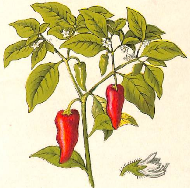
b) AJI. CAPSICUM ANNUM.