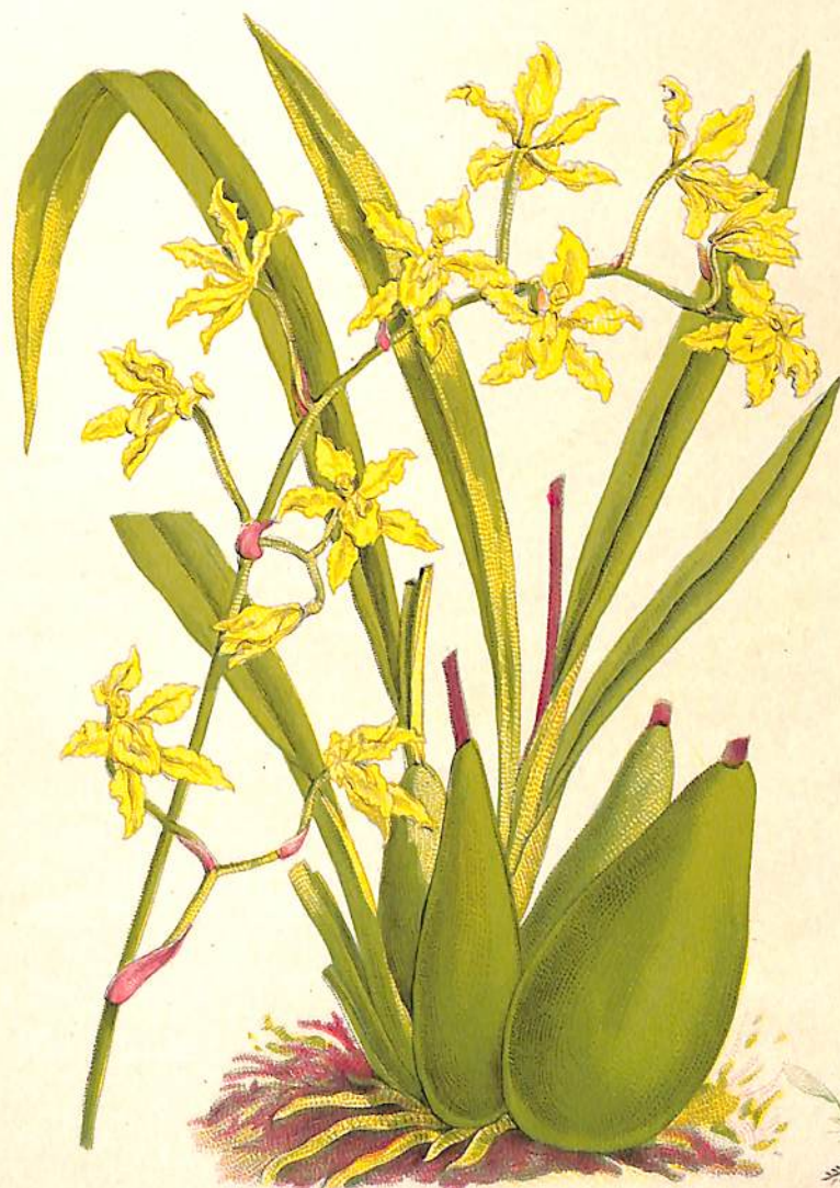
a) AGUADIJA. ODONTOGLOSSUM LINDENI