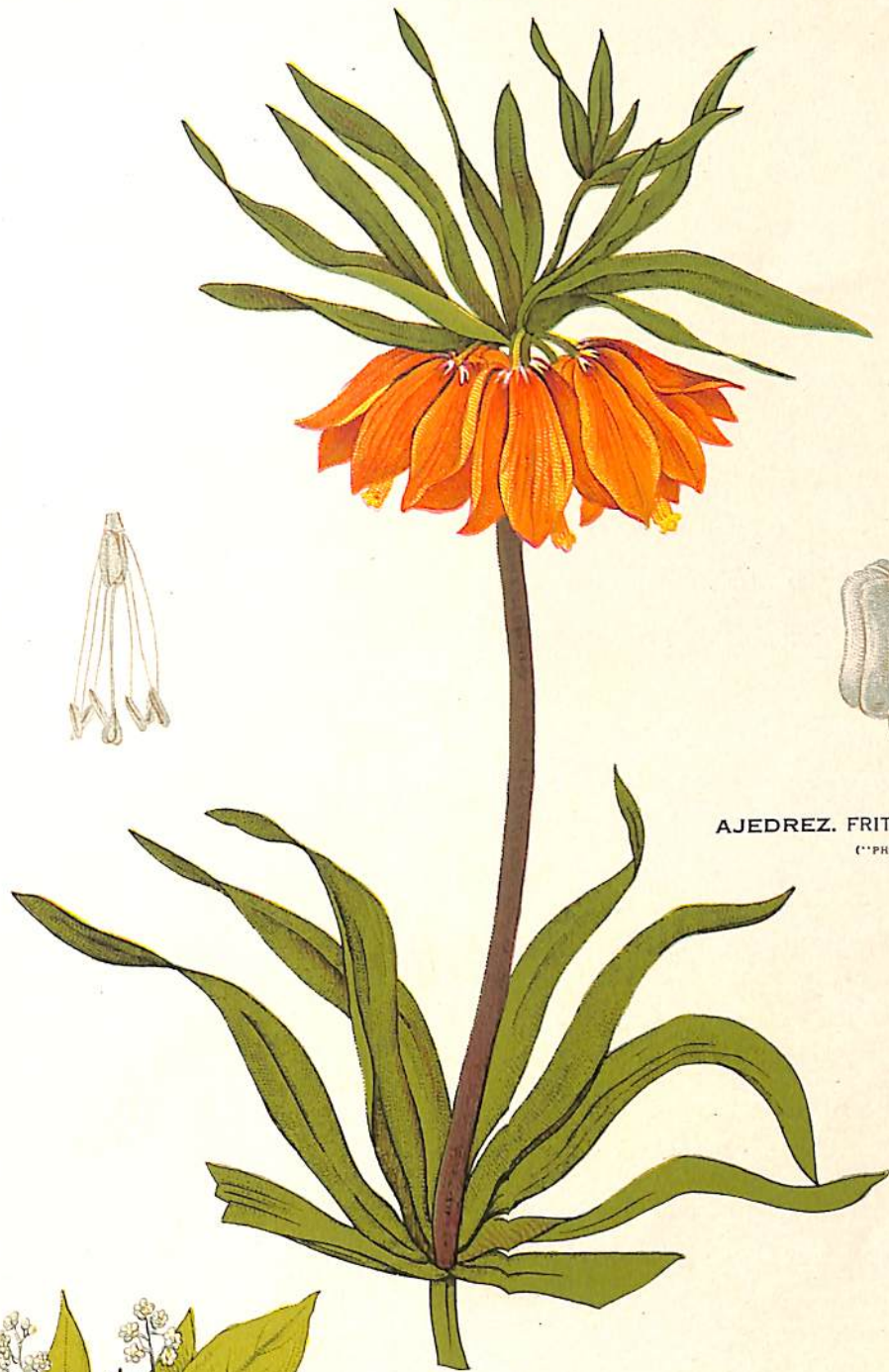
AJEDREZ. FRITILLARIA IMPERIALIS L.