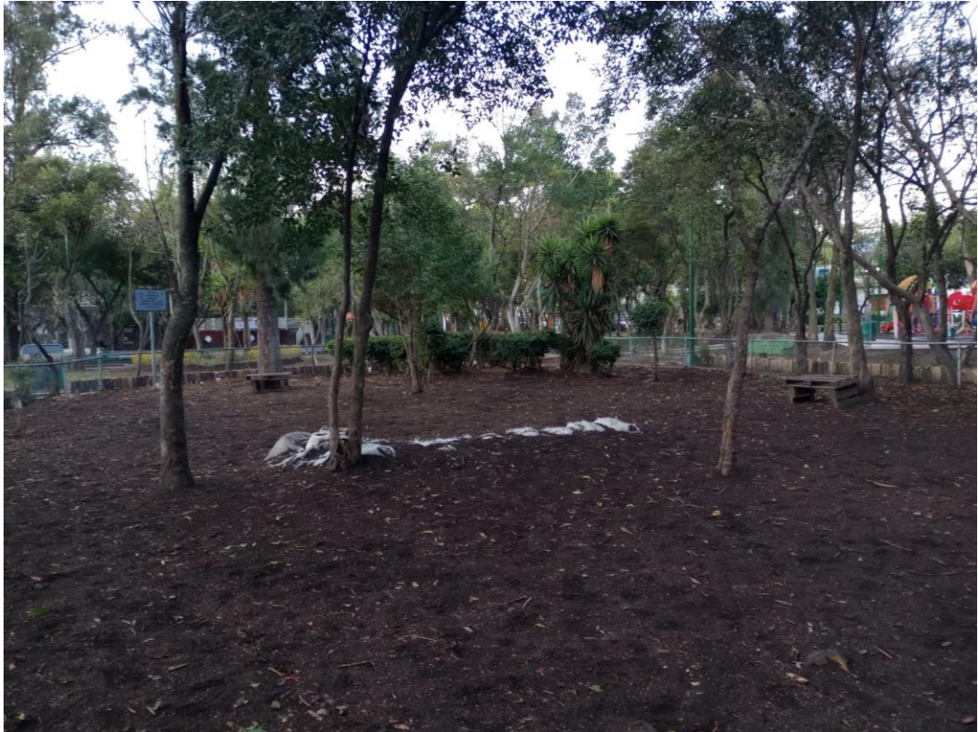
Figura 3. El corral, 2022.