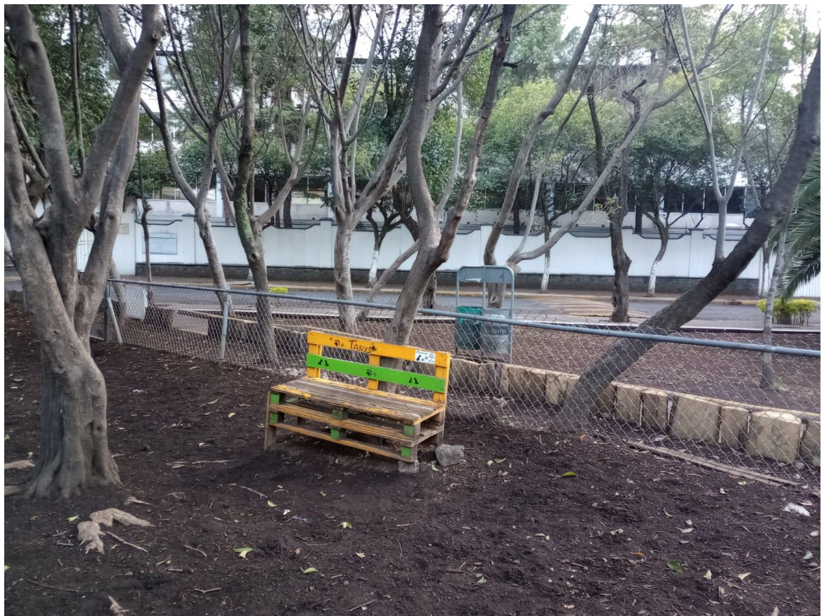
Figura 2. Vista del corral para perros, Parque Cuauhtémoc, 2022.