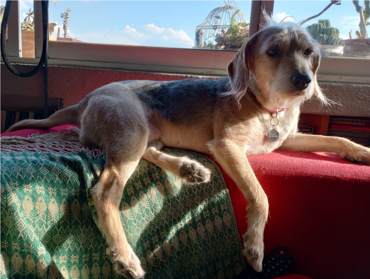
Kori ( te lo debo todo )