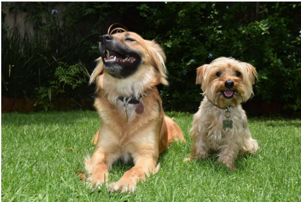
Lulú y Milo