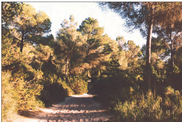
Camino del pinar

El pino ( Pinus halepensis ) forma un bosque en la parte más interior de la Punta de n'Amer, que juntamente con su sotobosque constituye la zona con más diversidad vegetal. El fruto del pino, la piña, contiene los piñones, importante fuente de alimento para muchos pájaros. Los piñones pueden ser fácilmente dispersados gracias a su vela que les permite ser transportados por el viento. Entre las hojas del pino crece formando bolsas la oruga del pino llamada procesionaria ( Thaumetopoea pityocampa ), principal enemigo del pino. El sotobosque está formado fundamentalmente de alitierno y brezo, pero en los claros también abunda la sabina.