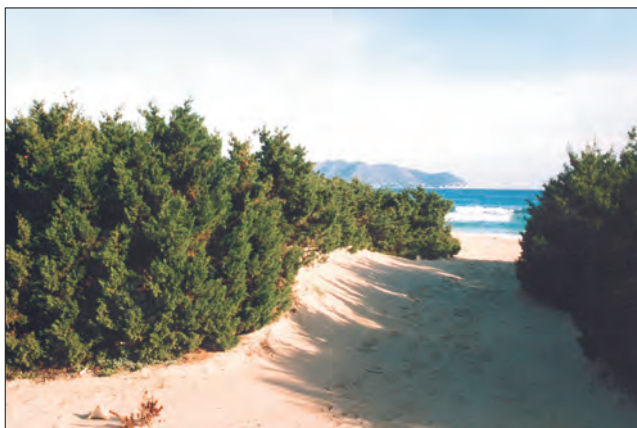
Dunas con sabinas

Aquí, la arena de la duna está fijada por las raíces de la sabina ( Juniperus phoenicea ), y en su abrigo crece el "Peu de milà" ( Thymelaea velutina ), planta exclusiva de las Baleares que