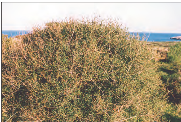
Alitierno en la garriga

pinos jóvenes que han nacido después del incendio, y que en un