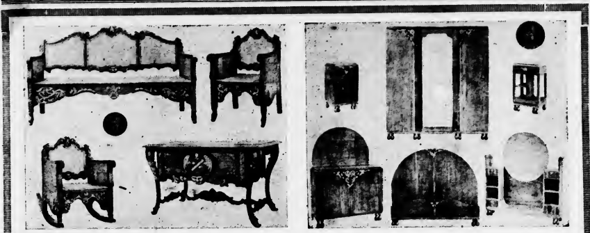
Most elegant, beautiful and latest style Cuban furniture made of only the best quality mahogany; the only wood that positively repels wood-ants and lasts for ever. All beautifully handpainted in 12 different shades. We have more than 20 different styles to select from; diningroom, bedroom, parlor and library sets. As to prices, these are so low, that you cannot help, but send your order at once. Come and look at the various styles and kinds.

Wilhelminastraat 40, Oranjestad. Exclusive Agent G. A. KUIPERS