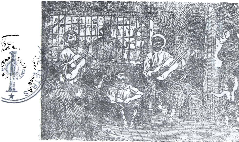
Canto por cifra, de contrapunto entre Martín Fierro y un negro

Dios hizo al blanco y al negro Sin declarar los mejores— Les mandó iguales dolores Bajo de una mesma cruz; Mas tambien hizo la luz Pa distinguir los colores.