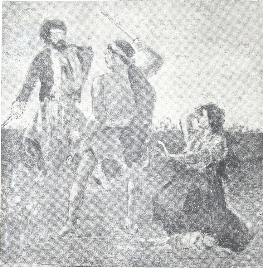
Pelea de Martin Fierro con un Indio.

Me inqué también á su lado A dar gracias á mi Santo— En su dolor y quebranto