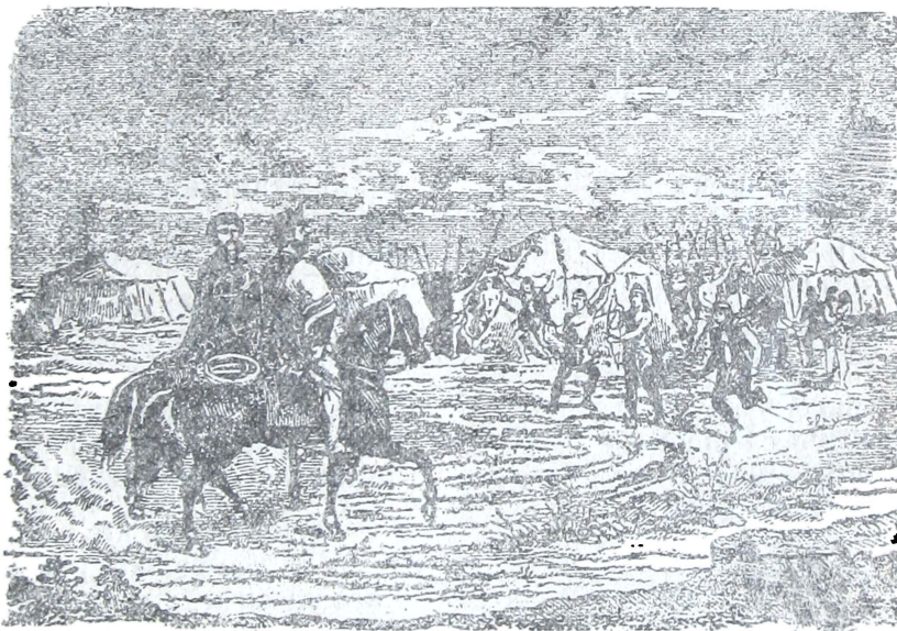
Llegada de Cruz y Fierro a las tolderías

Y las aguas serenitas Bebe el pingo trago á trago— Mientras sin ningun halago Pasa uno hasta sin comer, Por pensar en su mujer, En sus hijos y en su pago.