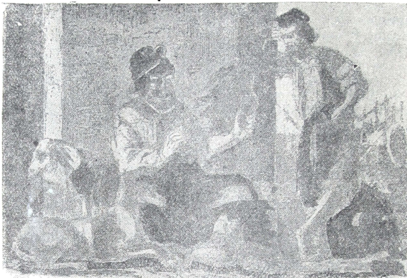
El viejo Viscacha dando sus consejos

Y gangoso con la tranca, Me solía decir, «potrillo, Recien te apunta el cormillo Mas te lo dice un toruno, No dejés que hombre ninguno Te gane el lao del cuchillo.»