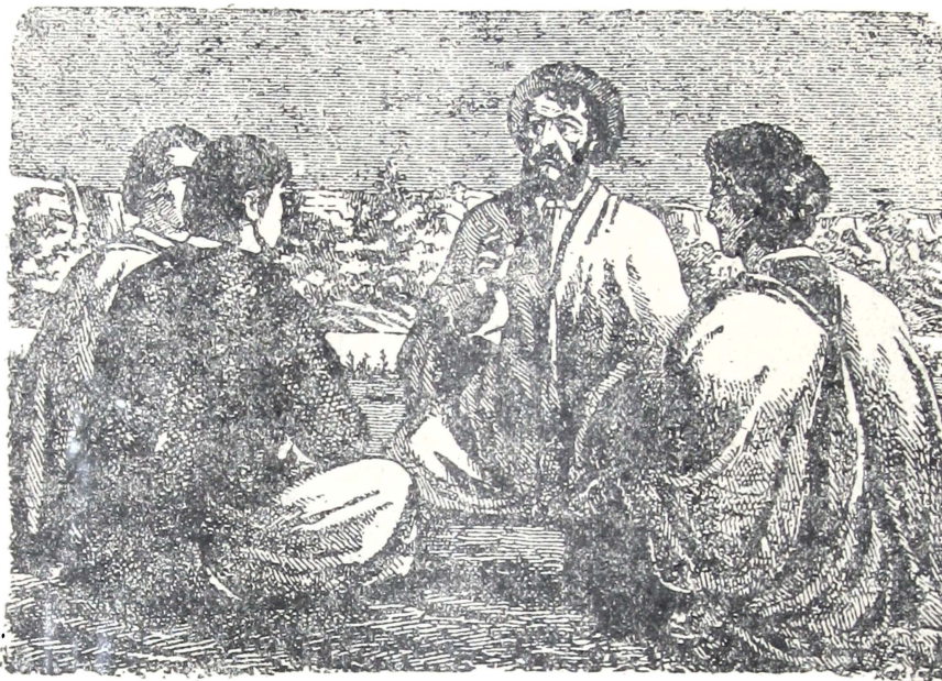
Martin Fierro dando consejos á sus nijos

Bien lo pasa hasta entre pampas El que respeta á la gente— El hombre ha de ser prudente Para librarse de enojos— Cauteloso entre los flojos Moderado entre los valientes.