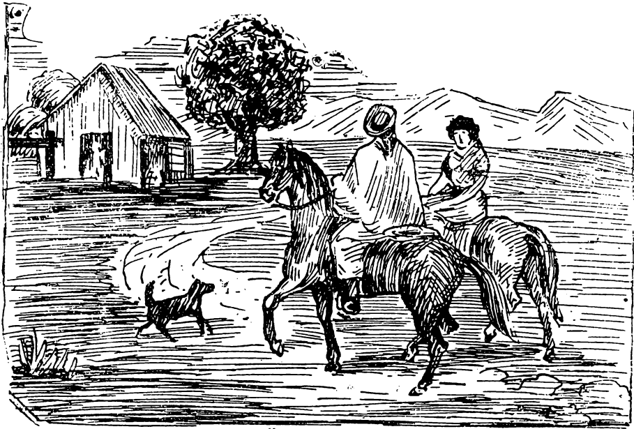
La vuelta de Martin Fierro

Marque su rumbo de dia Con toda fidelitá— Marche con puntualidá Siguiéndolo con fijeza, Y si duerme, la cabeza Ponga para el lao que vá.—