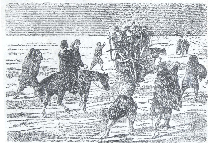
La vuelta del Contingente

El gato busca el jogan Y ese es mozo que lo entiende. —De aquí comprenderse debe Aunque yo hable de este modo; Que uno busca su acomodo Siempre lo mejor que puede. —Lo pasaba como todos Este pobre penitente, Pero salí de asistente Y mejoré en cierto modo.