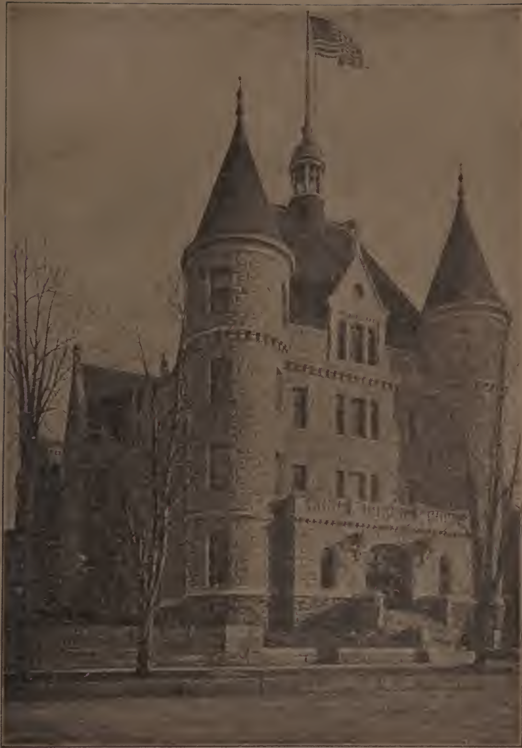
BUILDINGS OF INTERNATIONAL CORRESPONDENCE SCHOOLS SCRANTON, PA.