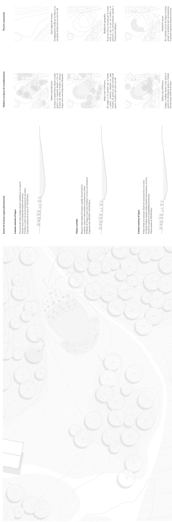
Plànol c. 1/250