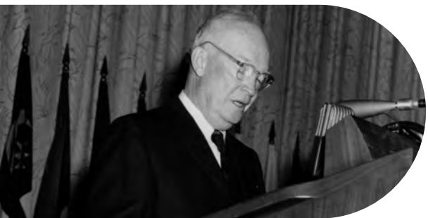
El presidente Dwight D. Eisenhower pronuncia las palabras de bienvenida en las Reuniones Anuales del Banco Mundial y el Fondo Monetario Internacional (1629418).

Cuando la iniciativa cobró un impulso considerable, recibió el apoyo del senador demócrata Mike Monroney, de Oklahoma, a quien le interesaba que se ofrecieran préstamos blandos a países en desarrollo y que el Banco Mundial fuera el organismo encargado de conceder esa ayuda. Monroney presentó la Resolución 264 del Senado de Estados Unidos, en la que se instaba a analizar la creación de una asociación internacional de fomento . Dicha iniciativa se conoció como la Resolución Monroney.