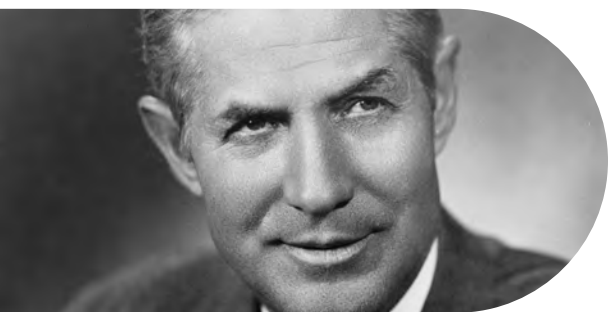
Senador de Estados Unidos, Mike Monroney, de Oklahoma (fuente: Oficina Histórica del Senado de Estados Unidos).

Ya en 1949, en un informe de la Organización de las Naciones Unidas (ONU) se propuso establecer una nueva organización internacional denominada Administración de Desarrollo Económico de las Naciones Unidas bajo los auspicios de la ONU. En la década de 1950, se estableció un programa apoyado por el Gobierno de los Estados Unidos, destinado a otorgar préstamos a los países pobres con el respaldo de donantes multilaterales.