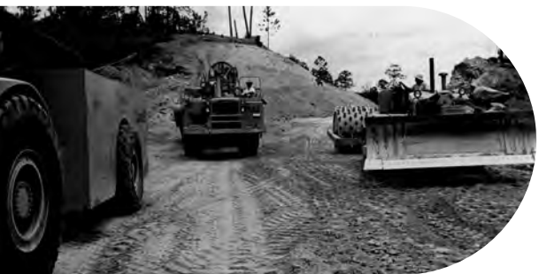
Construcción de una autopista al norte de Tegucigalpa, capital de Honduras (1722302).

Con un financiamiento inicial de USD 912,7 millones, la AIF se puso en marcha el 24 de septiembre de 1960 con 15 países signatarios: Alemania, Australia, Canadá, China, Estados Unidos, India, Italia, Malasia, Noruega, Pakistán, Reino Unido, Sudán, Suecia, Tailandia y Vietnam. Dentro de los primeros 8 meses desde su creación, alcanzó los 51 miembros y distribuyó créditos por valor de USD 101 millones a 4 países. En 1961, Honduras fue el primer país en recibir un crédito de la AIF: una donación de USD 9 millones para la construcción de una autopista.