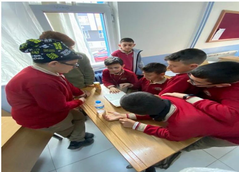
Öğrencilerin grup çalışmalarına başlaması