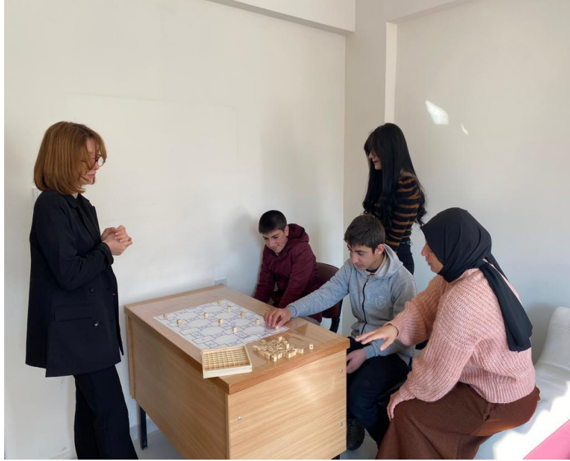
Stajyer đrencilerin etkinliđe katılımı