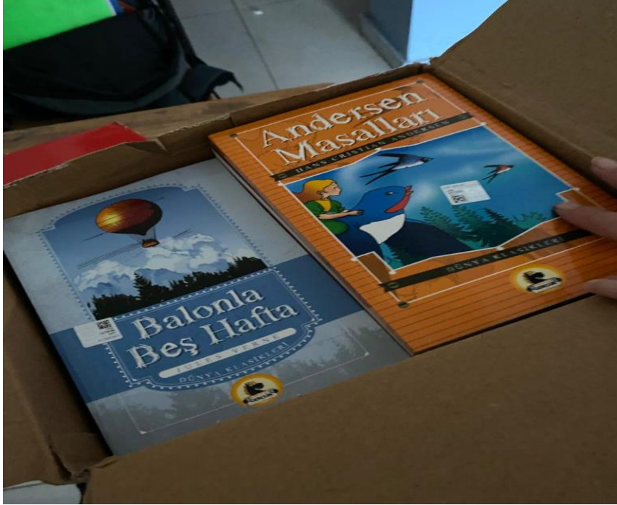
Türkçe dersi için seçilen 40'lı Dünya Klasikleri seti materyali