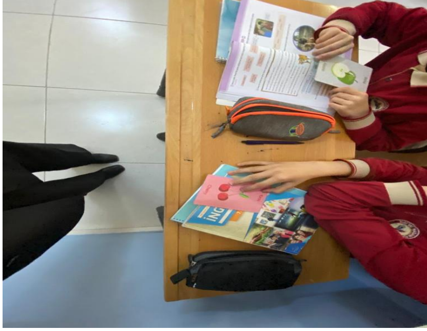
İngilizce öğrenim kartları