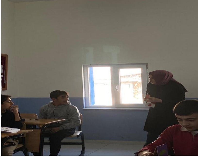
Dersteki uygulamadan bir kare