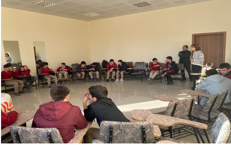
Fakültemiz psikodrama salonundan Türkçe dersi kapsamında hazırladığımız psikodrama etkinliđi