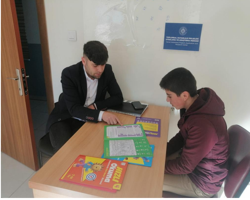
Destek eğitim öğrencilerinin okuma becerilerinin gelişimi için Türkçe dersleri kapsamında seçilen hızlı okuma seti materyalindeki etkinliklerin dersin öğretmeni tarafından uygulanması