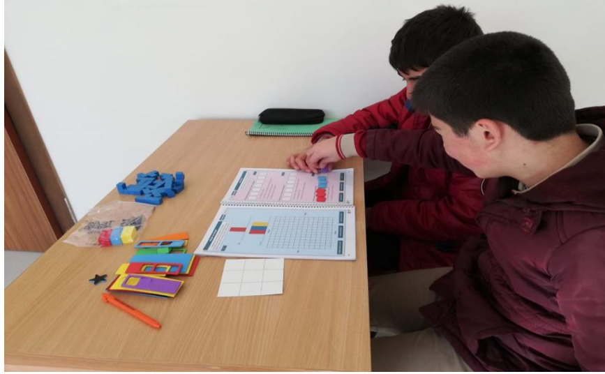
Destek eğitim öğrencilerinin sayısal, mantıksal ve düşünsel zekâ gelişimi için matematik öğretmeni ile seçilen akıl oyunları ve düşünme becerileri setinin içerisindeki etkinliklerinin uygulanması