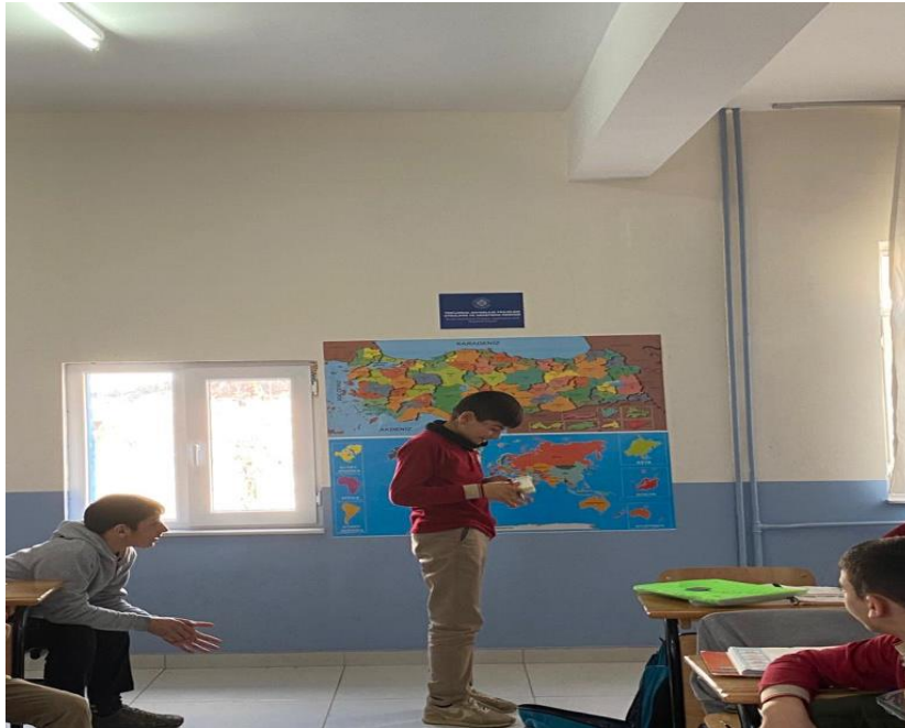
Öğrencilerin şehir/ülke seçim anı