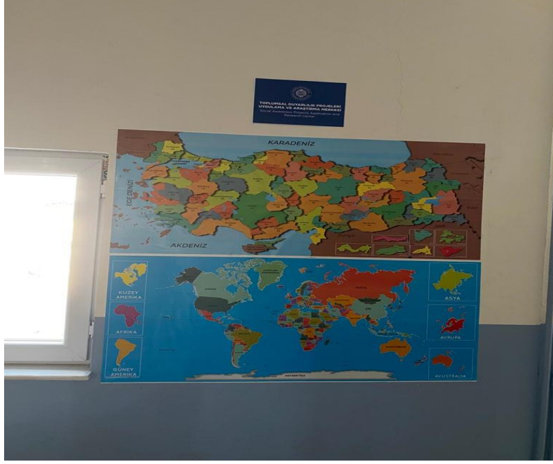
Sosyal bilgiler dersi için seçilen materyaller