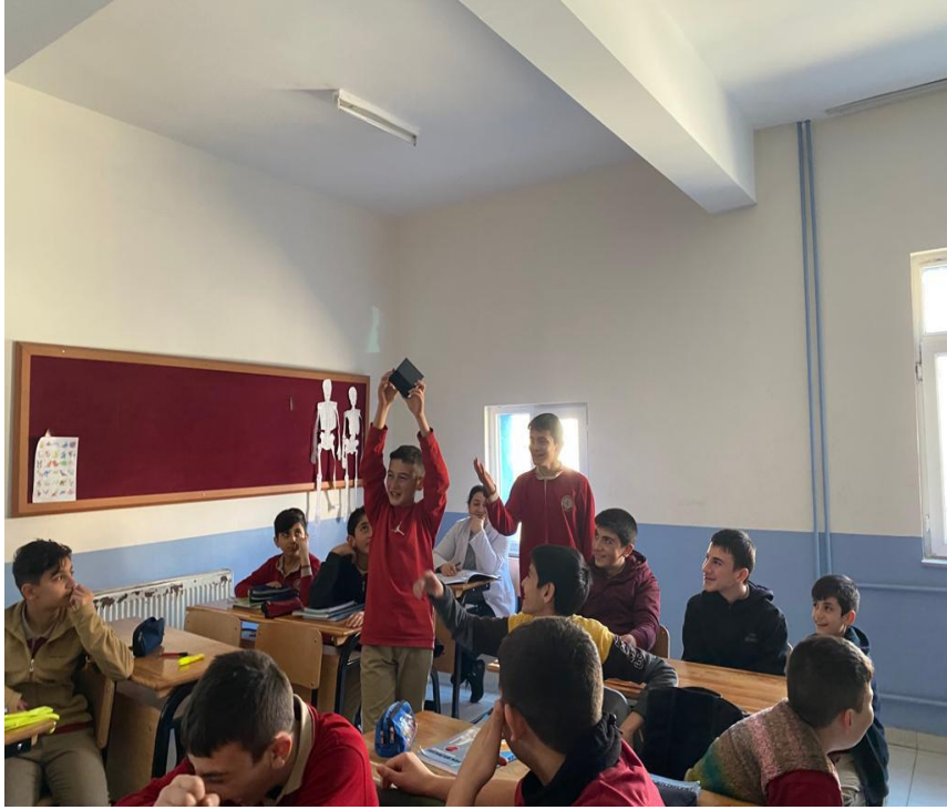
Öğrencilerin hazırladıkları grup çalışmalarının sınıfa sunumu