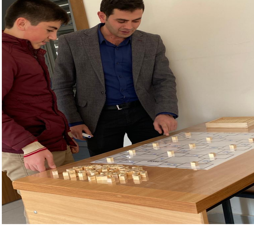
Sayısal labirent oyunu etkinliđinin gerekleřtirilmesi