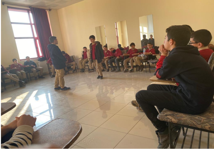
Hazırladığımız psikodrama etkinliklerimizin uygulanması