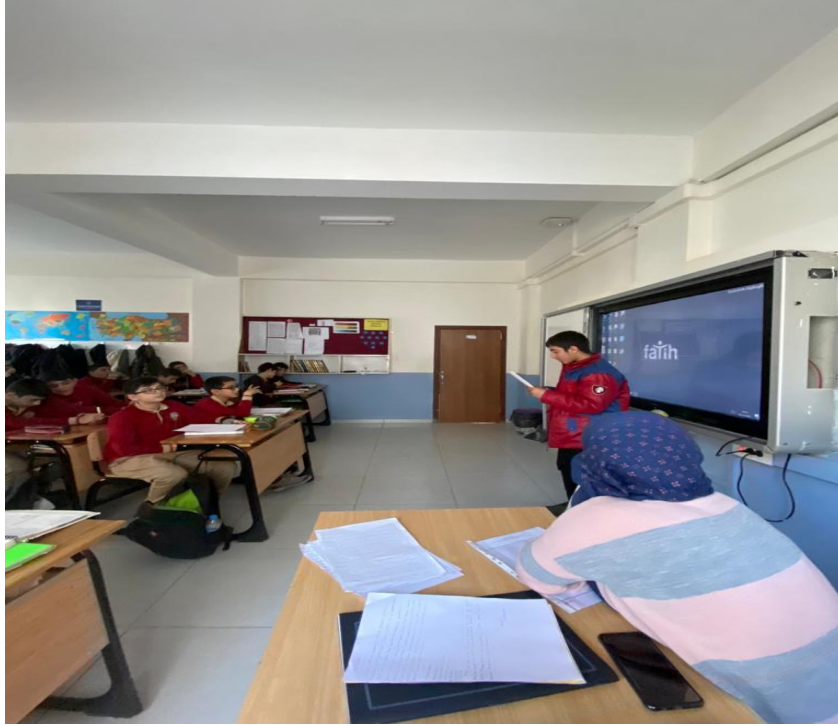
Öğrencilerin seçtikleri şehir/ülke ile ilgili çalışmalarının sınıfa sunumu