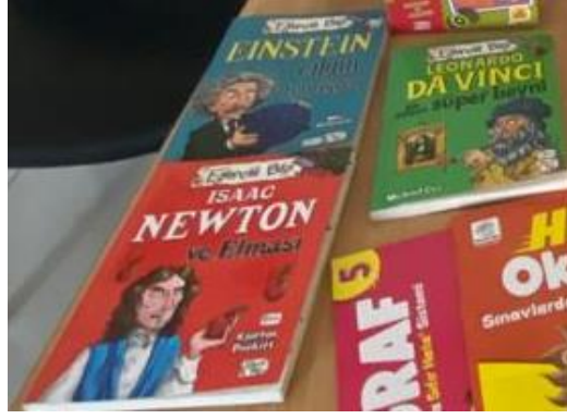
fen bilimleri dersi için seçilen materyal