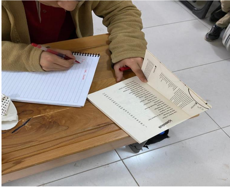
Öğrencilerin Fen Bilimleri dersi materyali ile çalışmalarına hazırlanmaları