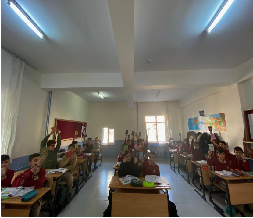
Öğrenciler İngilizce dersi için seçtikleri öğrenim kartları