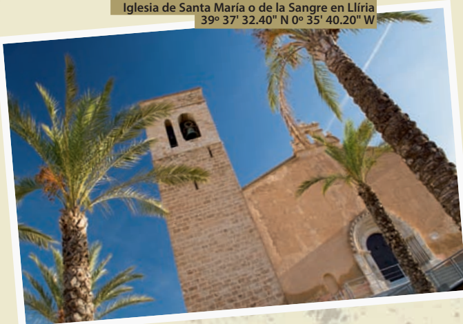
Iglesia de Santa María o de la Sangre en Lliria 39° 37' 32.40" N 0° 35' 40.20" W

Para comenzar la ruta en Castielfabib se puede llegar en autobús desde Valencia. Para el regreso desde Lliria será muy útil la vuelta en metro.