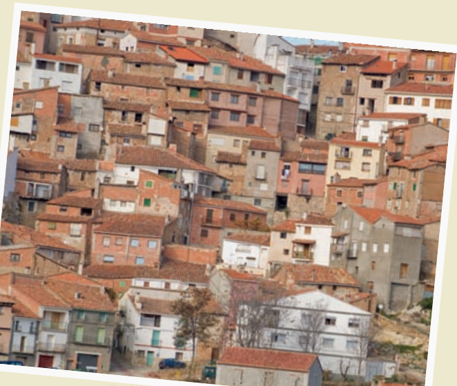
Castielfabib 40° 7' 28.20" N 1° 18' 7.20" W

El tramo del Turia entre Chulilla, Gestalgar y Bugarra, con las últimas pozas de agua y hoces, muestra sus paisajes más modestos antes de abrirse camino por la comarca del Camp de Turia hacia la huerta de Valencia.