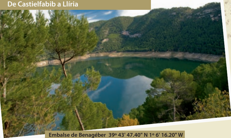
Embalse de Benagéber 39° 43' 47.40" N 1° 6' 16.20" W