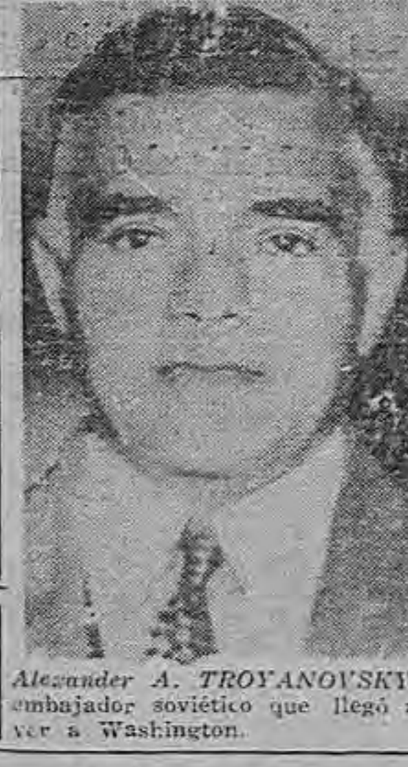
Alexander A. TROYANOVSKY, embajador soviético que llegó ayer a Washington.