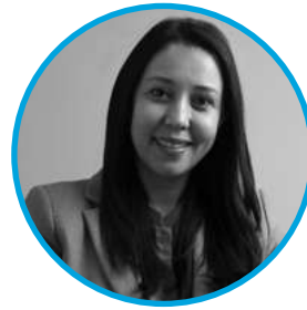
Majda Label CEO - VIVIA