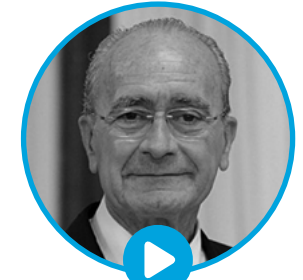
D. Francisco de la Torre ALCALDE DE MÁLAGA