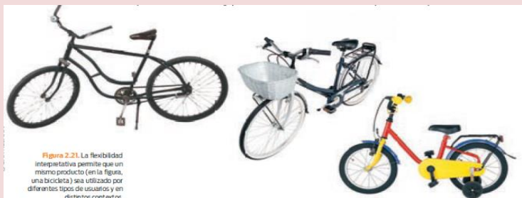
Figura 2.21. La flexibilidad interpretativa permite que un mismo producto (en la figura, una bicicleta) sea utilizado por diferentes tipos de usuarios y en distintos contextos.

4. Escribe en tu cuaderno los diferentes usos que se le da a la bicicleta, en distintos lugares y épocas.