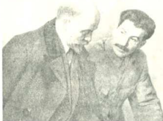
Lenin primero y Stalin después, dirigieron al proletariado soviético en la construcción del socialismo.

La destrucción del aparato estatal burgués por el proletariado y la implantación de su propia dictadura no es más que