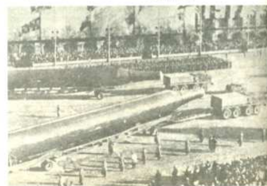
El socialimperialismo soviético supone un grave peligro para la paz mundial.

Pero yo decía que los chinos trabajan para evitarlo y que seguro que resolverían el problema. Que no pasaría como en la Unión Soviética. Y ya sabes que las cosas se han desarrollado de manera distinta que en la Unión Soviética".