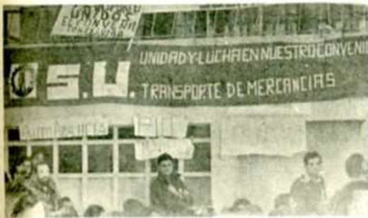
Transporte madrileño: sólo es el principio

Es importante también reseñar en esta lucha el positivo papel desempeñado por el S.U. y la necesidad, para que las luchas triunfen, de reforzar el sindicalismo de clase que hoy representa el S.U.