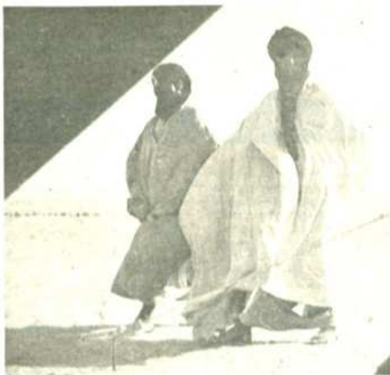
El Gobierno español continúa suministrando armas a Marruecos y Mauritania que utilizan contra el pueblo saharauí

Consciente de esta situación nuestro Partido ha participado activamente junto con la mayoría de los partidos de la oposición en actos de denuncia de la actitud del Gobierno hacia el