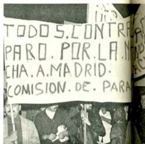
Miles de trabajadores por toda España están luchando conjuntamente. Centenares de miles lo harán unidos en Madrid.

Están convocados encuentros de parados en: Tarragona, Lérida, Gerona, Badalona, Hospitalet, Malgrat de Mar, Sabadell y Ripolllet.