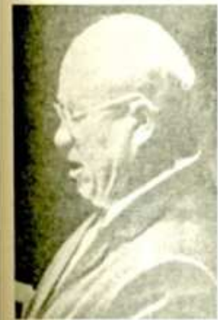
El renegado Krushev, máximo representante de la burguesía rusa que arrebató el Poder al proletariado.

El Partido Comunista es un instrumento decisivo de la dictadura del proletariado, por eso la burguesía trata de controlar y degenerar al partido del proletariado y ponerle a su servicio, pues es así como puede hacerse dueña del Poder del Estado y restaurar el capitalismo.