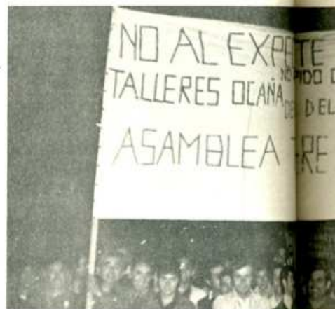
El Pacto de la Moncloa significa aumento de la lucha obrera.

Este es el negro porvenir que tiene reservado el Gobierno a los parados y que el Pacto de la Moncloa, lejos de solucionarlo, agrava.