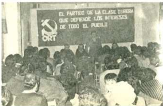
La O.R.T. ha organizado cientos de mítines por toda España estimulando al pueblo para que luche en contra de los planes de UCD de retrasar la elaboración de la Constitución democrática.

Quiero aprovechar, ya que se menciona el Pacto de la Moncloa para decir que éste afecta de forma muy negativa a las mujeres. Las trabajadoras son las primeras que van a ser despedidas por los efectos de los expedientes de crisis y el aumento de paro que trae consigo el pacto.