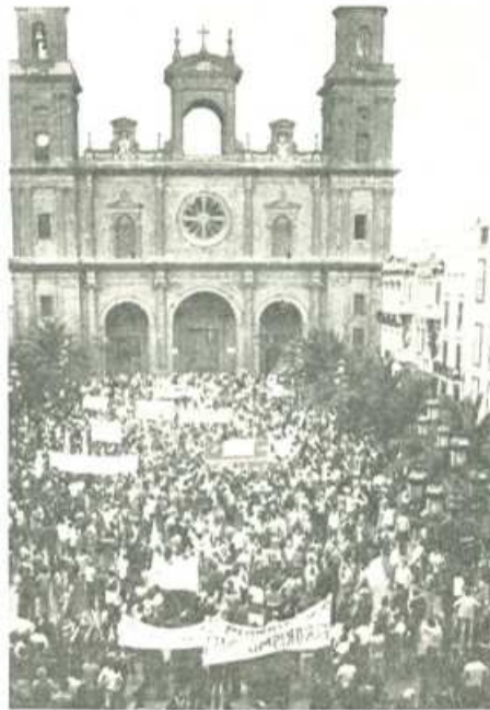
El proyecto político, económico y social de UCD para Canarias no corresponde con las aspiraciones populares repetidas veces manifestadas.

"El socialimperialismo soviético, como superpotencia en ascenso, también utiliza distintos medios para arrebatárselo a EE.UU. su influencia en África y Europa y por tanto en Canarias, queriendo convertir nuestras Islas en base de agresión para sus intereses reaccionarios. Tiene presencia directa por medio de agentes, por medio de la flota pesquera soviética que esquilda la riqueza de nuestros mares y también mediante la introducción de capital soviético en las Islas, buscando el control de algunos sectores de la producción. También potencia movimientos independentistas pro-soviéticos y el desarrollo de propaganda ideológica a favor de sus intereses, utilizando de manera reaccionaria los lazos que unen a los pueblos canario y cubano y la simpatía que entre los trabajadores despertó la revolución cubana que los socialimperialistas soviéticos han castrado".