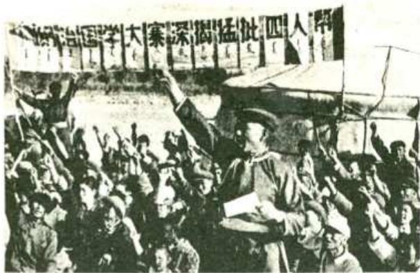
En la República Popular China la movilización de las masas de obreros y campesinos ha sido el mazo con que se ha aplastado una y otra vez a la burguesía. En la foto, pastores critican a la "banda de los cuatru".

R.F.: ¿Cuál te parece que es la contribución principal que los comunistas de Europa y de todo el mundo tienen que hacer en la lucha contra el socialimperialismo soviético, contra el revisionismo moderno y a favor de la revolución mundial?