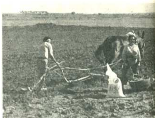
No basta sólo con denunciar las consecuencias nefastas del Pacto de la Moncloa en el campo. Hemos de dar una alternativa viable. El frente común de campesinos jornaleros y obreros la hace realidad.

3).- Revisión general de las exenciones tributarias, que la legislación franquista ha ido introduciendo en favor de los monopolios capitalistas y terratenientes, y por medio