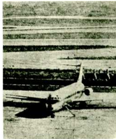
Aviación civil: el Gobierno tanea las fuerzas de los trabajadores.