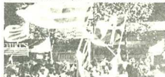
La voluntad autonomista de las masas populares de nacionalidades y regiones ha quedado patente en grandes manifestaciones, las mayores habidas en los últimos 40 años.

A este chantaje hay que añadir los retrasos en las negociaciones, las imposiciones de sus condiciones, el no reconocer ni tan siquiera el derecho autonómico a regiones como Murcia, Extremadura y Castilla la Nueva.