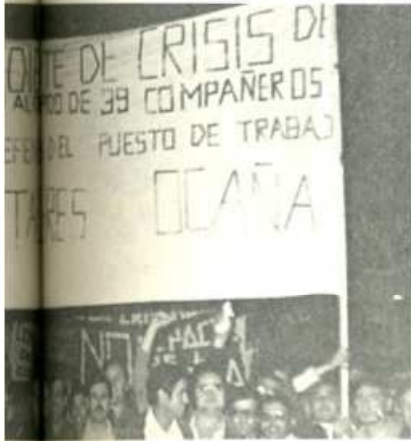
Este movimiento significa defensa del puesto de trabajo.

VALS... por 19 miembros que ha programado asambleas en pueblos y barrios. Han vendido ya 5.000 bonos de ayuda. La prensa ha publicado comunicados de la Comisión en los que se convoca la Marcha y se explica los pasos que se están dando en su preparación.