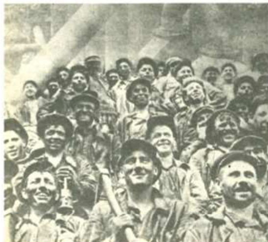
Obreros de la Unión Soviética satisfechos por haber acabado con la explotación, en los años 30

Rote Fahne: ¿Cuáles son, en tu opinión, las causas principales de la degeneración revisionista y la restauración del capitalismo en la Unión Soviética?