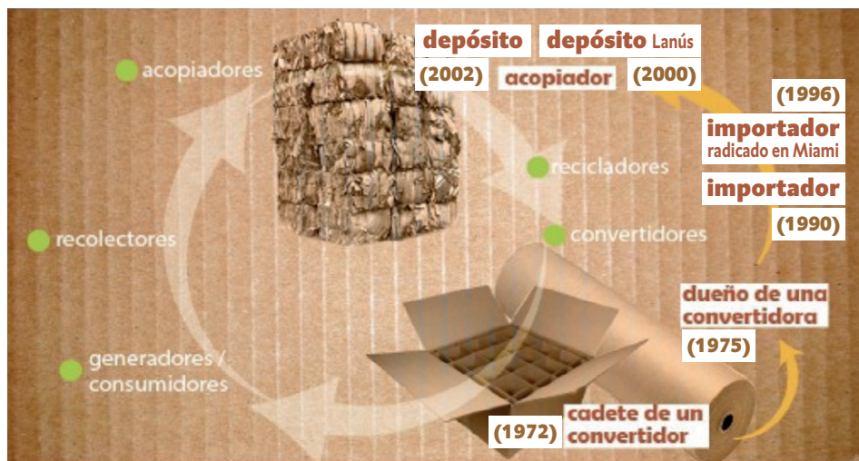
Figura 1. Representación gráfica de la trayectoria laboral del depósito de Mateo en el sector papelerero

Diseño gráfico: Alejandra Unsain y Pablo Schamber.