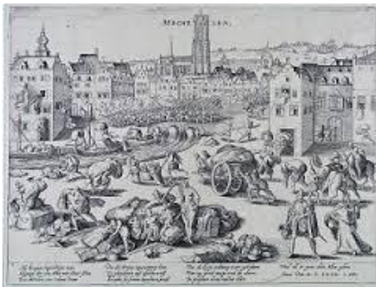
Saqueo de Malinas por los ingleses

Aunque desde hacía tiempo la reina Isabel I de Inglaterra había decidido apoyar a los rebeldes de los Países Bajos, cediéndoles el uso de los puertos de la costa inglesa y con ayuda económica, en estos momentos dio un paso adelante mandando tropas a atacar ciudades leales al rey, como es el caso de Malinas, que fue atacada y saqueada por las tropas inglesas.