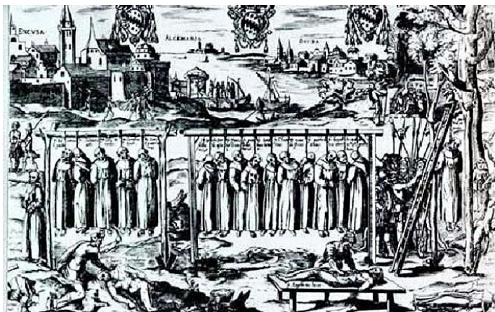
Asesinato y descuartizamiento de religiosos católicos

El 14 de agosto de 1566, víspera de la festividad de la Asunción de la Virgen, grupos de calvinistas incontrolados asaltaron la iglesia de Saint-Omer, y el día siguiente se multiplicaron los asaltos, incluso en la ciudad de Amberes, llevándose a cabo saqueos, destrozos, quemas de templos, así como persecución y asesinato de católicos, en varias localidades. Estas actuaciones cogieron de improviso a la gobernadora Margarita de Parma, encontrándose los rebeldes con una ausencia total de autoridad, adueñándose el caos de los Países Bajos. Los desmanes y abusos de los calvinistas prosiguieron durante varios días en lo que fue llamada “furia iconoclasta” 26 .