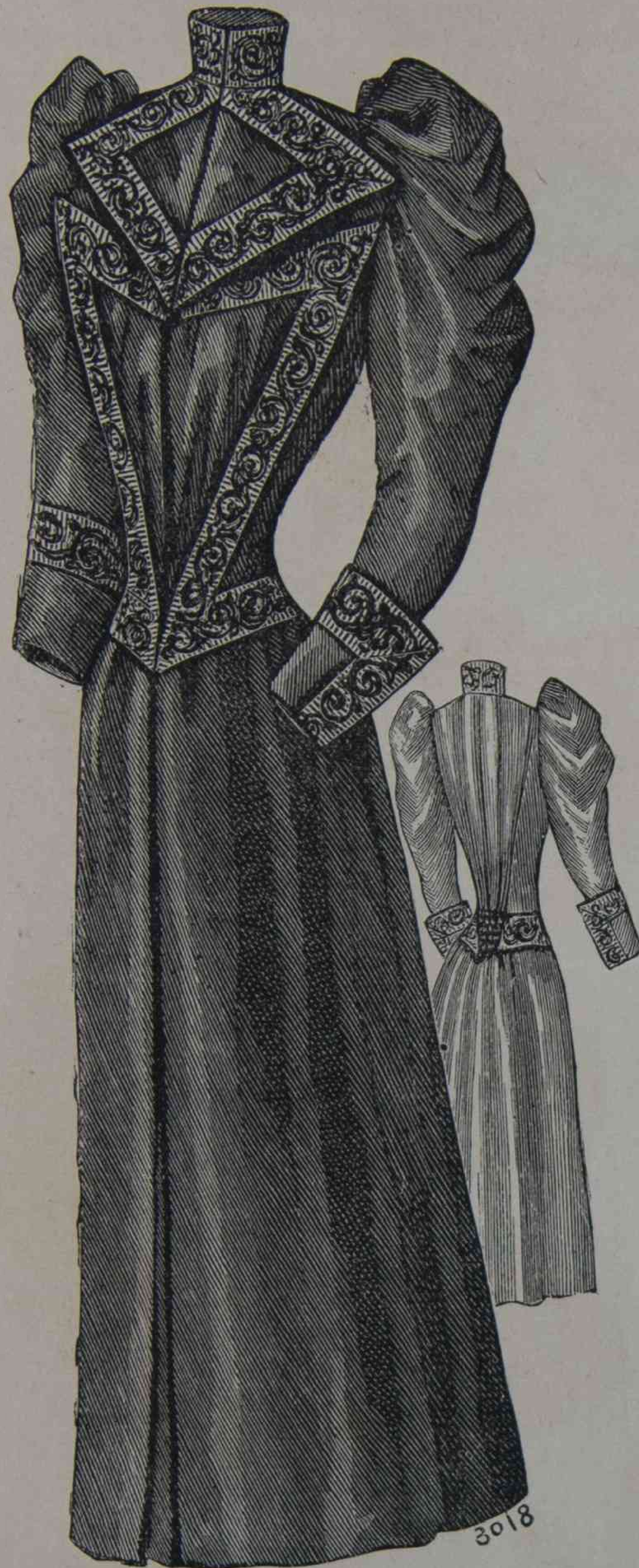
6 y 7. — Abrigo Alexandre ( delantero y espalda ).

A. 11 y 12. —Señorita de 14 á 16 años ( delantero y espalda ). —Falda y plastron de una sola pieza, en faille beige. El bajo de la falda está adornado con dos volantes en terciopelo marron. Chaqueta de terciopelo marron abierta por delante y formando detrás faldones de casaca vueltos. El plastron está adornado con dos líneas de botones plata. Mangas de terciopelo marron, adornado de volantes en faille beige formando jockeys. Cuello derecho. (El patron de este traje lo damos en la hoja de patrones dibujados n° 40.)