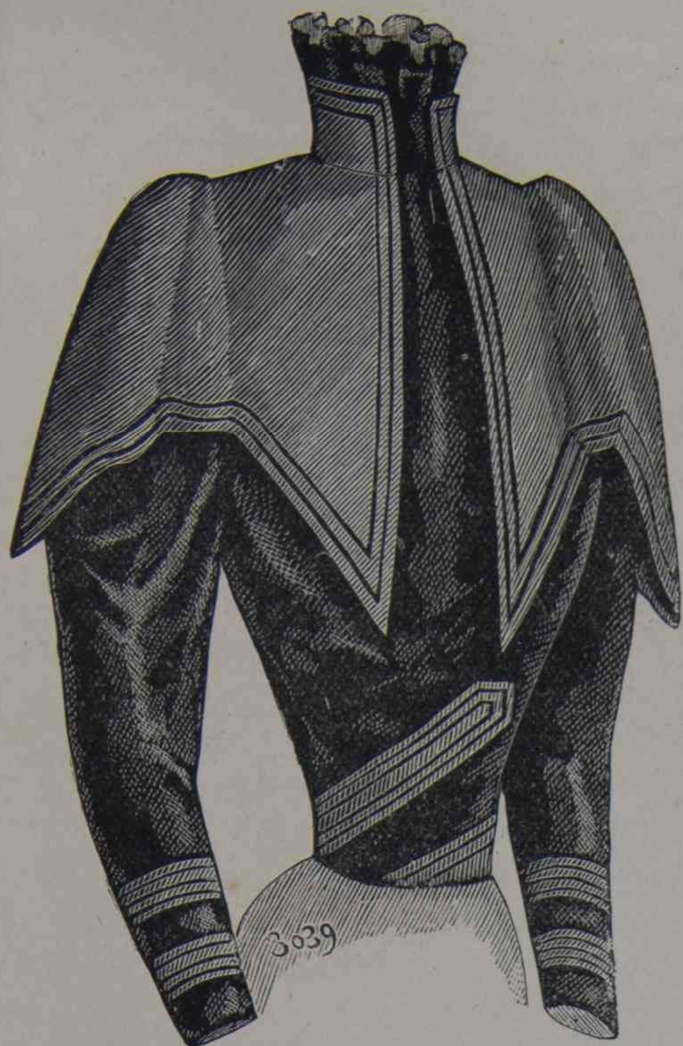
C. 16. — Cuerpo Elvira.

un grandor mediana, los de pequeños bordes adornados sobre el lado de nudos levantados, luego los grandes bordes ondulados con anchas ala, empenachadas de plumas y el sombrero de género, con fondo puntiagudo, aunque cuadrado; la moda no conoce obstáculo; luego el cónico esto es; una lucha entre el Imperio y la Restauracion con la punta de modernismo, sin la cual no hay moda aceptable. Este sombrero aunque debe pertenecer, por su aspecto á los sombreros redondos está cerrado y vuelto correcto por las bridas.