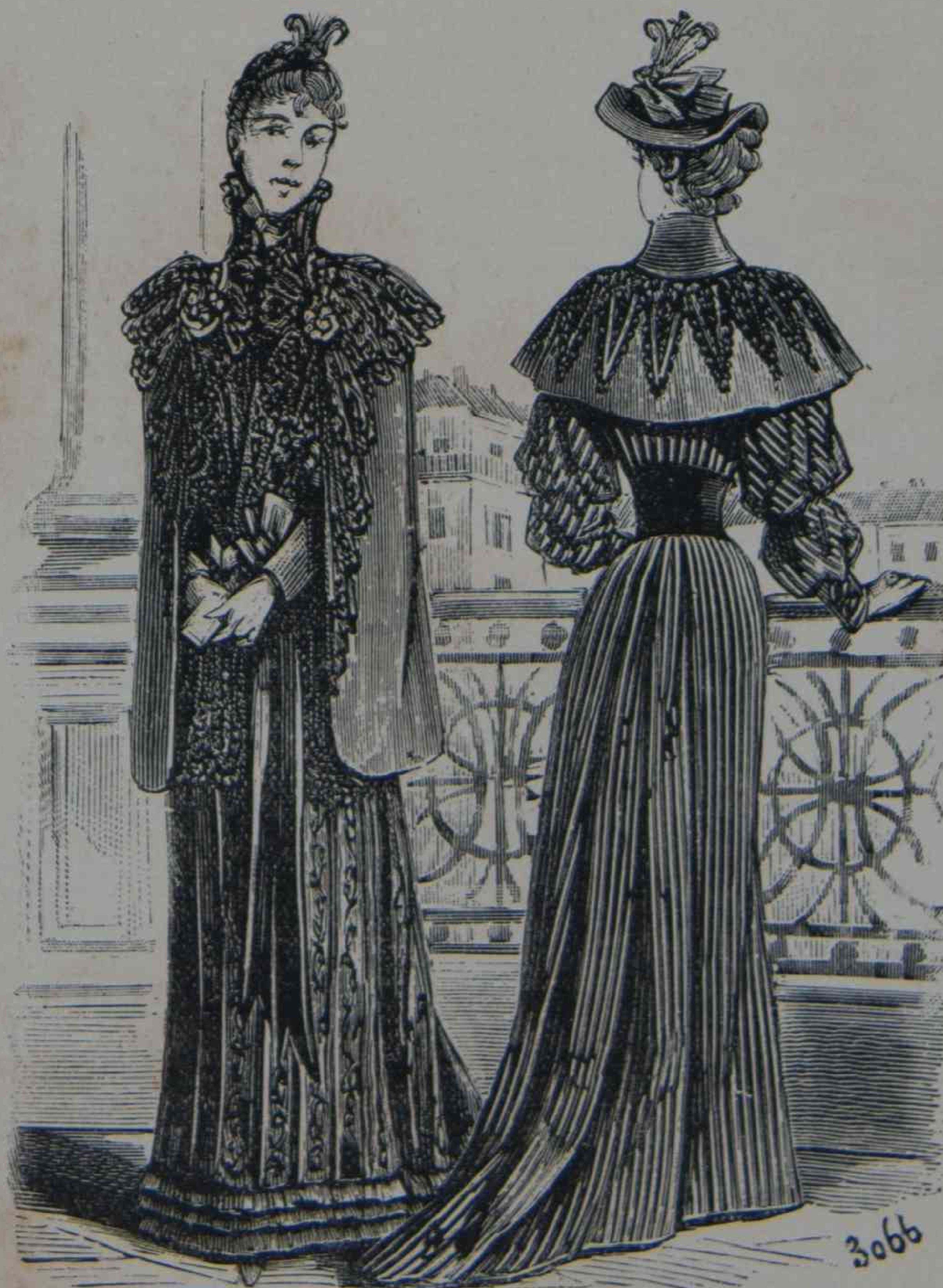
Toilettes de invierno, espalda del figurin en color n° 40. (Vease las explicaciones, pagina 266.)