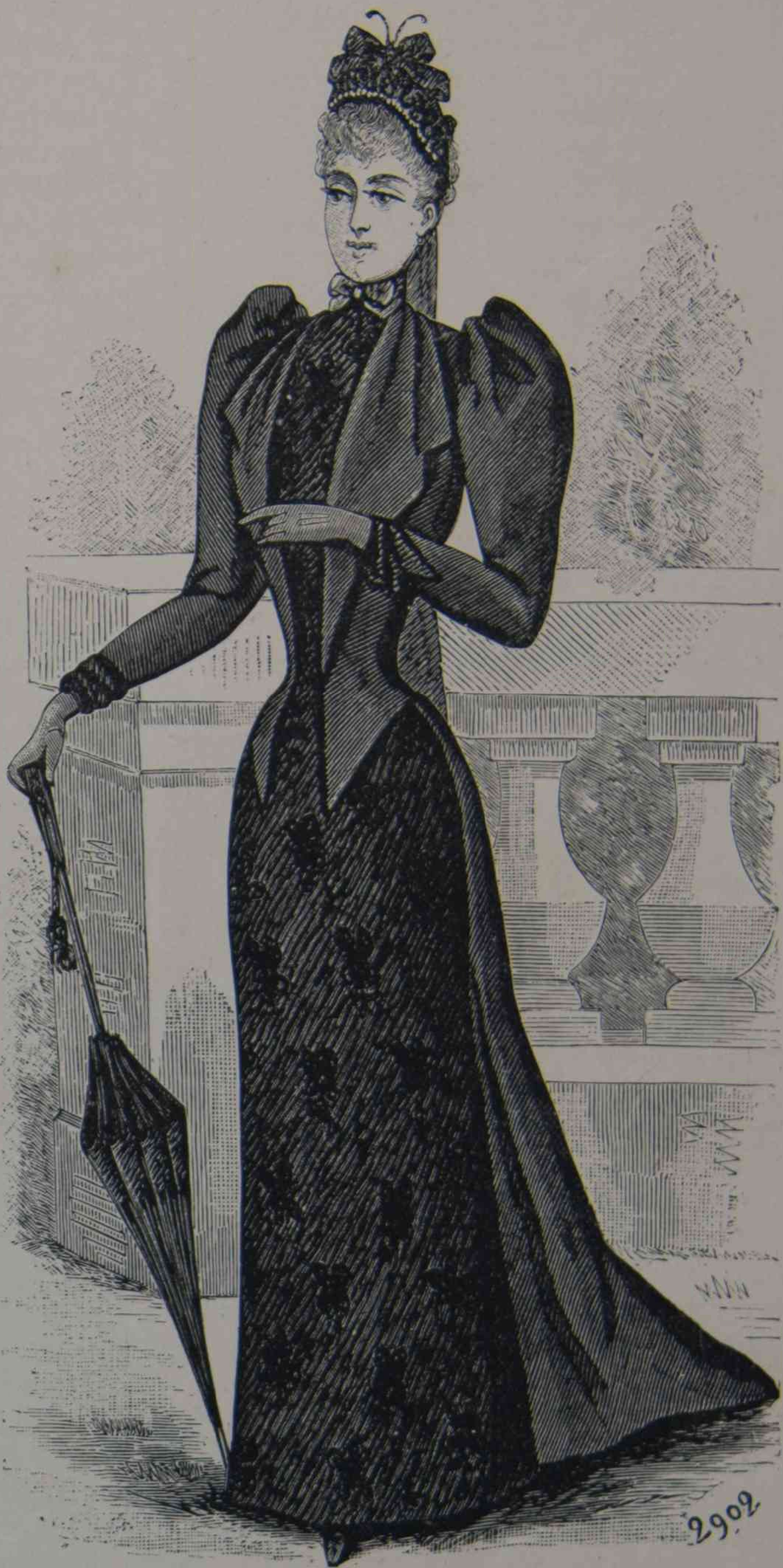
19. — Toilette de luto.

Noto, para concluir, una capota en peluche marfil, forrada de raso del mismo tono, adornada de guipur, de plumas blancas y de un nudo de raso pasado á una hebilla. El traje de niño por el cual está preparada está capota, es en terciopelo azul de rey, con vueltas y forro de raso marfil.