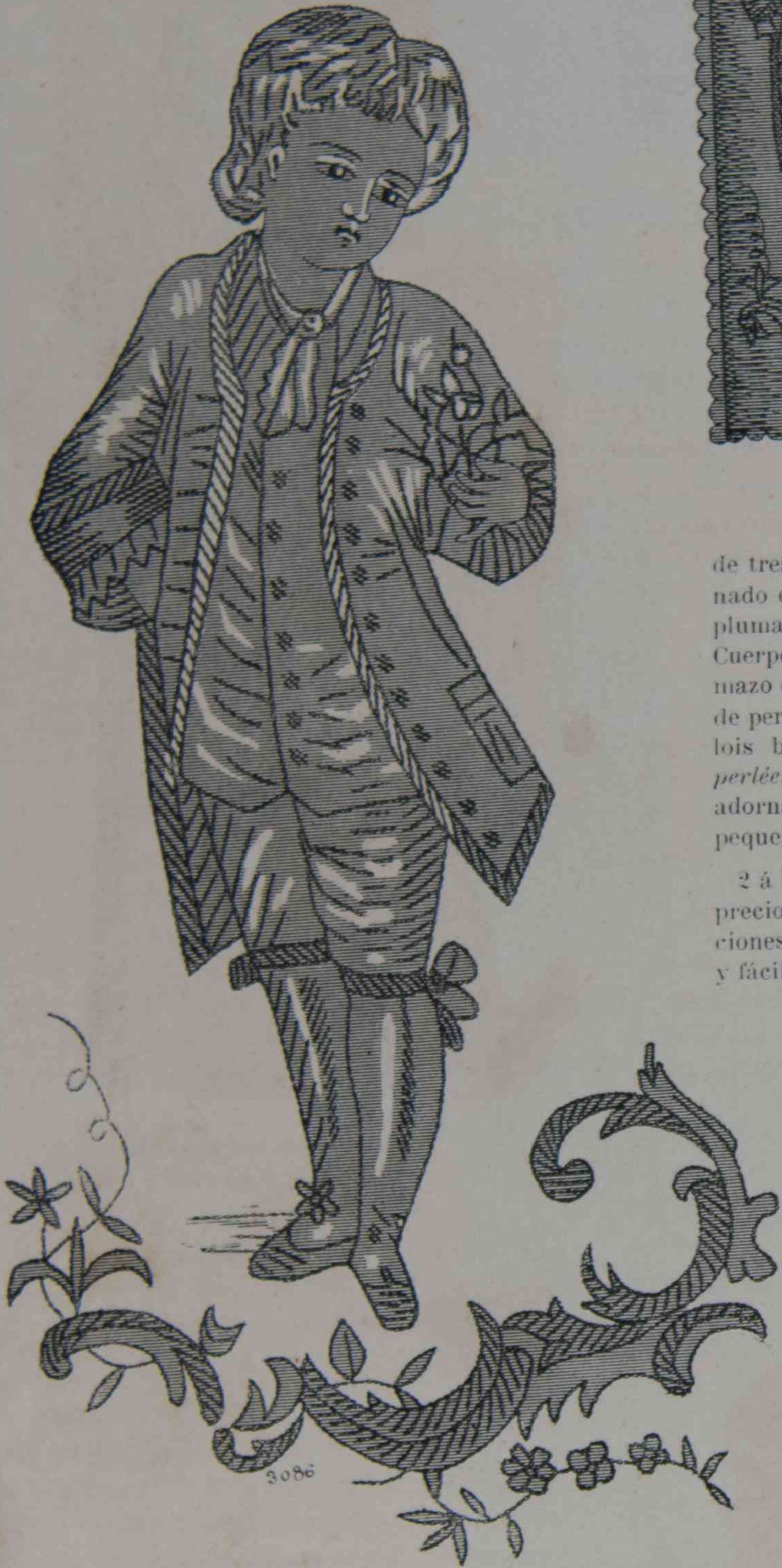
3. — Aplicaciones del Porte-Brosses.

lanceados y puntos lanceados muy largos con seda de Argel de varios colores (un hilo de seda basta), no hay colores determinados para el bordado, podeis utilizar los cabos de seda. Solo me falta sacaros del atolladero para las figuras, nada más sencillo: Trazad las líneas con tinta y bordadlas en cordoncillo negro. Para los ojos, haced un punto anudado negro y un punto atrás en seda blanca de cada lado. Estos dos puntos dan la expresion á la figura. Os aconsejo tambien algunos puntos en hilo de oro, en tonos oro viejo, para aclarar los trages. Los cabellos se hacen en los tonos de oro viejo inclinándose al rubio para la joven, y en madera oscura para el chico. Los soubassements se hacen al punto lanceado amarillo para los adornos, azul y rosa para las flores. Pasemos ahora á la montura: Tornad un pedazo de género teniendo 2 ctros de ancho sobre 40 de alto para debajo; cortad en dientes, si el género lo permite y redondead lo alto. Para encima, es decir para los bolsillos tomad un pedazo de género parecido al de debajo pero midiendo 50 ctros de ancho y 23 de alto; cortad igualmente el borde en dientes, ó bien cuando los dos pedazos están reunidos, encuadrad el