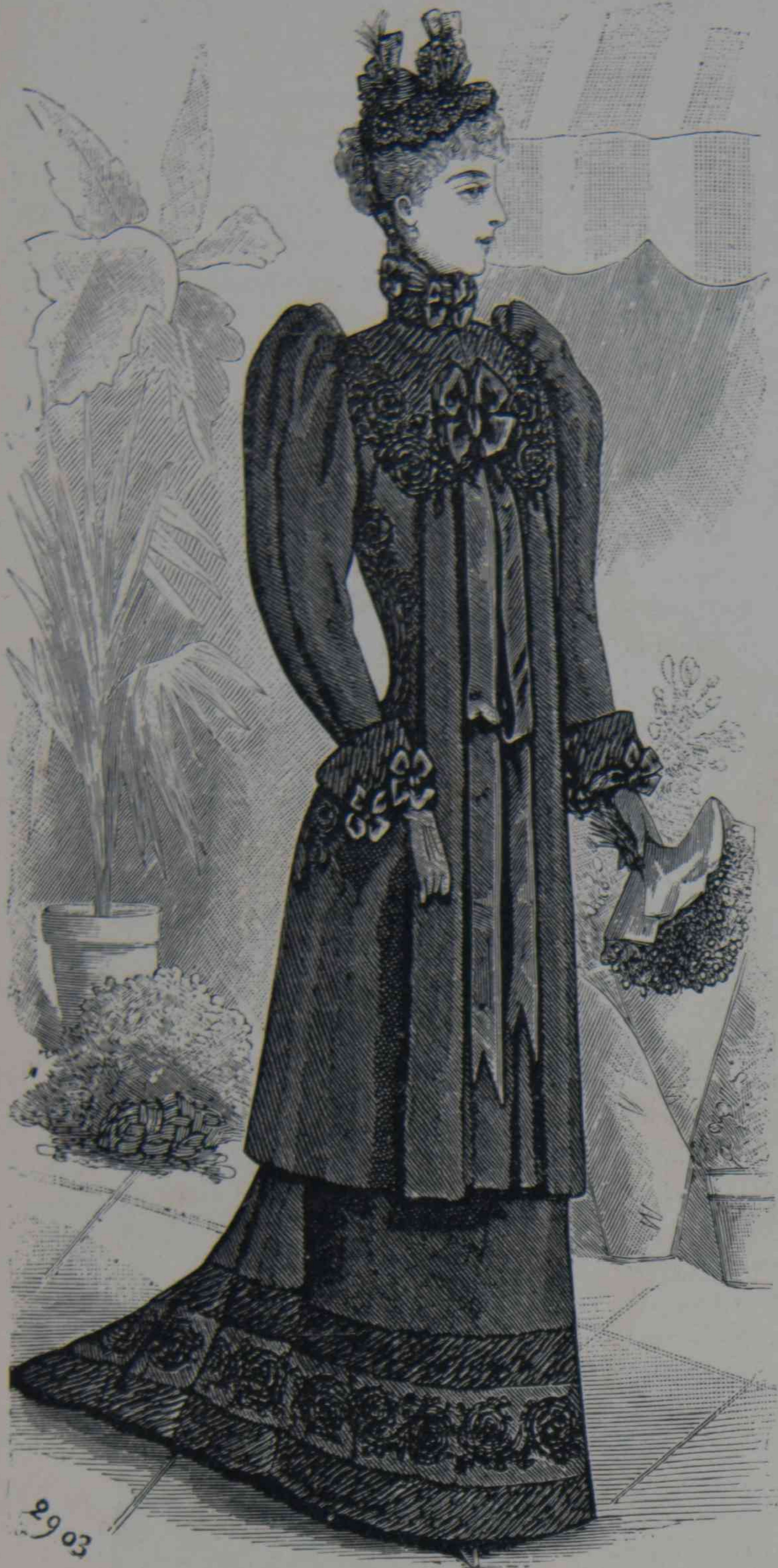
10. — Toilette de lutto.