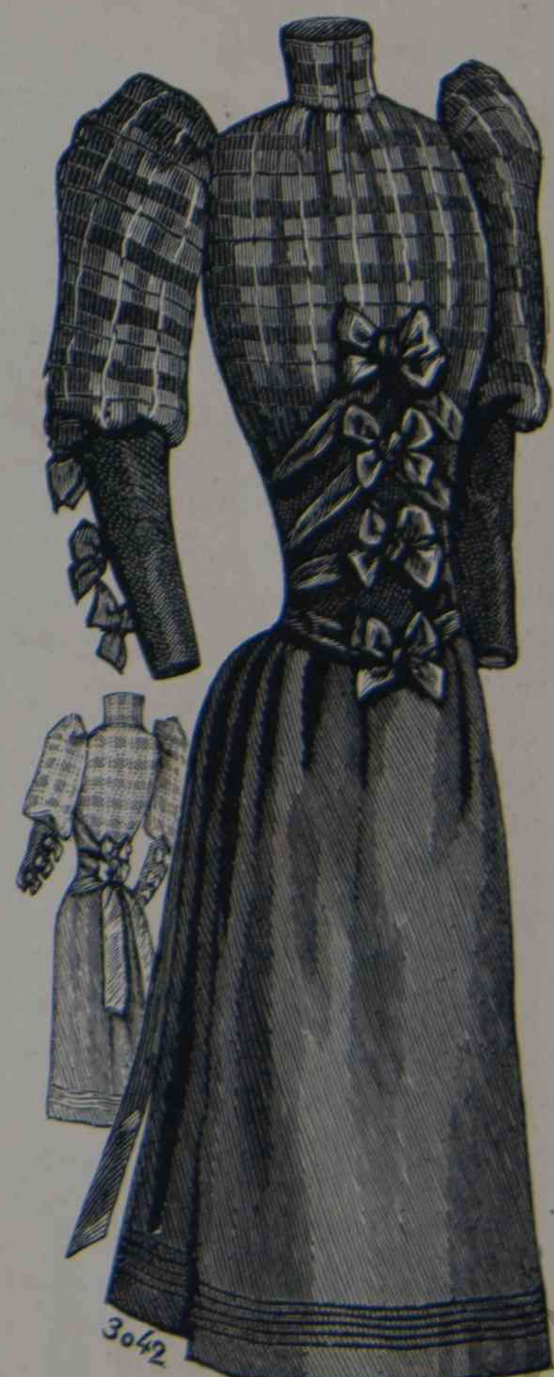
20 y 21. Señorita de 14 á 16 años (delantero y espalda).