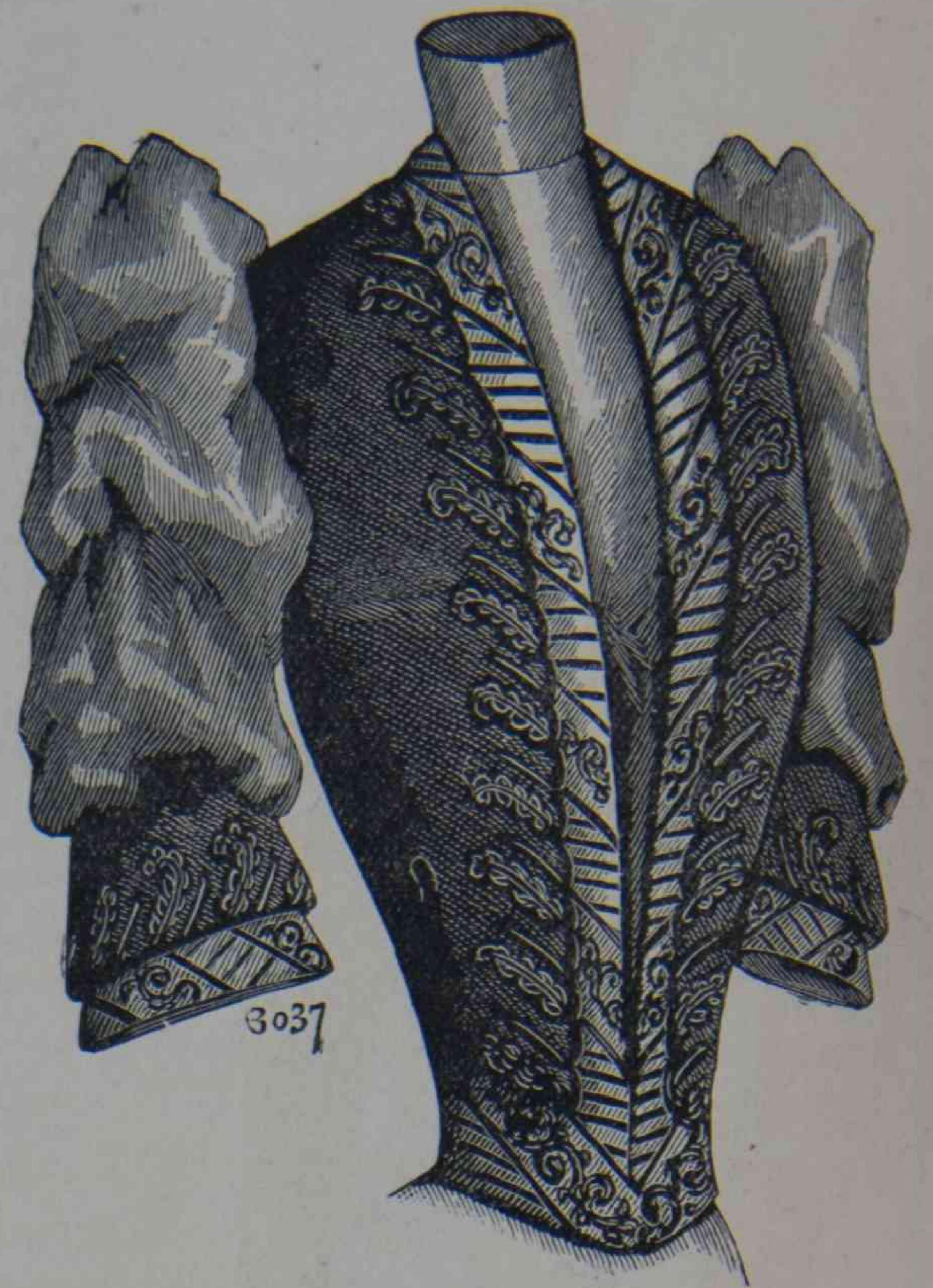
B. 13. — Cuerpo Diana.

en fieltro ó terciopelo presentan tres formas: los de