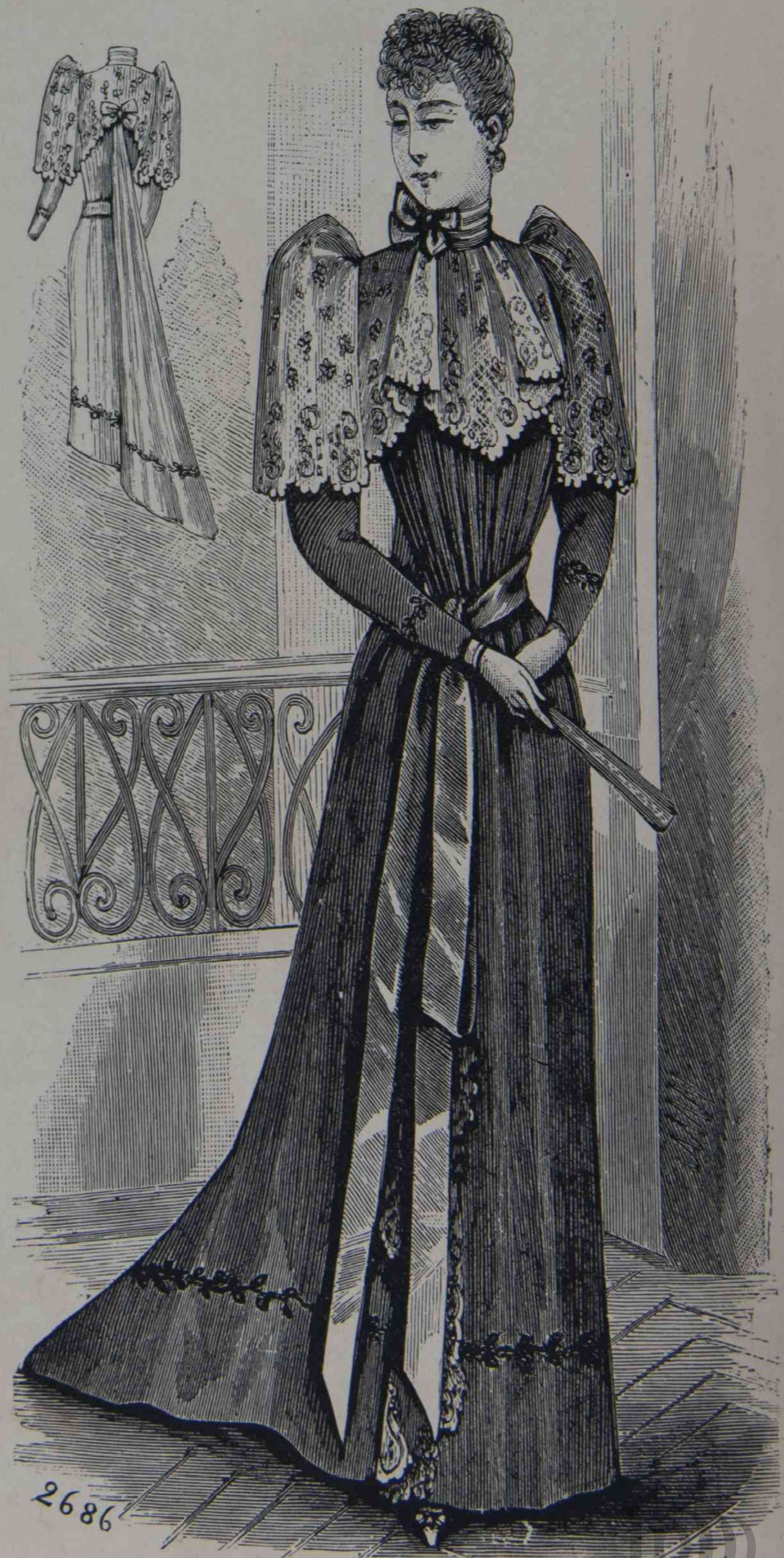
14 y 15. — Trage de interior (espalda y delantero).