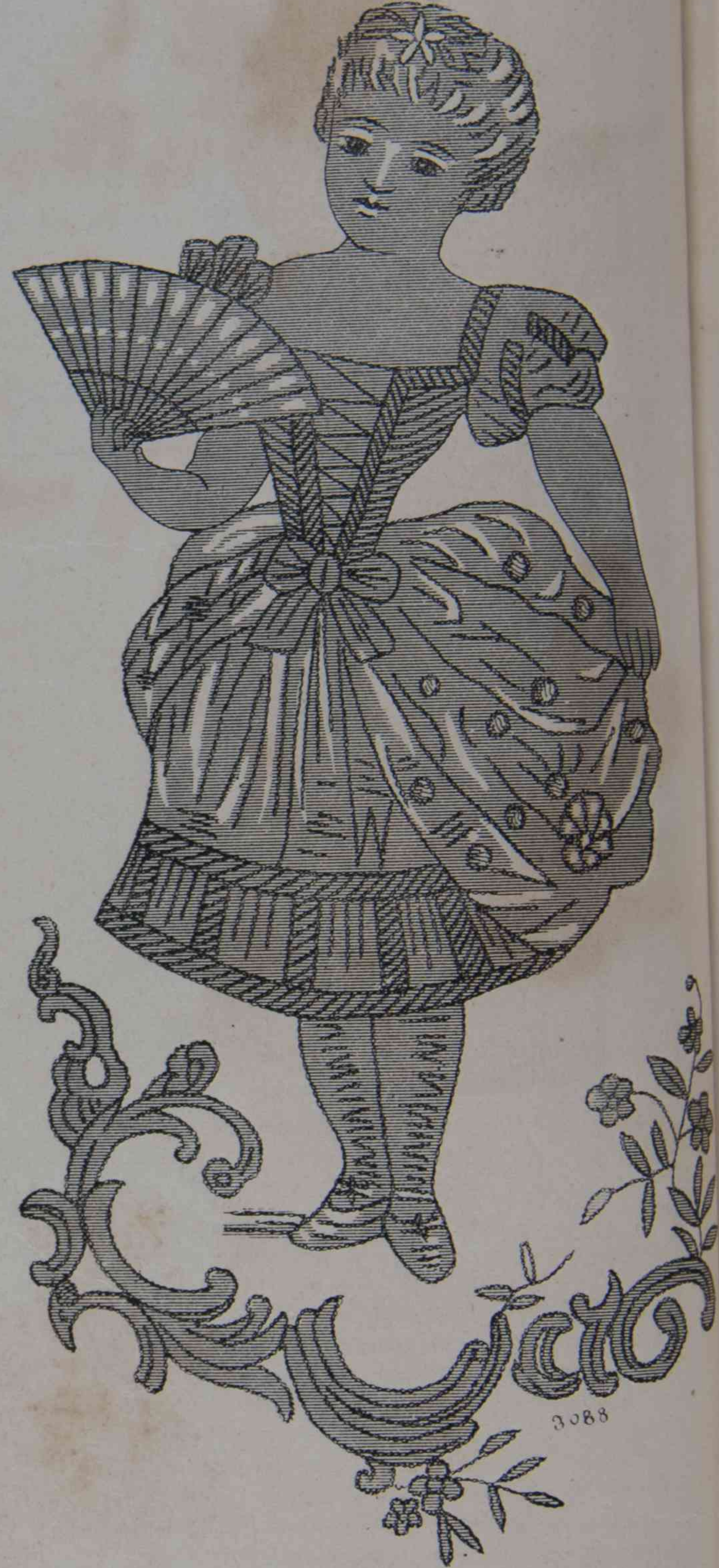
4. — Aplicaciones del Porte-Brosses.

trabajo de un pequeño encaje en metal dorado. Aplicad el género de encima sobre el de debajo haciendo pliegues iguales: Son estos pliegues los que forman los bolsillos: hay dos en cada bolsillo.