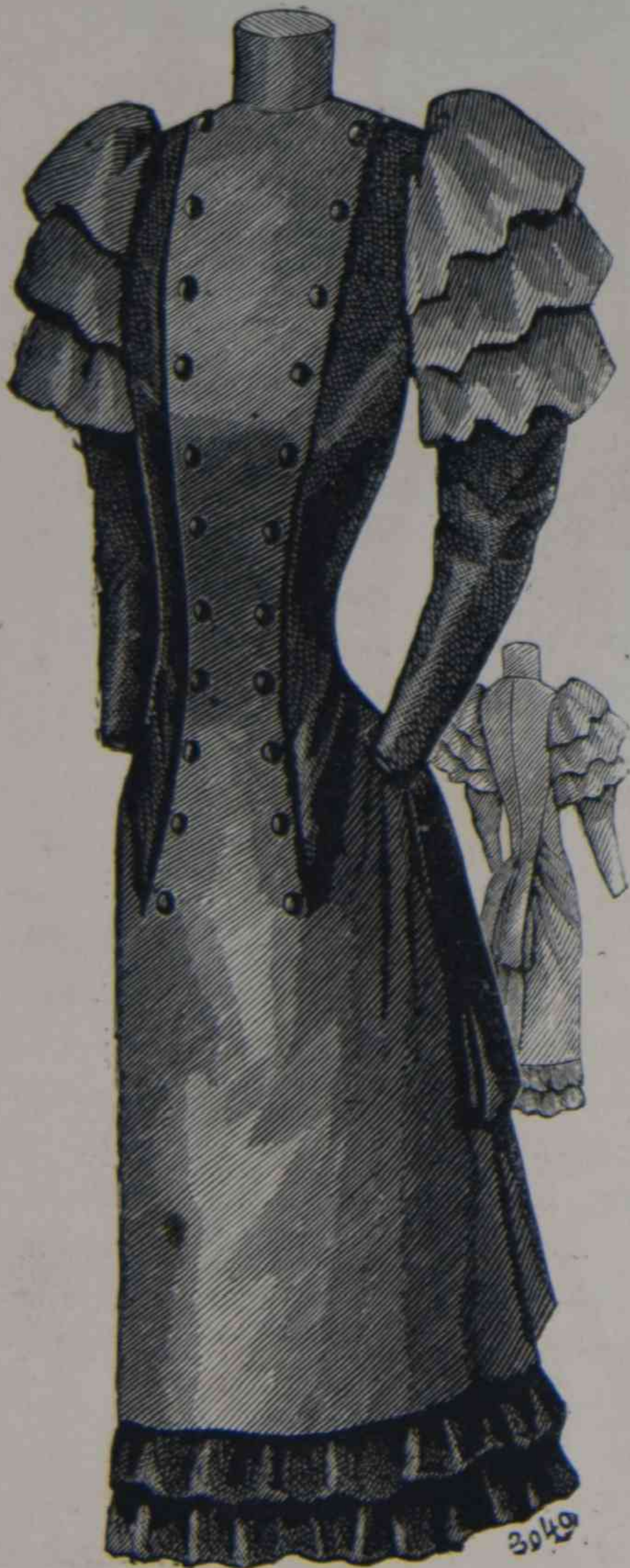
A. 11 y 12. Señorita de 14 á 16 años (delantero y espalda).

que es una moda dentro de la moda, y no una obligacion á la cual no puede apartarse, es que citando estos trajes se dirá: « M me X... llevaba un delicioso traje Imperio », ó fulana de tal otro calificativo, como se decia hace algunos meses: « M me X... llevaba un adorable traje con cuerpo Luis XVI. una toilette Luis XV », etc.