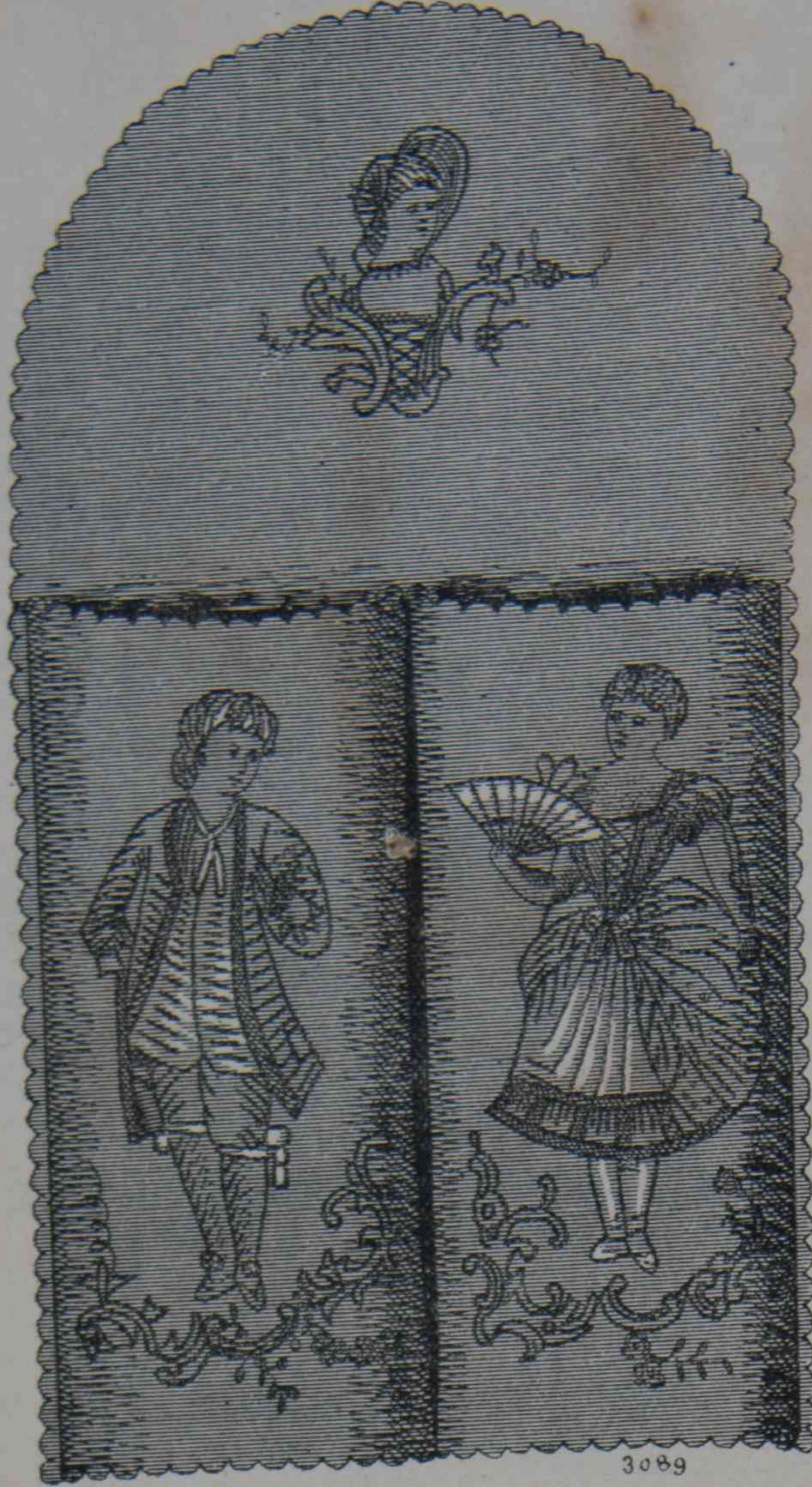
2. — Porte-Brosses para recibidor.

Grabado iluminado n° 40. —TOILETTES DE INVIERNO: Primera toilette. —Abrigo pelerina en terciopelo viejo rojo, adornado de tiras bordadas de cabochons de azabache. Collerette de encaje negro, adornado de azabache, cayendo delante en coquillés hasta los bajos de la pelerina. El delantero del abrigo en encaje negro, forma dos paños cruzados, apretados en el talle por una cinta de raso negro con largos caídos. Trage de cola, en pékiné moiré y raso, negro, adornado en los bajos de tres pequeños volantes llanos en raso negro. Capota de