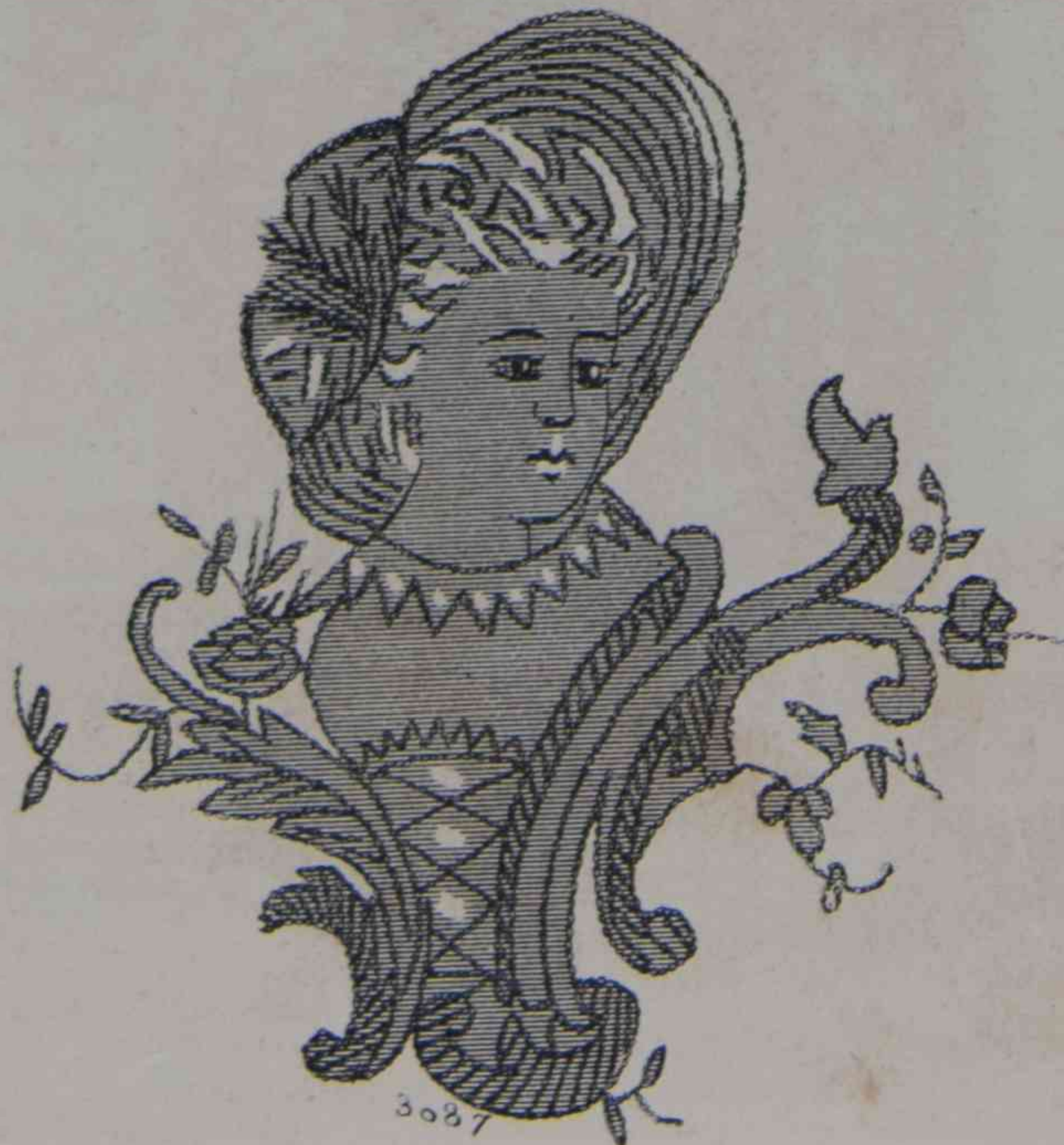
5. — Aplicaciones del Porte-Brosses.

1. —Toilette de ceremonia, casamiento ó reception. —Traje con cola cuadrada, en terciopelo rubi. El delantero de la falda, muy ajustado, está adornado