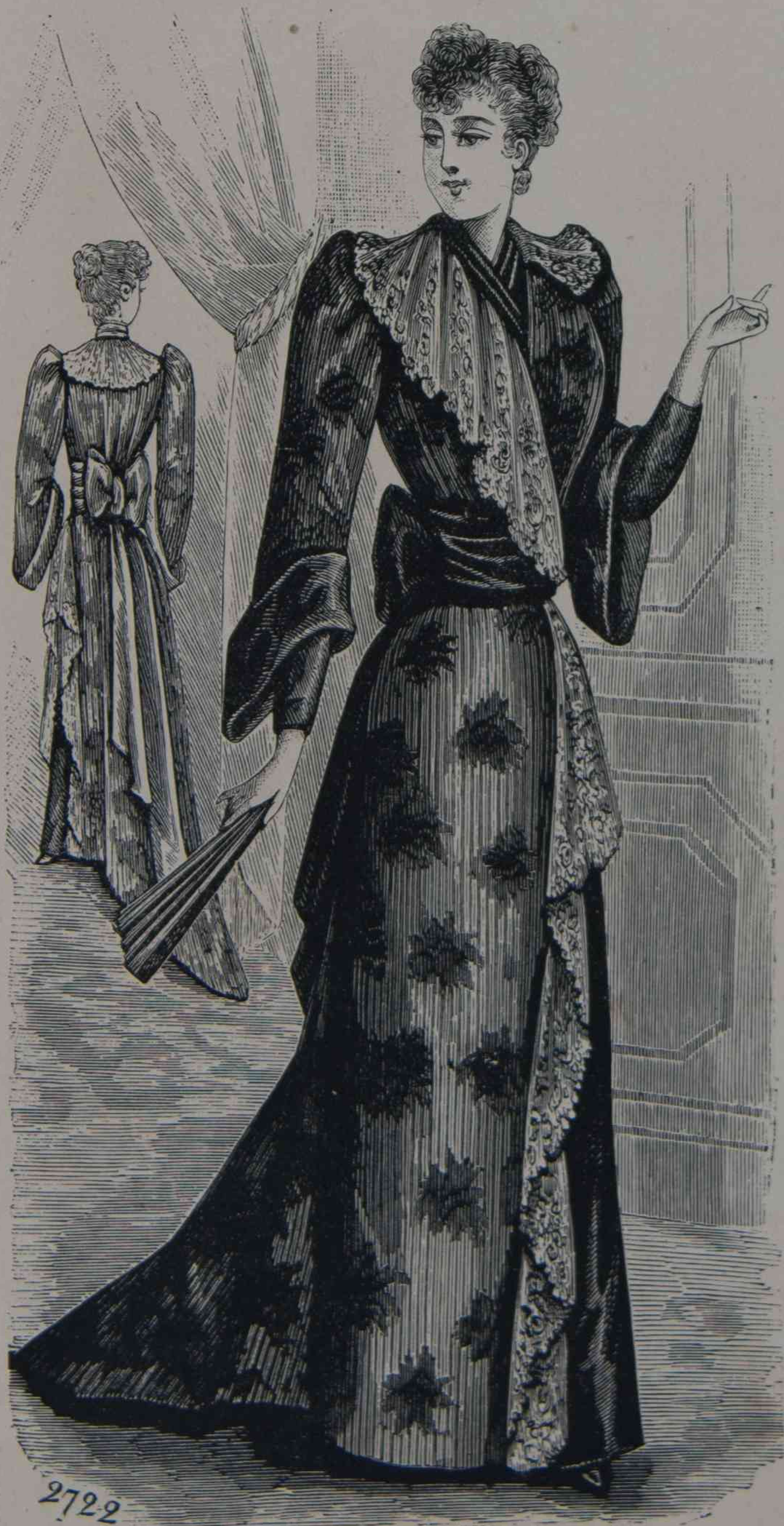
17 y 18. — Traje de interior, género japonés (espalda y delantero).

Un tiempo fué mi defensa Del amor en la pendiente; Ayer me decia ¡siente!