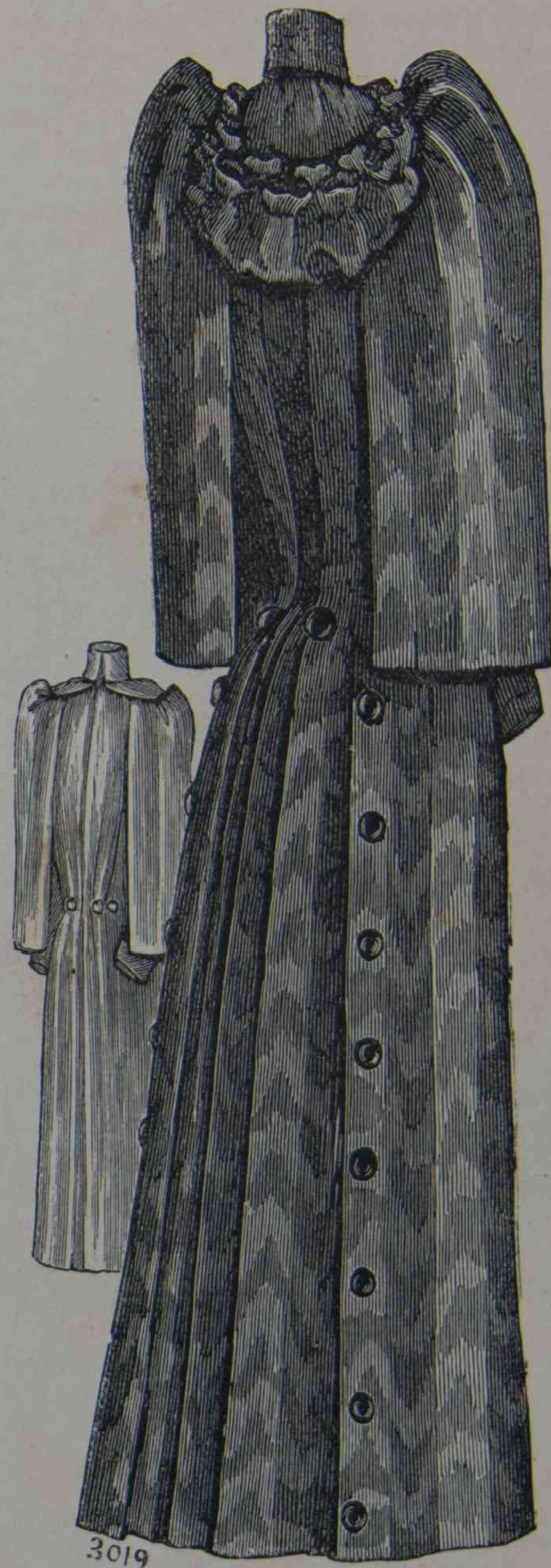
8 y 9. — Abrigo Biarritz ( delantero y espalda ).

He aqui lo que me parece ser lo prudente: es antetodo seguir su pendiente para la de las modas que preferimos y que encuadan mejor nues-