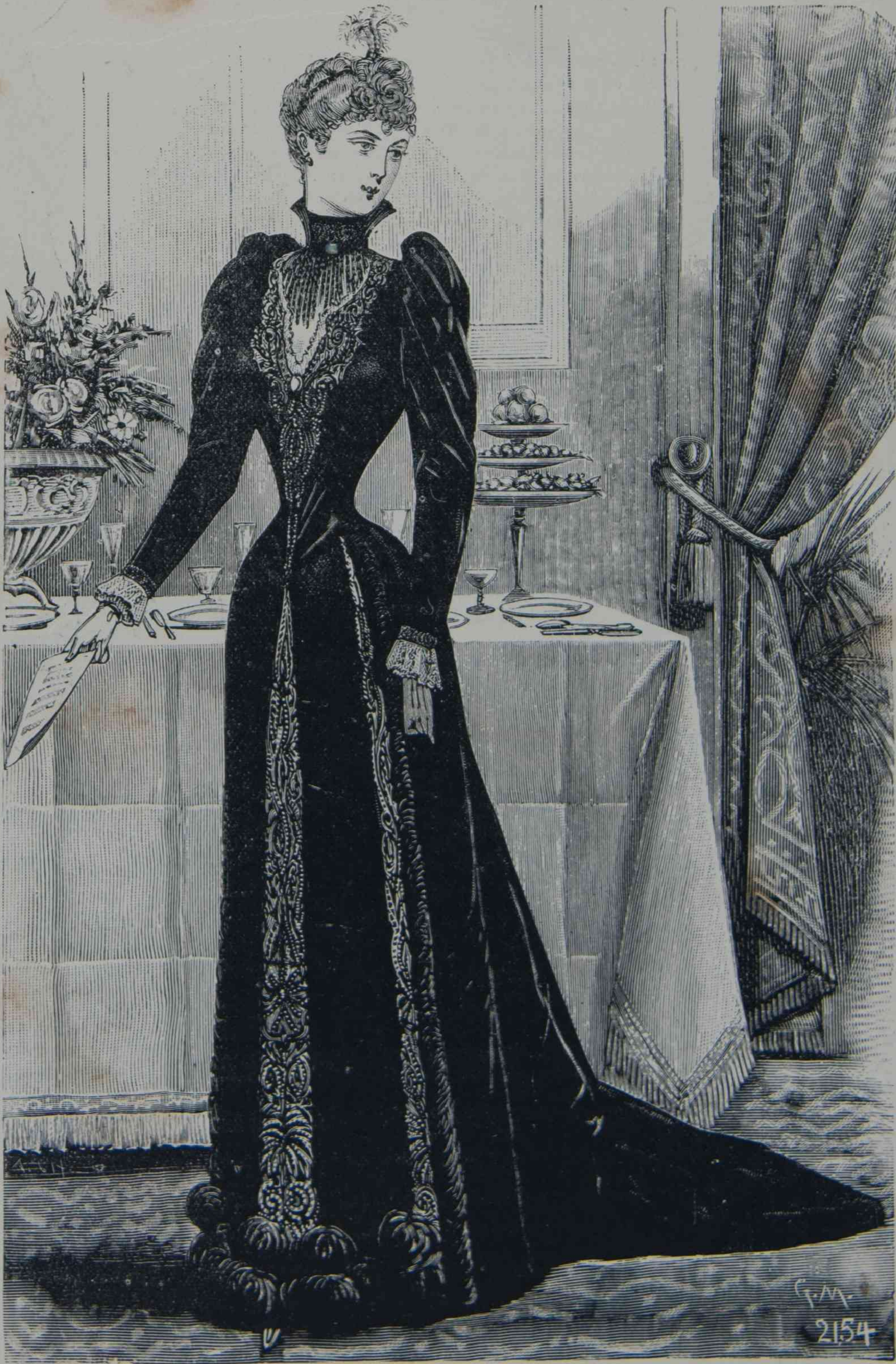
1. — Toilette de ceremonia, casamiento ó recepcion.

La policia que tenia sus señas pudo facilmente prenderlo al momento que salia del hotel en que se alojó.