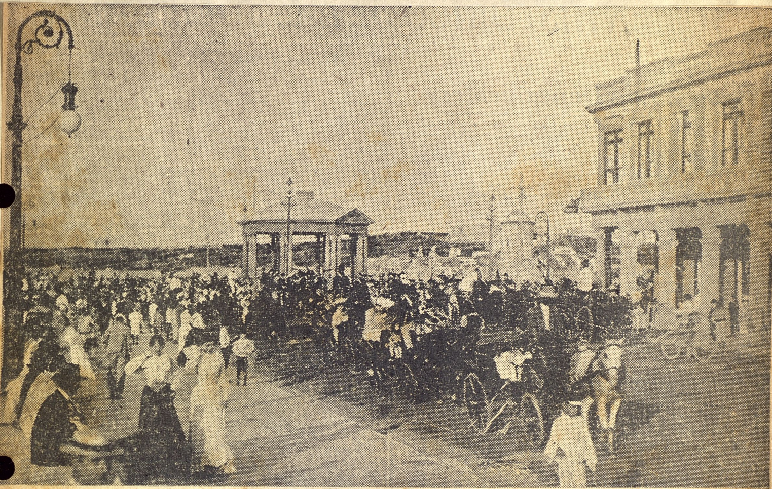
Imperio de los landos, coches y quitrines en el romántico y casi bucólico carnaval de principios de siglo, cuando todavía las flores y las serpentinas eran los únicos alegres atributos de Momo.