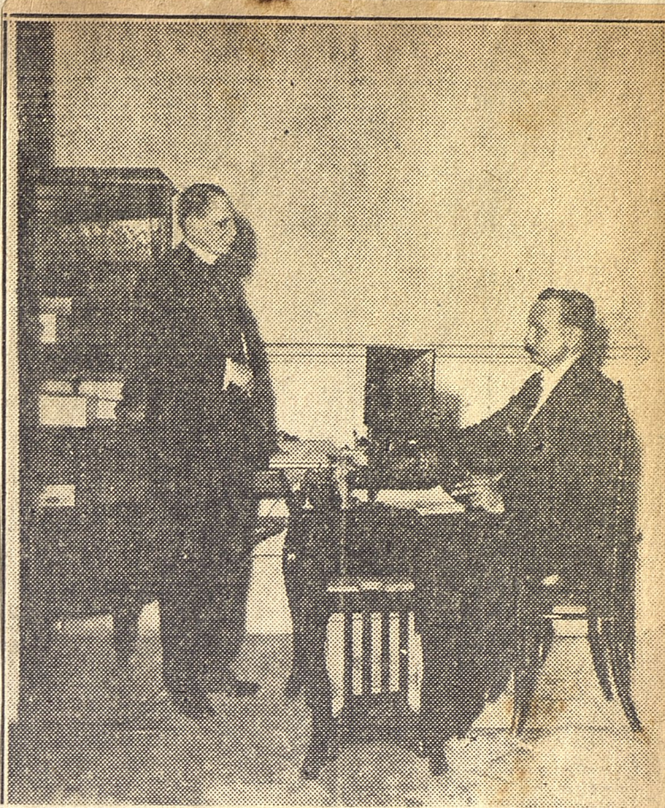
De la sencillez de don Tomás Estrada Palma habla elocuentemente esta fotografía en la que se le ve cumpliendo el cotidiano despacho de documentos con su secretario particular.

ro, desde la parada de Neptuno y Belascoain: