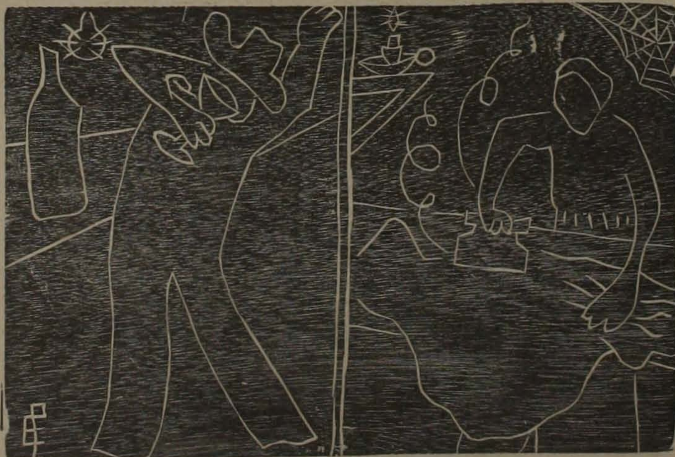
Explotación de la mujer por el hombre