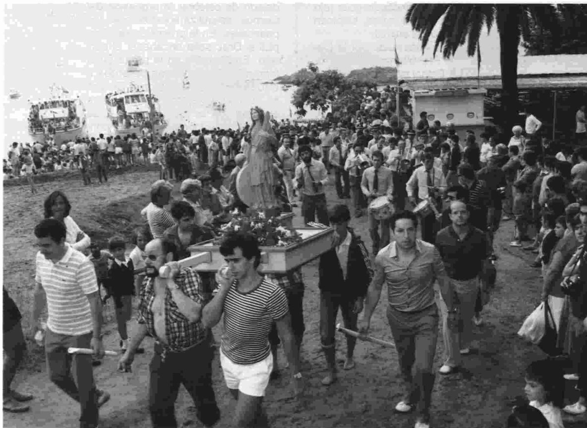
La procesión subiendo hacia el santuario.