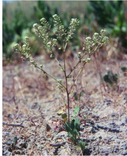
Lepidium cardamines en un claro de albardinar.

Vemos pues que en estos hábitat existen especies singulares de flora que necesitan protección. Por otra parte desde la declara-