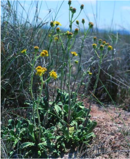
Senecio auricula en los taludes próximos a la laguna.

coralillos rojos ( Microcnemum coralloides ) que comienzan a desarrollarse a principios de verano y están completamente agostados al finalizar la estación. Esta última especie está catalogada de interés especial en Castilla-La Mancha.