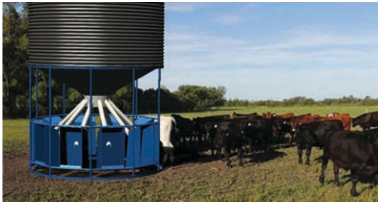
Imagen 2. Comedores de dosificación variable de alimento.