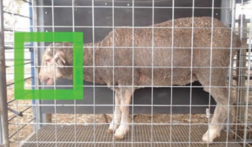
Imagen 3. Captura de imágenes para determinar el score de cobertura de cara.

acotada a los planteles puros de pedigrí o y algunos pocos planteles PPC. Con este tipo de sistemas se podría masificar los registros genealógicos y mejorar la precisión de las evaluaciones genéticas.