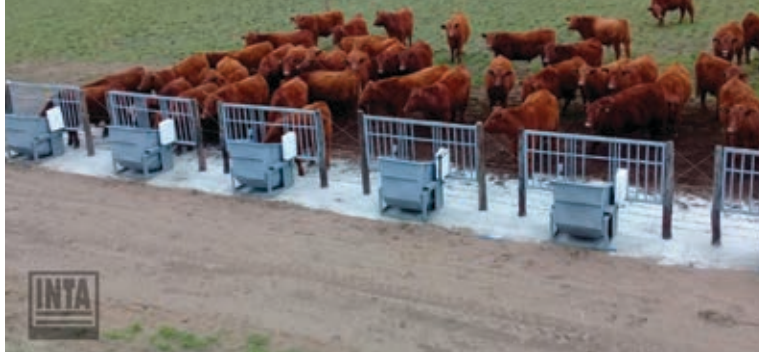
Imagen 1. Comedores de consumo residual desarrollados por INTA Anguil.