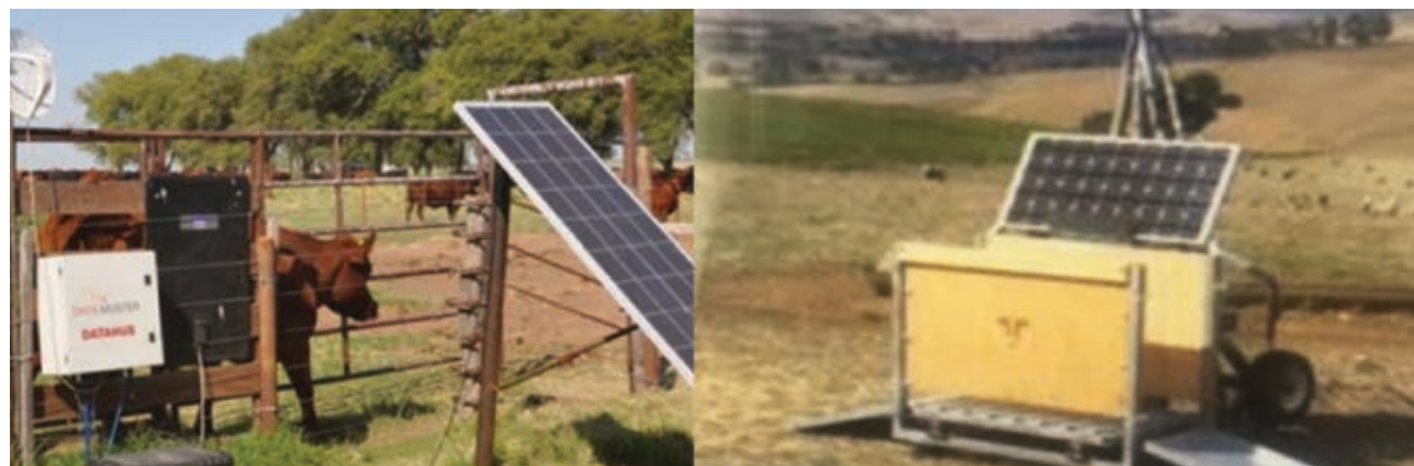
Imagen 6. Balanza de pesada al paso para bovinos y prototipo para ovinos.

Probablemente una de las preguntas que surja al leer el artículo es que tanto falta para que estos